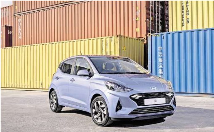
Der Hyundai i10 ist einer der beliebtesten Kleinwagen auf dem Markt.

Dass der i10 aber nicht nur hochmoderne Konnektivitätslösungen bietet, sondern ebenso eine zeitgemäße Antriebstechnik, zeigt der Blick auf die zur Wahl stehenden Motoralternativen. Zur Wahl stehen der 1,0-Liter-Motor wie auch das stärkere 1,2-Liter-Aggregat. Bei beiden Antrieben hat Hyundai auf Leistungsfähigkeit und Effizienz geachtet.