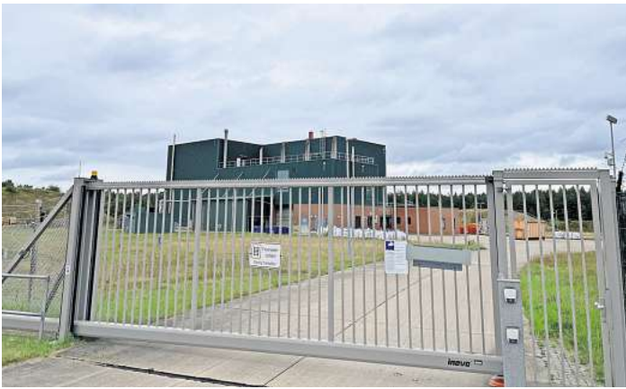
Das Gelände, auf dem sich der Sprengofen befindet, ist extra abgesperrt.

OSTHOLSTEIN/MUNSTER. Das Gelände neben der Straße ist eingezäunt. Alle paar Hundert Meter hängt ein weißes Schild. In schwarzer Schrift steht dort geschrieben: „Militärischer Sicherheitsbereich. Unbefugtes Betreten ist verboten! Vorsicht Schusswaffengebrauch!“ Hier am Rande von Munster in Niedersachsen befindet sich ein riesiger Truppenübungsplatz der Bundeswehr. Dort befindet sich Geka. Sie vernichtet im Auftrag des Bundes Kampfstoffe und Altlasten – bald auch Granaten, Bomben und Minen aus der Ostsee.