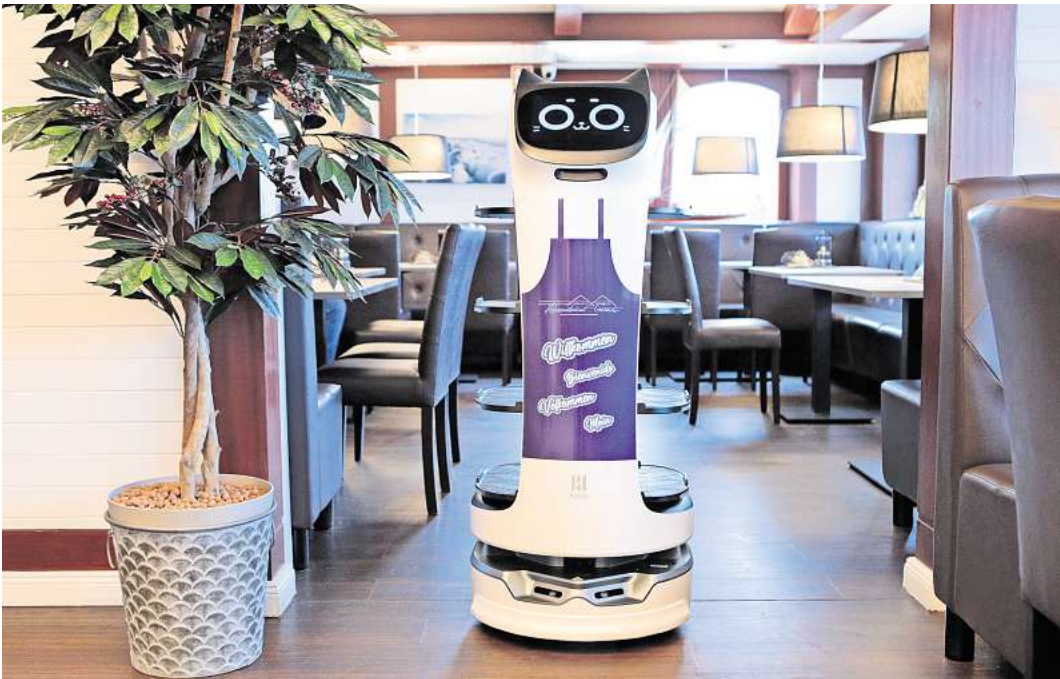
In der Gastronomie helfen immer häufiger Roboter den menschlichen Mitarbeitern.

Zudem sind in Ostholstein massiv Arbeitsplätze im Tourismus aufgebaut worden. Marzian: „Allein im Gastgewerbe sind von 2019 bis heute 1000 zusätzliche Jobs entstanden.“ Auf der anderen Seite bringen diese eigentlich guten Nachrichten Negatives mit sich. Die Betriebe finden nicht genug Personal – und diese Situation wird sich noch verschärfen. In den kommenden zehn Jahren