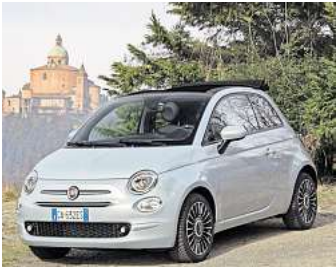
Der Fiat 500 Hybrid ist für die Liebhaber des Fiat 500, der nicht mehr bestellbar ist, eine gute Alternative.

Aufgrund der großen Nachfrage hat das Autohaus am Bungs-