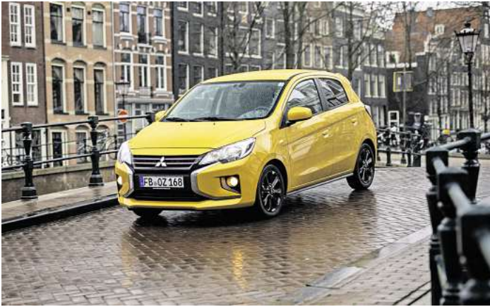
Der Mitsubishi Space Star bietet Elektromobilität zum günstigen Preis.

Der Mitsubishi Space Star richtet sich an eine breite Zielgruppe: Junge Fahranfänger, die nach einem zuverlässigen und erschwinglichen Auto suchen, Familien, die ein Zweitfahrzeug benötigen, und all jene, die viel in der Stadt unterwegs sind und dabei flexibel und effizient sein wollen. Dank seiner hohen Sicherheit, modernen Assistenzsystemen und seines komfortablen Fahrgefühls ist der Space Star für jede Altersgruppe bestens geeignet. Er ist mit effizienten, umweltfreundlichen Benzinmotoren ausgestattet, die einen gerin-