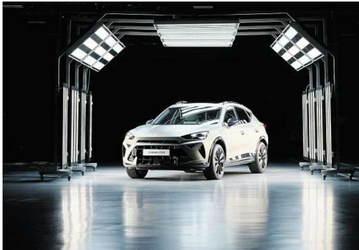
Der Cupra Formentor.

Autohaus am Bungsberg GmbH & Co. KG, Bei der Lohmühle 3, 23554 Lübeck Telefon: 0451/290579-0 Mitsubishi-Experte: Andreas Möhrpahl, E-Mail: moehrpahl@ambungsberg.de