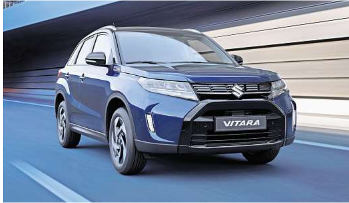
Zuverlässig: der Suzuki Vitara

Der Suzuki Vitara hat den 100.000-Kilometer-Dauertest von Europas größter Automobil-