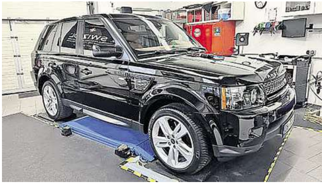
Experten und Anwender sind begeistert: Die neuartige Beschichtung „Matrix V3“ heilt sogar Kratzer.

Eine innovative Entwicklung aus der Welt der Autopflege sorgt derzeit für Furore: Die neuartige keramische Beschichtung „Matrix V3“, die bei Nanotechnik in Pansdorf zum Einsatz kommt, verspricht einen bislang unerreichten Schutz für den Fahrzeuglack. Laut den Herstellern sollen selbst Kratzer aus der Waschanlage kein Problem mehr darstellen, da sie sich wieder mühelos beseitigen lassen. Die „Matrix V3“ ist die neueste Generation keramischer Lackversiegelungen und bietet weit mehr als nur Schutz vor Umwelteinflüssen und Abnutzung. Das Besondere an dieser Beschichtung ist ihre Fähigkeit, den Lack fast unverwundbar gegenüber Kratzern zu machen. Das Geheimnis liegt in der innovativen Nano- beziehungsweise Hightec-PROtechnologie, die die Oberfläche des Fahrzeugs nicht nur härter, sondern auch flexibler macht – anders als bei einer herkömmlichen Ceramic-Versiegelung. Die neue Versiegelung wird in einem mehrstufigen drei-