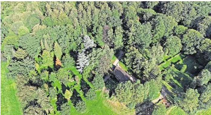
Der Waldfriedhof liegt am Rand von Bad Malente-Gremsmühlen. Das Luftbild zeigt anstelle der Gräberfelder immer mehr Rasenflächen.

Der Friedhof hat Konkurrenz bekommen. Wald- und Seebestattungen hätten das Angebot auf kirchlichen Friedhöfen verändert, teilt Kirchenkreissprecher Marco Heinen mit. Für Kirchen gehöre es jedoch auch ohne Konkurrenz zum Selbstverständnis, sich am Bedarf der Menschen zu orientieren. Auf dem Friedhof