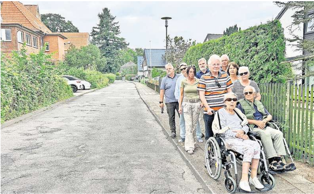
Fällt dieser Fußweg im Barkholtredder weg, wenn das neue Quartier auf dem Ferienheim-Areal (links) gebaut wird? Die Anwohner fordern eine andere Erschließung.

Laut Konzept soll sich der Verkehr auf dem Barkholtredder mit den neuen Wohnungen auf 800 Fahrzeuge am Tag im südlichen Abschnitt (zur Strandstraße hin)