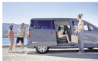
Ein Raumwunder: Nissan Townstar

Ob für Großfamilien oder den Arbeitsalltag – der Nissan Townstar Kombi L2 eignet sich für die vielfältigsten Einsätze und zeichnet sich dabei vor allem durch seine Praktikabilität aus. Die breiten Schiebetüren ermöglichen einen leichten Zugang zur zweiten und