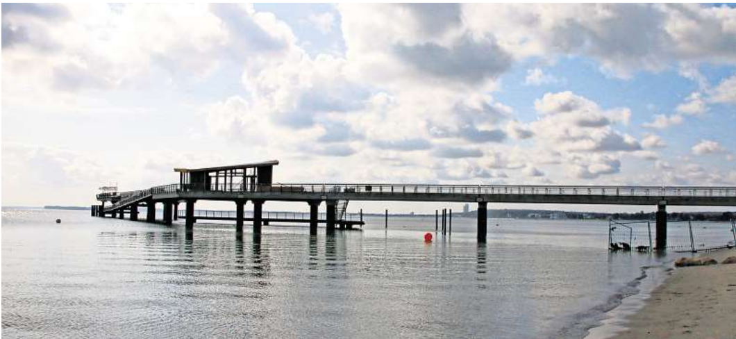
Die neue Seebrücke in Haffkrug ist fast vollendet. Am 28. September soll sie feierlich eingeweiht werden.

Gefeiert wird nicht nur auf der Seebrücke, sondern auch auf dem Vorplatz. Dort beginnt um 11 Uhr der offizielle Teil mit Reden des Kieler Wirtschafts- und Tourismusministers Claus Ruhe Madsen (CDU), des ostholsteinischen