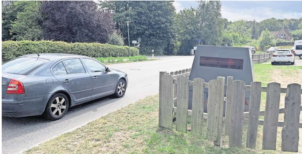
Gut getarnt: Auch in der Waldstraße in Cismar war der Blitzer-Anhänger zuletzt postiert.