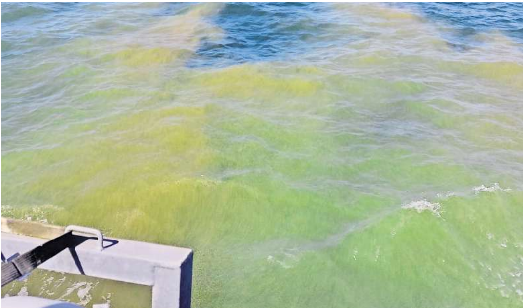
Blaualgen bei Fehmarn: Katrin Schindler hat bei einer Sundbrückenfahrt am 6. August diese Bilder gemacht.

Hohe Wassertemperaturen beschleunigen Wachstum – Erhöhte Gefahr durch Vibriionen – Badewarnungen auf Fehmarn