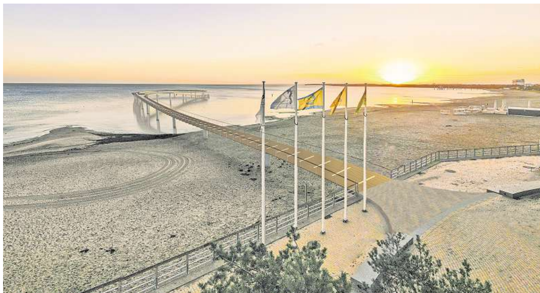
Ein 420-Meter-Rundgang über dem Meer: Die neue Maritim-Seebrücke in Timmendorfer Strand steht kurz vor der Vollendung.

430 Meter lang, als Rundweg angelegt, mit bis zu 20 Metern Spannweite zwischen den einzelnen Brückenpfeilern, die bis zu 22 Meter tief in den Meeresboden gerammt wurden. Das alles