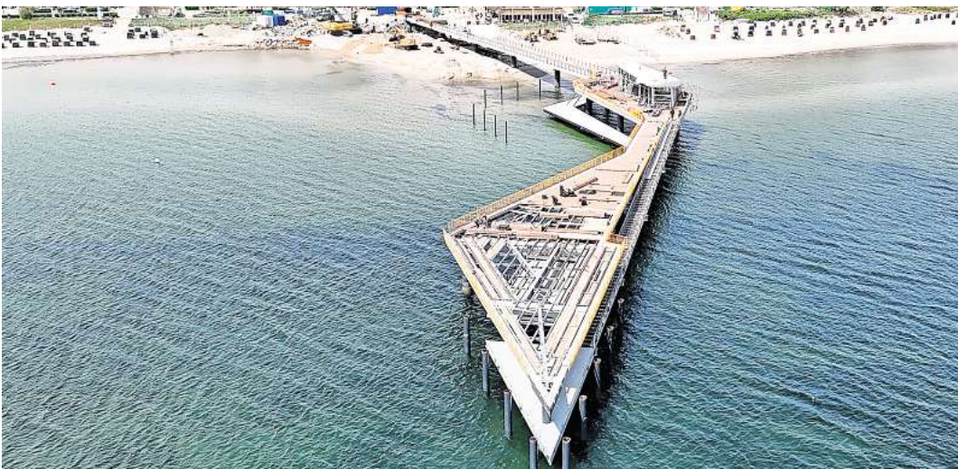
Zickzack-Verlauf mit Doppel-Spitze: Auf der Haffkruger Seebrücken-Baustelle gehen die Arbeiten voran. Die Eröffnung ist jetzt für den 28. September geplant.

HAFFKRUG/TIMMENDORFER STRAND. Auf eine weitere Seebrücken-Eröffnungsparty im September an der Lübecker Bucht können sich Einheimische und Gäste freuen: Die Gemeinde Scharbeutz will die Einweihung der neuen Haffkruger Seebrücke am Sonnabend, 28. September, feiern. „Es läuft“, heißt es zum Fortgang der Arbeiten an dem 19-Millionen-Euro-Projekt. „Die restlichen Geländer werden derzeit auf der oberen Ebene und am Brückenkopf montiert“, berichtete Andreas Geist, Leiter des Fachbereichs Tiefbau bei der Gemeinde Scharbeutz, im Tourismusausschuss. Anschließend sollen die Beleuchtungen der Handläufe und des Brückenkopfes folgen. „Die landseitige Treppeanlage ist fertig“, sagte Geist. Mit der Montage der