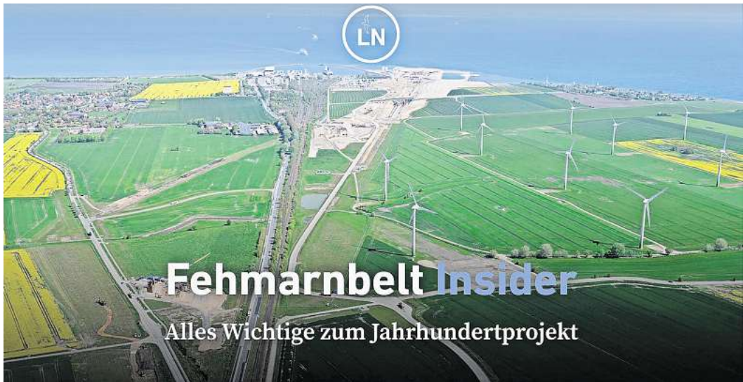
Die Lübecker Nachrichten starten den Fehmarnbelt Insider - den Newsletter zum Jahrhundertprojekt.

Deutschlands Beitrag ist für über 3,9 Milliarden Euro eine 88 Kilometer lange Schienenstrecke samt Fehmarnsundtunnel. Auf