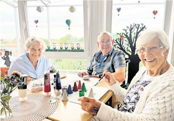
Bewegungsrunden, Gedächtnistraining und gemeinsame Aktivitäten gehören zu den Angeboten der Tagespflege

Senioren mit Pflegebedarf können in der Tagespflege montags bis freitags von 9 bis 15 Uhr anderen Menschen begegnen und einen abwechslungsreichen Tag miteinander verbringen. Der hauseigene Fahrdienst holt die Tagesgäste bei Bedarf zu Hause ab und bringt sie am Nachmittag wieder nach Hause. Ein gemeinsames Frühstück, Mittagessen und gemütliches Kaffeetrinken gehören neben der Mittagsruhe und der täglichen Gymnastikrunde zum Tagesablauf. Weitere Aktivitäten wie Gedächtnistraining, Gesellschaftsspiele, Musik und Gesang oder kreative Bastelarbeiten werden abwechselnd, je nach Wünschen und Bedürfnissen der Gäste, angeboten. Einmal in der Woche wird das Mittagessen von den Ta-