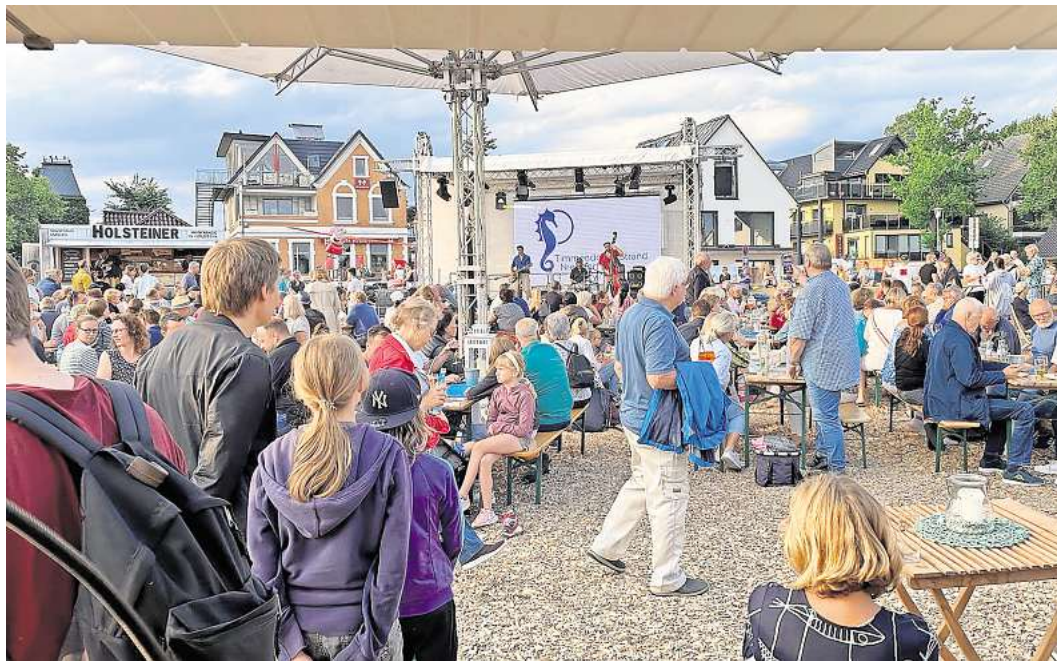
Das Niendorfer Hafenfeeling läuft noch bis Sonntag.

TIMMENDORFER STRAND. Vom 22. August bis 18. September werden Büros im Rathaus (Strandallee 42) saniert. Es kommt zu Einschränkungen: So bleibt das Einwohnermeldeamt am 9. September geschlossen.