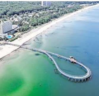
Über den Rundweg, den die neue Timmendorfer Seebrücke bildet, sollen die Besucher ab dem 20. September schlendern können.