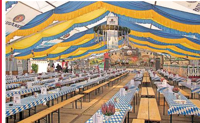
Bis 1000 Feierlustige finden Platz im bajuwarisch geschmückten Festzelt.

tober, wird er von Kay Christiansen, Norddeutschlands bekanntestem DJ Ötzi-Double, unterstützt. Am Sonnabend, 5. Oktober, treten ihm die Gebrüder Doof zur Seite. Das Bier kommt – wie immer – direkt aus München, die Preise für ein Maß sind jedoch deutlich moderater als auf den Wiesn. Bajuwarisch ist auch die Speisekarte. Ob Weißwurst, Speißbraten, Nackensteak, Krakauer oder Curry-