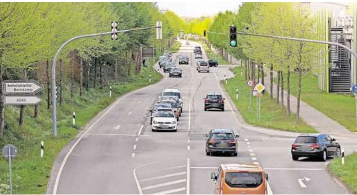
Die B 207 zwischen Kronsfordter Allee und Hochschulstadtteil soll im Sommer saniert werden.

Geplant ist, weiträumige Umleitungen auszuschildern. Für den ersten Bauabschnitt (Berliner Allee) wird der Verkehr von der Kreuzung Kronsfordter Allee über den St.-Jürgen Ring bis zur Ratzeburger Allee geführt. Von dort führt die Umleitung weiter über Ratzeburger Landstraße bis zur Blankenseer Straße. Von dort geht es wieder auf die B 207. Für die Gegenrichtung ist die gleiche Route vorgesehen.