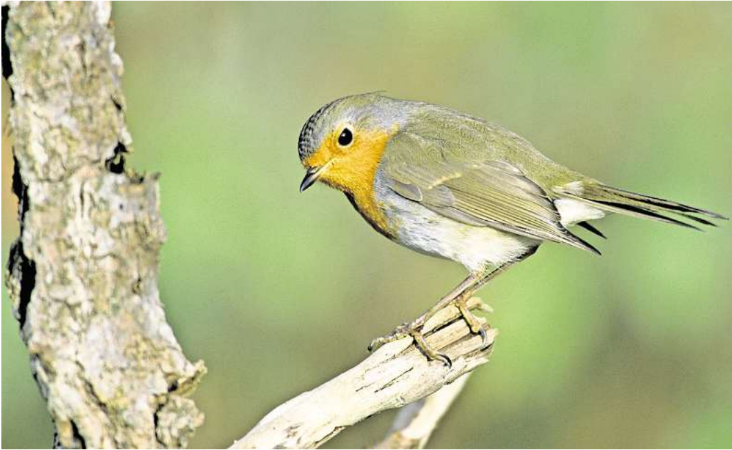
Ein gern gesehener Gast im Garten: das Rotkehlchen.

Jeder kann helfen, Daten zu sammeln, indem er oder sie Vögel zählt, und so den Vogelschutz unterstützen. Miller: „Wer mitmacht, beteiligt sich an einem der größten Citizen-Science-Projekten Deutschlands. Außerdem macht es Spaß, Vögel kennenzulernen und zu zählen. Zudem ist es auch noch gesund.“ Verschiedene Studien haben gezeigt, dass die Beschäftigung mit der Natur und auch Vögel beobachten sich positiv auf die psychische Gesundheit auswirken. „Viele überwinternde Arten haben in diesem Frühjahr zeitig