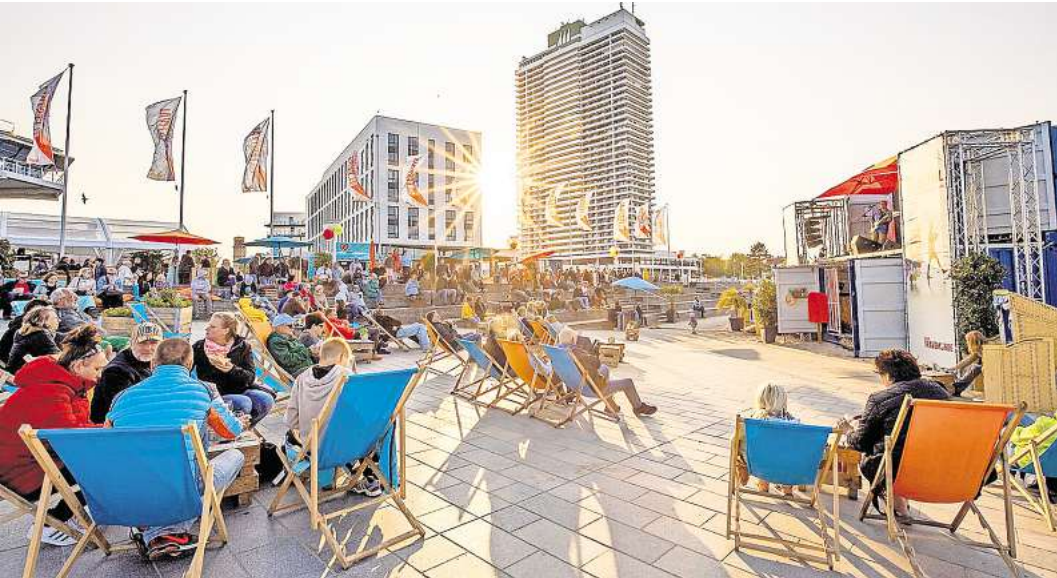
In Travemünde wird sechs Tage lang das Seebadkulturfestival gefeiert.