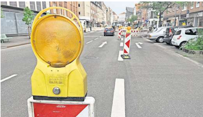
Eine von vielen Baustellen in Lübeck: In der Beckergrube ist bereits jetzt die Straße aufgerissen.

Weberkoppel: Ab dem vierten Quartal 2024 bis zum dritten Quartal 2027 arbeiten Stadtverwaltung und EBL in der Weberkoppel in St. Jürgen. Dort wird der Mischwasserkanal in eine Schmutz- und eine Regenwas-