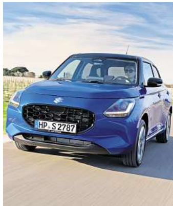
Der Suzuki Swift ist in drei Ausstattungen im Autohaus am Bungsberg in Eutin erhältlich.

bekannten Ausstattungslinien Club, Comfort und Comfort+. Kunden können sich bei den höheren Ausführungen optional für einen Allradantrieb oder ein CVT-Automatikgetriebe entscheiden. Im Vergleich zur Vorgängergeneration hat Suzuki die Serienausstattung des Kompaktwagens deutlich aufgewertet.