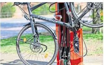
Diebstahlgesichert: Die Werkzeuge sind mit Drahtseilen an den Stationen befestigt.