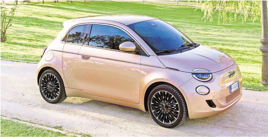
Die kleinen Fiat-Modelle sind weltweit sehr beliebt und im Autohaus am Bungsberg erhältlich.

Seit der Präsentation des Fiat 500 Elektro* ist die BEV-Familie innerhalb der Marke Fiat ge-