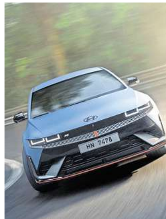
Der Hyundai Ioniq 5 N bietet Fahrspaß auch im Alltag.

Autos Hyundai Autohaus am Bungsberg GmbH & Co. KG Oldenburg, Ringstr. 20 Eutin, Lübecker Landstr. 53 Schwentinental, Gutenbergstr. 16 Stockelsdorf, Autohaus am Funkturm, Otto-Hahn-Str. 5 www.ambungsberg.de