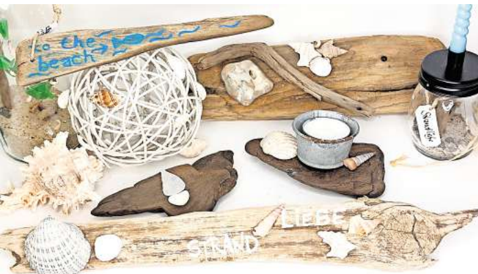
Roswita Hornig zeigt Kunst aus Treibholz.

Iris Traß präsentiert wundervolle Kreativobjekte. Ihre kreativen Glückwunsch- und Grußkarten beinhalten Schub- und Steckfächer für eine nette Überraschung. Zudem präsentiert sie