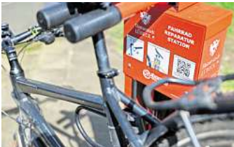
Das Rad kann an den Griff gehängt werden und für Reparaturanleitungen gibt es einen QR-Code.

erfolgreicher Ausschreibung hat die BQL Berufsausbildungs- und Qualifizierungsagentur Lübeck GmbH den Zuschlag erhalten. Alle Stationen werden regelmäßig kontrolliert, ob alle Werkzeuge vollständig vorhanden sind“, teilt die Stadt mit. Sollte bei der Nutzung einer Station Mängel auffallen, können diese per Online-Formular unter https://bql.gmbh/fahrrad-servicestationengemel-