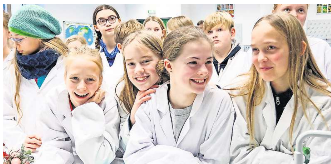
Das Experimentieren beginnt an der Weber-Schule bereits bei den Jüngsten.