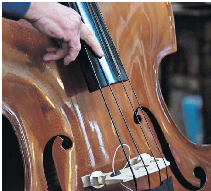
In der Waldkirche wird ein Workshop zu Jazz und Spiritualität angeboten.

Mit der Auszeichnung hat das Weber-Gymnasium neben dem Titel als Europaschule und dem Berufs- und Studienwahlsiegel ein drittes besonderes Profil, das vom Bildungsministerium wegen der ausgezeichneten Qualität und Arbeit ausgezeichnet werden konnte.