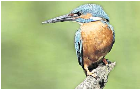
So groß sieht man den Eisvogel wohl selten in der Natur.

in Malente, Marktstraße 13. Eine gute Gelegenheit, unsere heimischen Vögel im Wasser und in der Luft, bei spektakulären Flug- und Jagdszenen aus der Nähe zu beobachten. Der Eintritt ist frei.