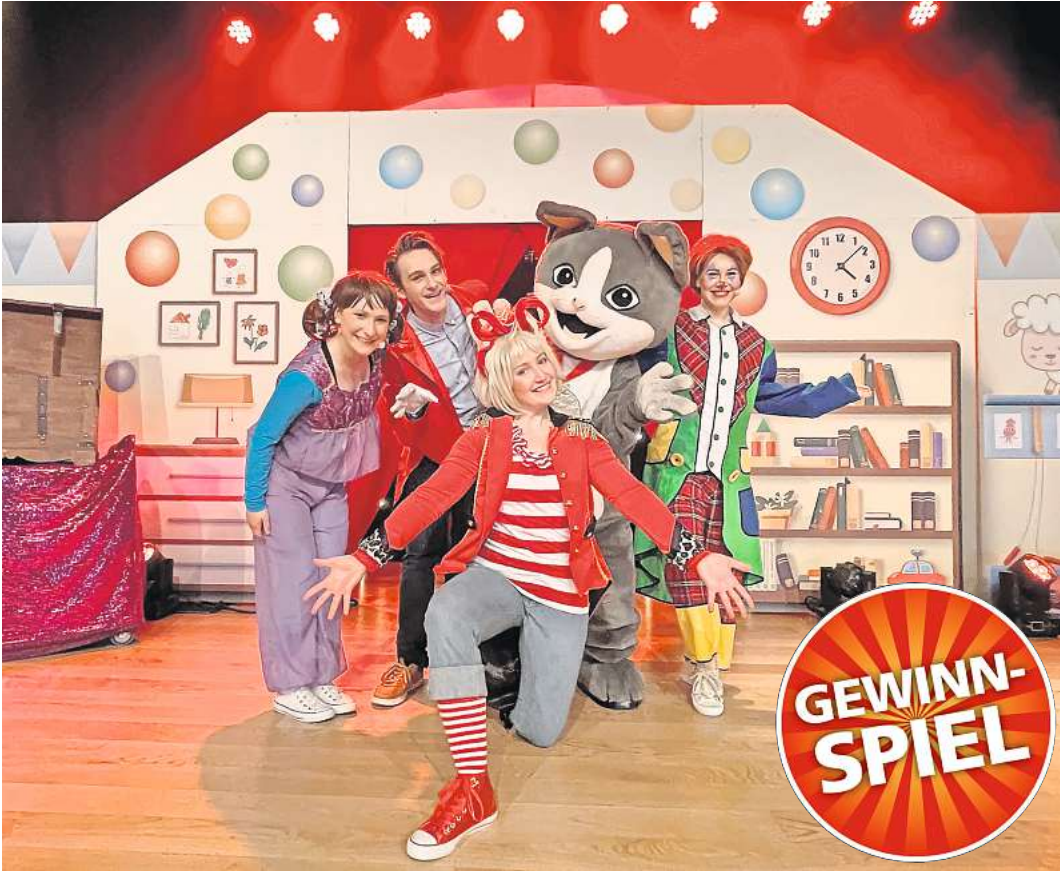
„Conni – Das Zirkus-Musical“ macht im Januar in Lübeck Station.