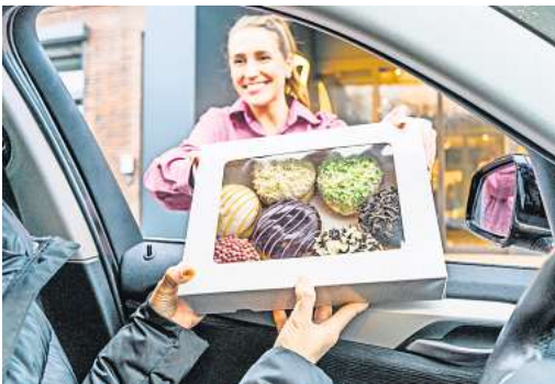
Kein Anstehen, kein Aussteigen: Der Berliner-Drive-in an der Lübecker Hafenstraße 25 macht es möglich.

Bei der Abholung heißt es dann nur noch Seitenscheibe herunterlassen, Abholnummer nennen und die vorbestellten Berliner entgegennehmen. Alles wird bequem an und in das Fahrzeug gereicht. Wichtig: Den Berliner-Drive-in können nur Online-Besteller nutzen. Bestellungen sind unter shop.jb.de möglich.