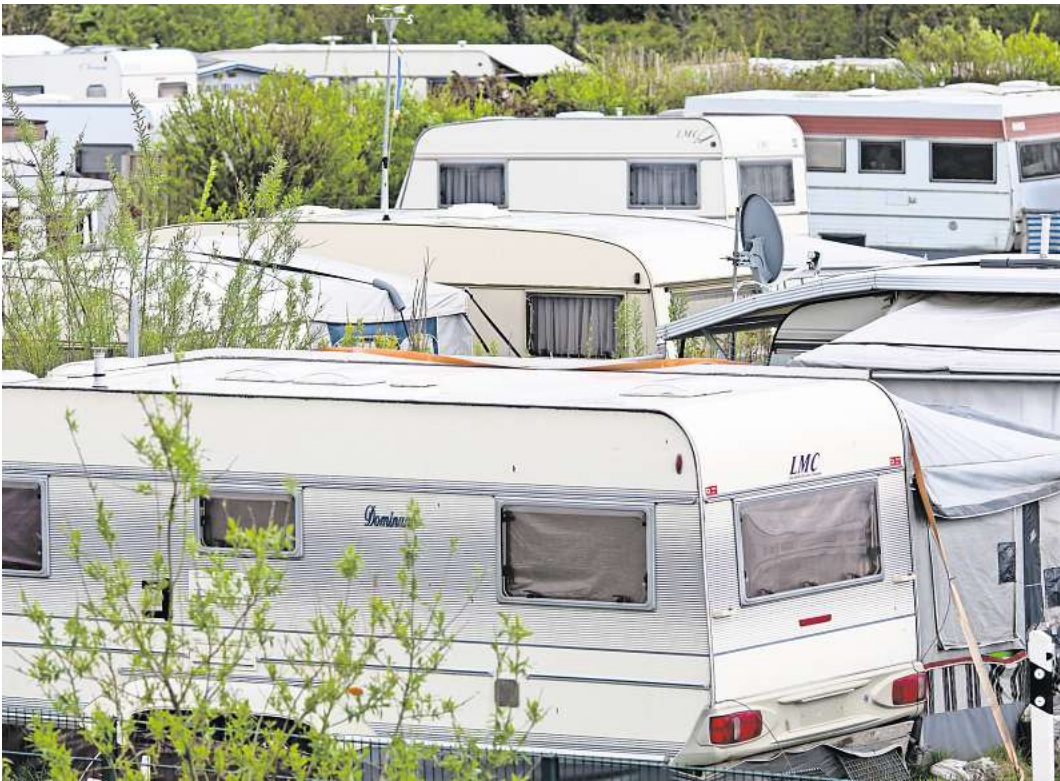
Wohnwagen stehen auf einem Campingplatz in Schleswig-Holstein.

Dazu hat André Rosinski, Vorstand der Tourismus-Agentur Lübecker Bucht, eine klare Meinung: „Die Lübecker Bucht und generell die Ostseeküste Schleswig-Holsteins ist und bleibt eine sehr beliebte Campingregion, die viele Camper anzieht. Temporär übersteigt die Nachfrage das Angebot.“ Der Tourismus sei durch die Steuer nicht gefährdet.