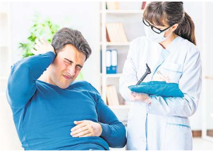
Silvesterböller stellen eine ernstzunehmende Gefahrenquelle für einen Hörverlust dar. Insbesondere in der Altersgruppe der sechs bis 25-Jährigen ist die Anzahl der Betroffenen alarmierend.

Feuerwerke, insbesondere zum kommenden Jahreswechsel, sind zwar hübsch anzusehen. Dennoch verkennen viele Schaulustige die Gefahr, die durch die mit dem Feuerwerk einhergehende Lautstärke für die Ohren droht. Je geringer der Abstand zum Feuerwerk ist, desto höher ist der messbare Schallpegel: Bei einem Abstand von zwei Metern werden bereits bis zu 160 Dezibel erreicht. Dieser Wert entspricht dem Schallpegel einer abgefeuerten Pistole. Professionelle Feuerwerke übersteigen diese Werte sogar mit Schallpegeln über 190 Dezibel abhängig von der ange-