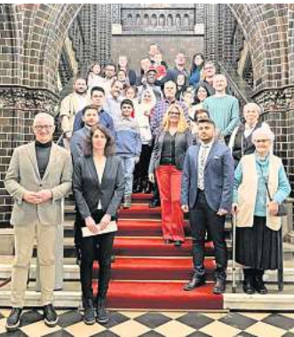
Die Einbürgerungsfeier fand im Rathaus statt.

Bevor er den Neu-Lübeckern ihre Einbürgerungsurkunden überreichte, betonte Senator Hinsen: „Jeder und jede von Ihnen hat seine persönlichen Gründe, Deutscher oder Deutsche werden zu wollen. Aber jeder und jede Einzelne von Ihnen ist ein Gewinn für unser Land und ein Gewinn für die Vielfalt in unserer Stadt: Engagieren Sie sich, sei es politisch, sozial, sportlich, sei es ehren- oder hauptamtlich. Denn unsere Stadt lebt vom Engagement. Ich wünsche Ihnen, dass Sie Ihre Entscheidung, Deutsche geworden zu sein, immer mit Freude empfinden.“