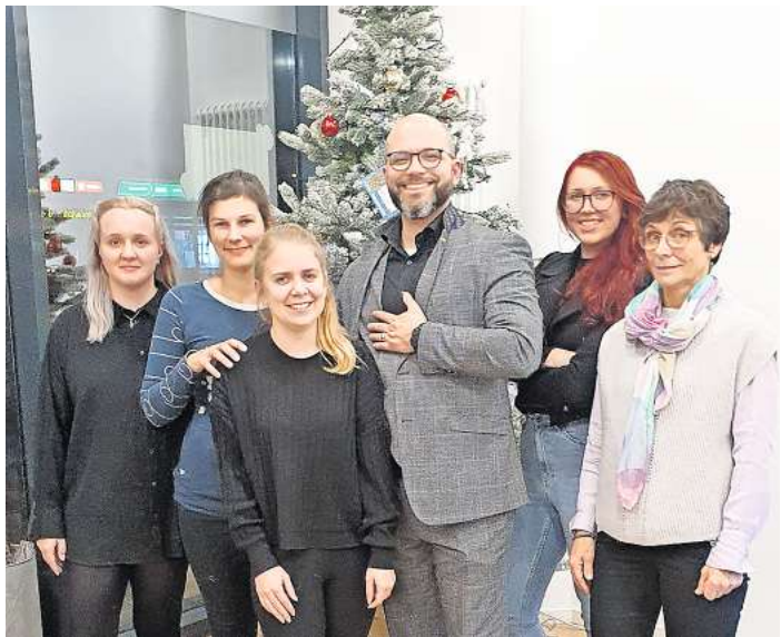
Das Team von Hörgeräte Hermanns veranstaltet wieder die traditionelle Wunschbaumaktion.

Am geschmückten Weihnachtsbaum in den Geschäftsräumen des Familienunternehmens Hörgeräte Hermanns in der Schlutuper Straße 2 in Lübeck finden sich die Wünsche vieler Kinder, die im Kindergarten des Deutschen Kinderschutzbundes in Lübeck betreut werden. Wer eines dieser Kinder mit einer Kleinigkeit beschenken will, pflückt sich einen Wunschzettel vom Baum und besorgt das Geschenk. Anschließend