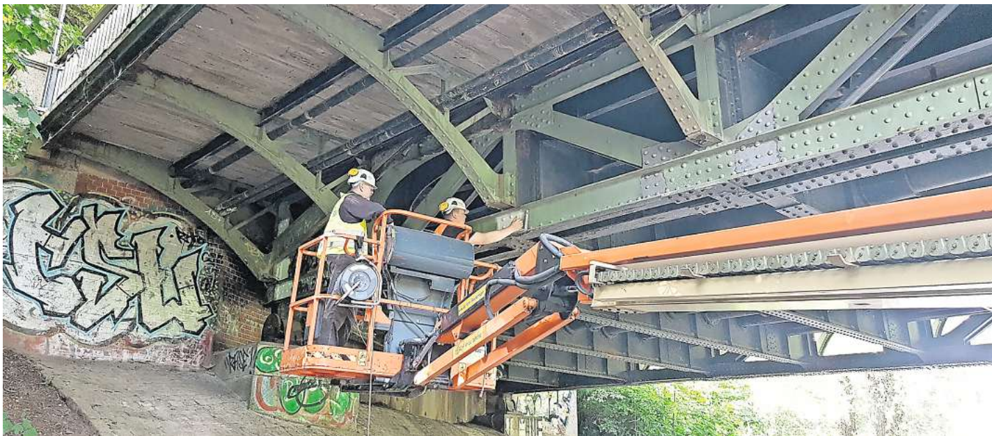
Die Mühlentorbrücke wurde in den vergangenen Jahren mehrfach intensiv auf Schäden untersucht.

Für die Instandsetzung der Brücke wird die Fahrbahnplatte vollständig abgebaut, die Kragarme werden ersetzt, die Widerlager abgebrochen und neu gebaut. Die Brücke wird für die Bauarbeiten, die im Herbst 2024 starten sollen, vollständig gesperrt.