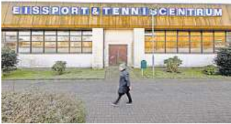
Das Investorenmodell für das ETC diskutiert die Politik unter Ausschluss der Öffentlichkeit.

„Das halbe Dorf“ spreche doch darüber, dass die Supermarktkette Rewe Interesse daran habe, in einen Neubau des Eissport- und Tenniscentrums (ETC) zu investieren, sagt ein erfahrener Timmendorfer. Das mag sein. Doch weder dieses halbe noch die andere Hälfte des Dorfes konnte sich bislang über Details