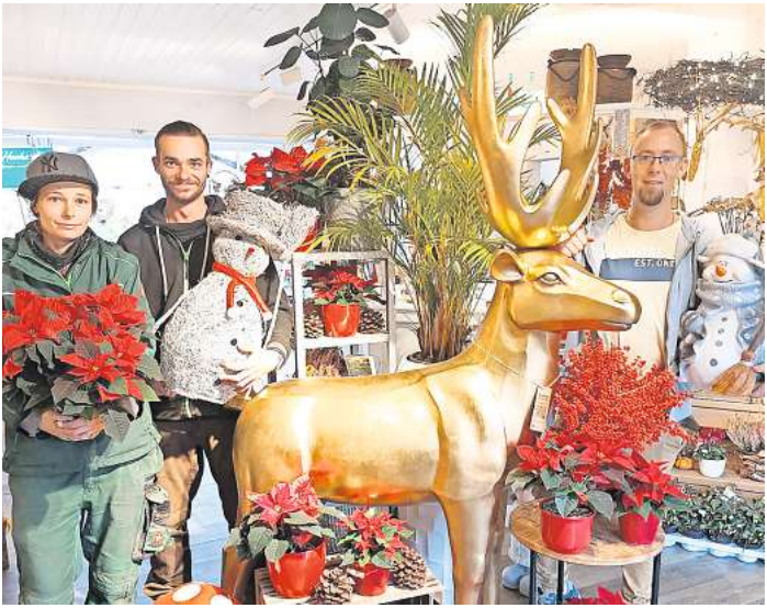
Alle Mitarbeiter vom Alten Hof freuen sich auf viele interessierte Besucher.

solventen und Absolventinnen nicht nur in angemessener Zeit, sondern auch mit praxisnahen und aktuellen Inhalten auf ihren beruflichen Erfolg vor.“ Spitzenplatzierungen beim CHE-Ranking konnte auch die Lübecker Uni in den vergangenen Jahren regelmäßig vorweisen, insbesondere in der Medizin und Psychologie. Das neue Master ranking des Centrums für Hochschulentwicklung (CHE) ist ab sofort online unter https://www.heystudium.de/master-ranking kostenlos einzusehen. Mehr als 10000 Master-Studiengänge stehen in Deutschland mittlerweile zur Wahl. MHO