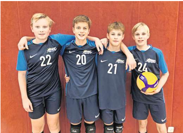
Das Jungen-Team des OGT war beim Bundesfinale Volleyball in Thüringen am Start.

Gespielt wurde am ersten Tag in der Vorrunde in vier gelosten Gruppen mit vier Teams aus ganz Deutschland, darunter Sportinternate und Sportschulen mit Schwerpunkt Volleyball. Die Mädchen kamen gut ins Turnier und konnten gleich den ersten Satz gegen die Gerda-Taro-Schule aus Leipzig für sich entscheiden, das Spiel endete aufgrund des besonderen Spielmodus unentschieden. Es folgte eine Niederlage gegen die Schule an der Ronzellenstraße aus Bremen und ein weiteres Unentschieden gegen die Jungmannschule aus Eckernförde, die als zweitplatziertes Team aus Schleswig-Holstein einen Nachrückerplatz er-