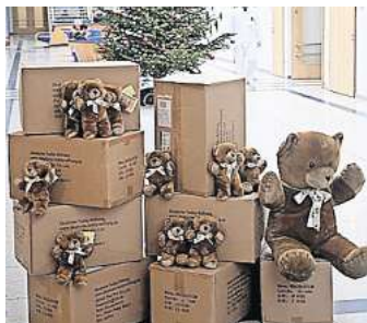
Die Trost-Teddys in der Ameos-Klinik in Eutin.

EUTIN/MALENTE. Der Lions-Club Eutin sammelt an zwei Sonnabenden, 2. und 9. Dezember, jeweils von 10 bis 13 Uhr im Famila-Markt in Eutin und im Malenter Rewe-Markt Spenden für die Trost-Teddys. Die Teddys werden kostenlos an Polizei, Rettungsdienste und die Ameos-Klinik Eutin weitergeleitet, damit sie Kindern in Notfallsituationen geschenkt werden können. „Ohne die Aufgeschlossenheit