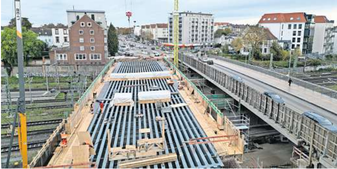
Der Neubau der Bahn­hofs­brücke liegt sogar etwas vor dem Zeitplan.

Die Betonierarbeiten sind für die Woche vom 11. bis zum 15. Dezember vorgesehen. In dieser Zeit muss die Brücke voll gesperrt werden – allerdings nur nachts, damit der Verkehr möglichst wenig beeinträchtigt wird. Die eigentliche Betonage erfolgt laut Stadt voraussichtlich in der Nacht vom 13. auf den 14. Dezember. Je nach Witterung kann sich der Termin um wenige Tage verschieben.