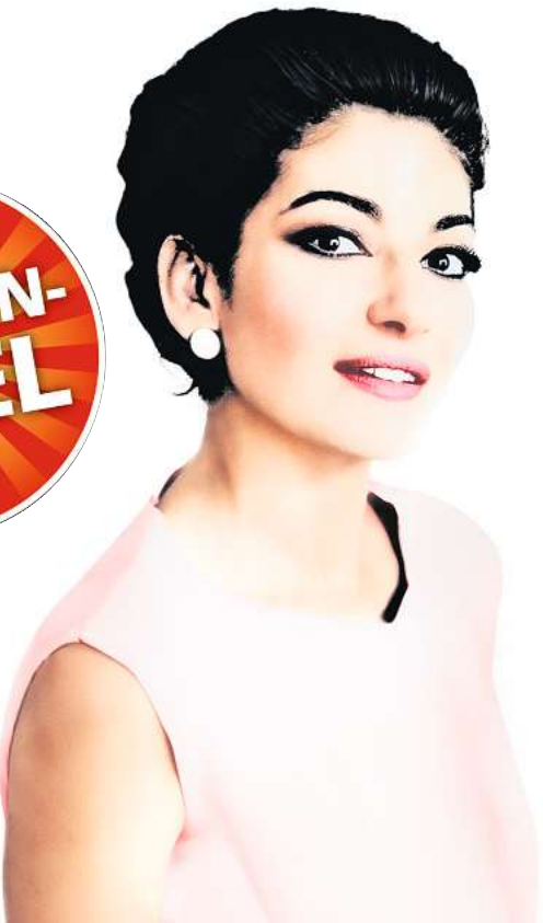
Unvergessen: Opernsängerin Maria Callas.