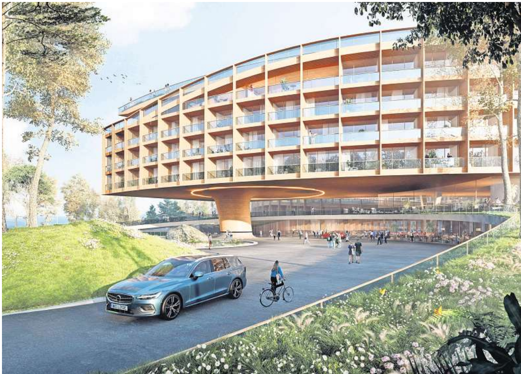
So stellen sich die Planer den Vorplatz und Foyer mit der Zufahrt zur Tiefgarage für das Lakeside Resort vor. Visualisierung Hadi Teherani Architects

führung ist auch in dem spektakulären Entwurf für das Lakeside Resort erkennbar. Das zentrale Element ist ein spiralförmiger Gebäudekomplex. Diese Erlebnisarchitektur habe sich aus der umgebenden Natur entwickelt und verschmelze harmonisch mit der Landschaft, erklärt Teherani.