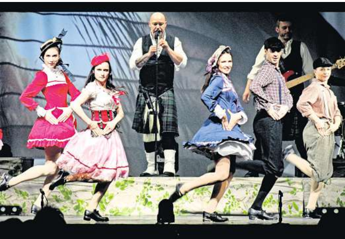
Rückkehr in die Heimat“ ist der Titel der neuen Show von Cornamusa.

LÜBECK. In der diesjährigen Cornamusa-Show „Rückkehr in die Heimat“ knüpfen die Tänzer nahtlos an die Geschichte der letzten Aufführung „Reise in die neue Welt“ an. Die Zuschauer erleben am 1. März 2024 ab 20 Uhr in der Lübecker MuK eine mitreißende Show voller Leidenschaft, Tradition und unvergesslicher Momente, begleitet von einer siebenköpfigen Liveband. Es geht um die bewegende Geschichte von Aileen, ein stolzes schottisches Mädchen, und Cat-hel, ein tapferer Ire, deren Familien im 19. Jahrhundert nach Amerika auswanderten. Beide verspüren nun den brennenden Wunsch, ihre keltischen Wurzeln in Schottland und Irland zu erkunden. Gemeinsam unternehmen sie eine abenteuerliche Reise nach Irland, bekämpfen eine ge- fährliche Bande von Seefahrern und werden mit den Spaltungen in Nordirland konfrontiert. Gespannt können die Zuschauer verfolgen, wie sie Seite an Seite in Irland kämpfen, um ihre Kultur zu bewahren und trotz aller Hindernisse und politischer Konflikte entschlossen bleiben, Frieden und Einheit anzustreben. Ihre inspirierende Geschichte steht für die unaufhaltsame Kraft der Liebe, des Mutes und der Hoffnung auf eine bessere Zukunft. Wieder mit dabei: Gyula Glas-er, ein dreifacher Europameister und renommierter Solotänzer und Choreograf, und Nicole Oh-nesorge, eine talentierte und hochdekorierte Solotänzerin und Choreografin. 🎟 Tickets gibt es ab 42 Euro unter anderem bei eventim.de