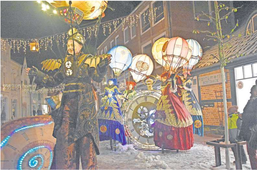
Lichterstadt Eutin 2022 – so schön soll es auch in diesem Jahr wieder werden.