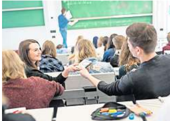
Die TH-Studierenden haben neben allgemeiner Studiensituation den Übergang in den Master und das Lehrangebot bewertet.