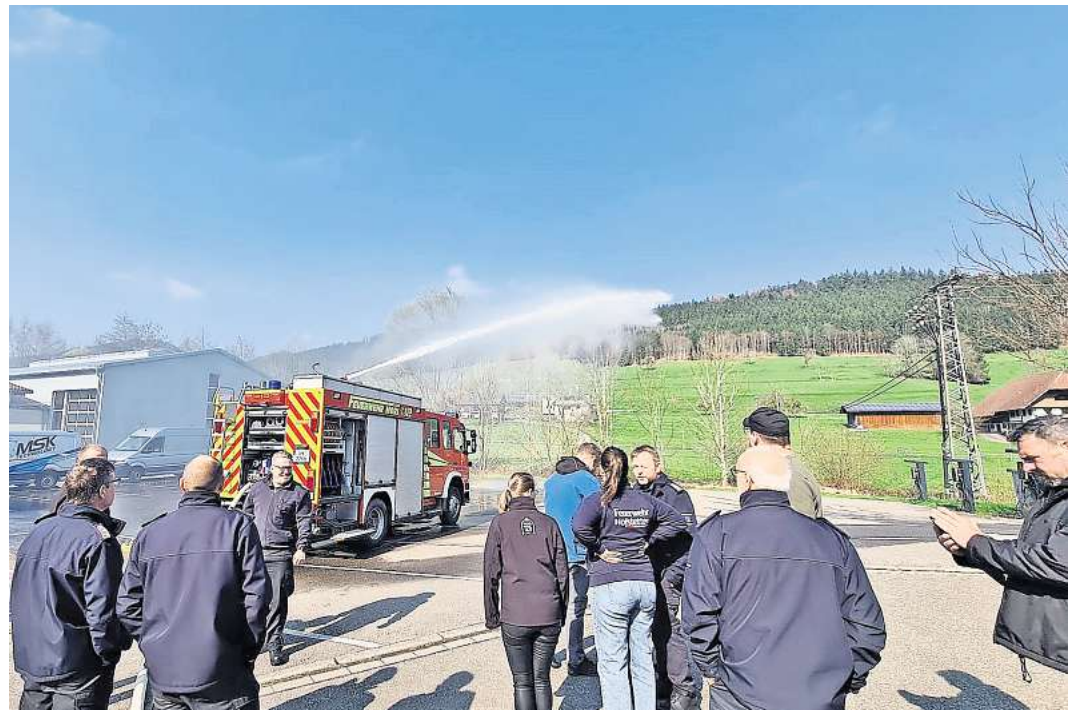
Das neue Fahrzeug wurde gleich ausgiebig von den Kameradinnen und Kameraden begutachtet und getestet.