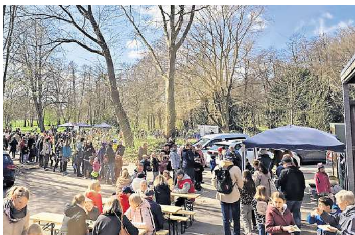
Der Andrang bei der Ostereiersuche im Herrengartenpark war groß.

Auch kulinarisch war das Fest bestens aufgestellt: Dank vieler engagierter Kuchenbäckerinnen und -bäcker konnten sich die Gäste über ein vielfältiges und köstliches Angebot freuen.