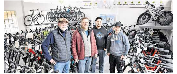
Das Team des „Fahr-Rad-Ladens“ berät kompetent rund ums Zweirad.

Wer jetzt auf den Geschmack gekommen ist, sollte sich im Fachhandel beraten lassen und das passende E-Bike oder Gravelbike inklusive Bike-Fitting auswählen. Im nächsten Schritt helfen Reisebüros und regionale Tourismusanbieter dabei, passende Touren zu finden und Mehrtagestouren unkompliziert zu buchen. cs