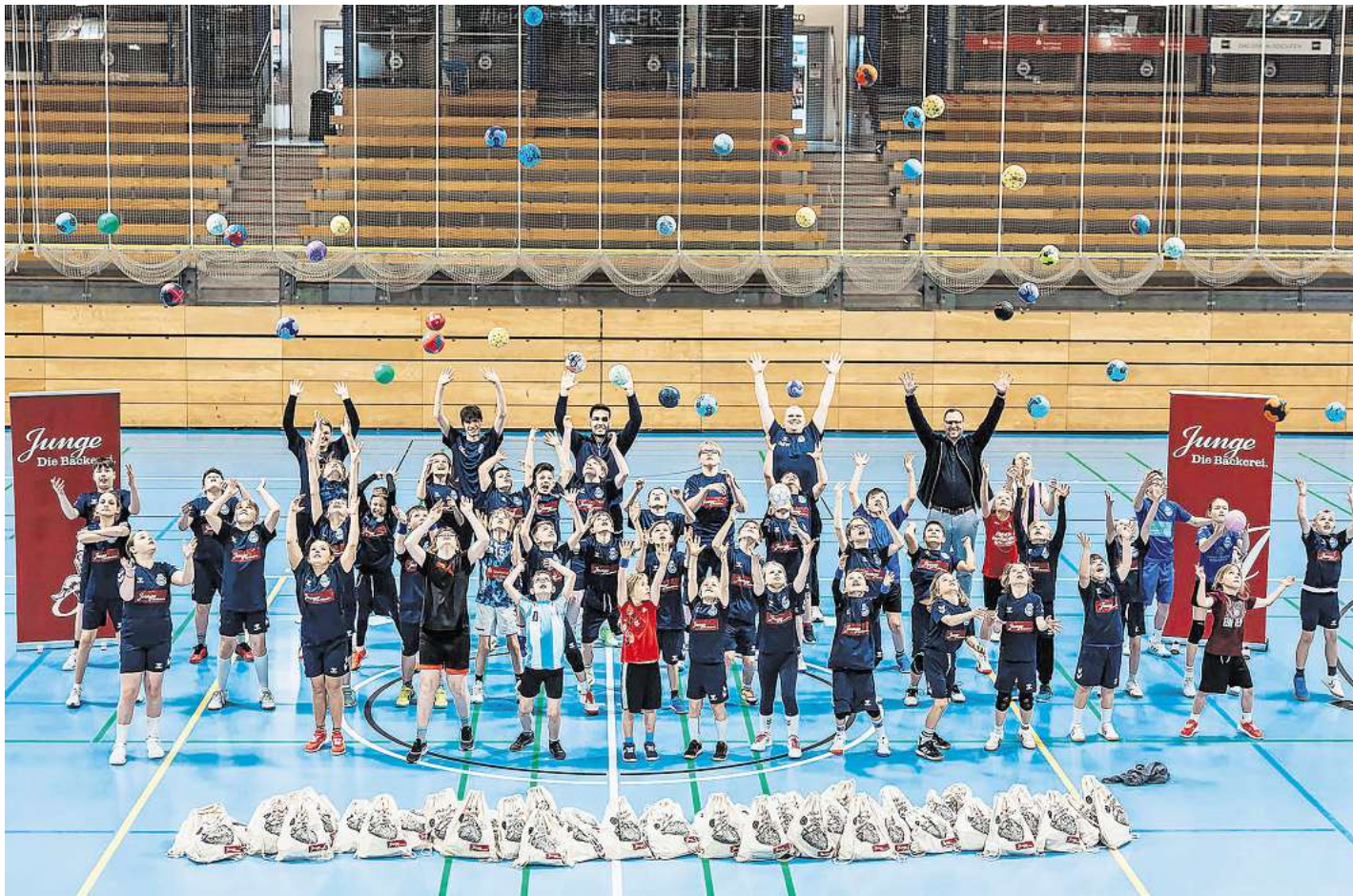
Das VfL-Handballcamp wird von der Bäckerei Junge unterstützt.

Zustellung: 0451/31 700 186 Anzeigen: 0451/31 700 180