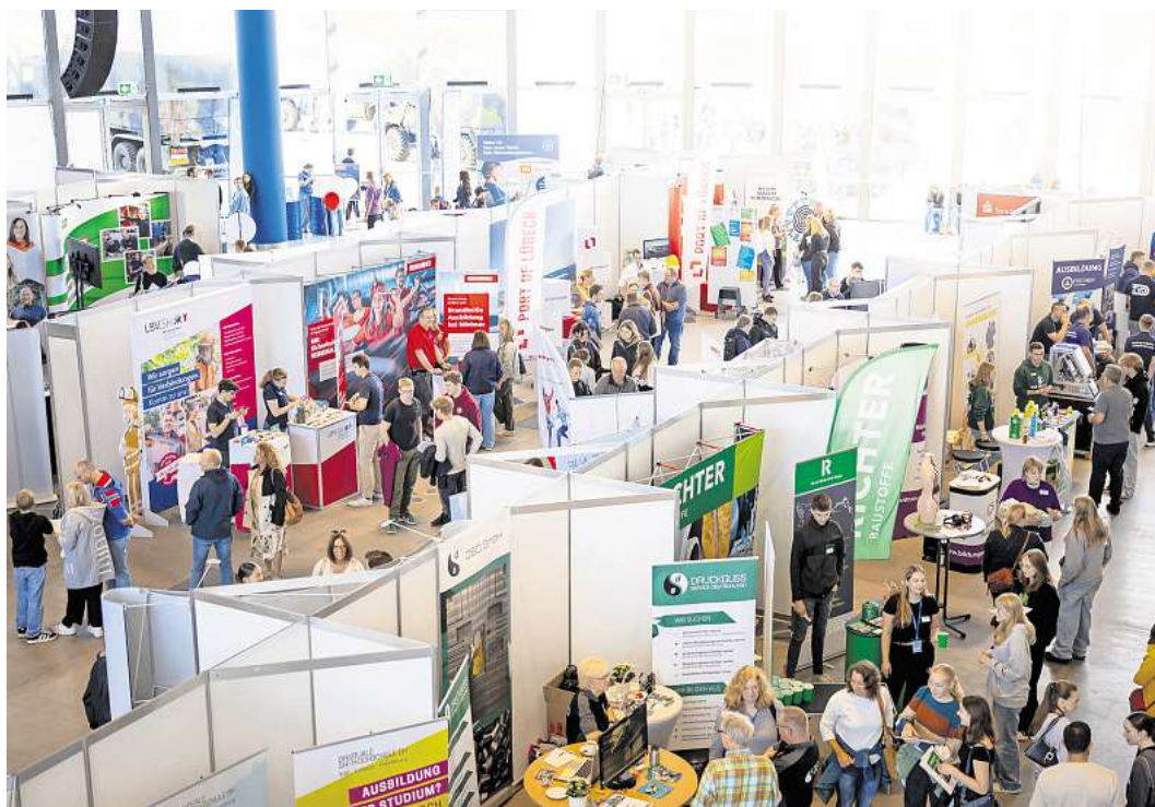
Volles Haus: Die gefragte LN-Azubiemeile im vergangenen Jahr in der Rotunde der Muk.

Insgesamt werden nach Auskunft des Veranstalters 102 Aussteller – darunter 71 Betriebe, 18 Hochschulen sowie Fachschulen und Institutionen – Rede und Antwort stehen. Zum weiteren Messeangebot gehören Vorträge zu Themen rund um Ausbildung und Studium. In der Muk gibt es zudem Informationen über das Freiwillige Soziale Jahr