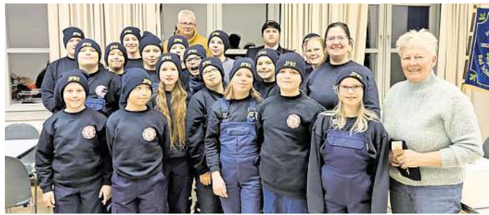
Die Jugendwehr mit ihren Mützen.