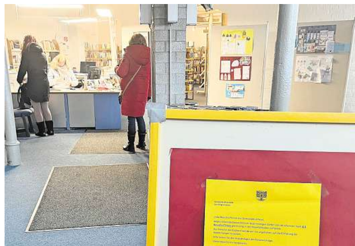
Ein gelber Zettel auf einem Aufsteller sowie ein Schreiben an der Eingangstür weisen auf die Besucherbeschränkung in der Bücherei in Ahrensböck hin. Die Gemeinde beruft sich dabei auf eine brandschutzrechtliche Bestimmung.