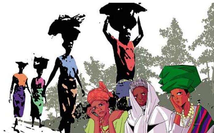
Das Bild zum Weltgebetstag 2026: „Rest for the Weary“ stammt von der Künstlerin Gift Amarachi Ottah.

Auch in den Evangelischen Kirchengemeinden in Ostholstein wird der Weltgebetstag ge-