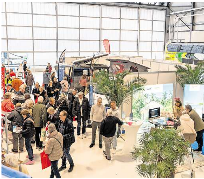
Die LN-Reisesmesse NordZEIT findet am Wochenende am Lübecker Flughafen statt.

Mit Bus oder Bahn können Besucherinnen und Besucher auch am