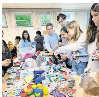
Schülerinnen und Schüler der Cesar Klein Schule bastelten für Kinder im Frauenhaus Lübeck. hfr

RATEKAU. Am 7.11. 2025 veranstaltete die Gruppe der „Helfenden Hände“ an der CKS in Ratekau eine besondere Aktion zugunsten des Lübecker Frauenhaus. Aus gespendeten Materialien bastelten über 20 Schülerinnen und Schüler aus verschiedenen Klassen liebevoll gestaltete Adventskalender, gefüllt mit Süßigkeiten und kleinen Geschenken, um den 25 Kindern, die zur Zeit im Frauenhaus leben, eine angenehme Vorweihnachtszeit zu ermöglichen und Freude zu