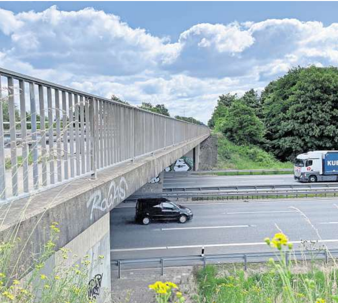
Die Bundesstraße 432 verläuft in Höhe Scharbeutz auch über die Autobahn 1. Die Brücke soll im Zuge des Baus der Schienenanbindung durch einen Neubau ersetzt werden.

Und zu Pansdorf sagt er, dass die Anschlussstelle sowie die Landesstraße 102 unterquert werden sollen. „Damit ausreichend Abstand zwischen der Schiene inklusive der Oberlei-