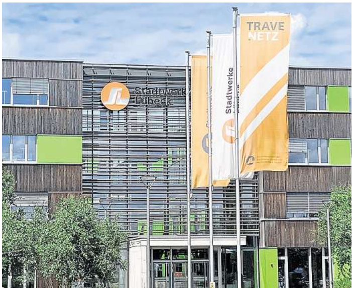
In der Geniner Straße 80 in Lübeck ist die Stadtwerke Lübeck Gruppe ansässig – zu der gehört auch die Travenetz GmbH.

Eine andere genervte Travenetz-Kundin schreibt an die LN. „Ich habe mich sehr über den Bericht gefreut. Ich selber kämpfe seit Jahren mit Travenetz“, schildert sie. „Nach dem Einbau eines Digitalzählers bekomme ich immer noch Ablesekarten mit der alten Zählernummer – sollte ich nach diesem jahrelangen Nervenkrieg etwas nachzahlen müssen, gehe ich zu einem Anwalt.“ SEP