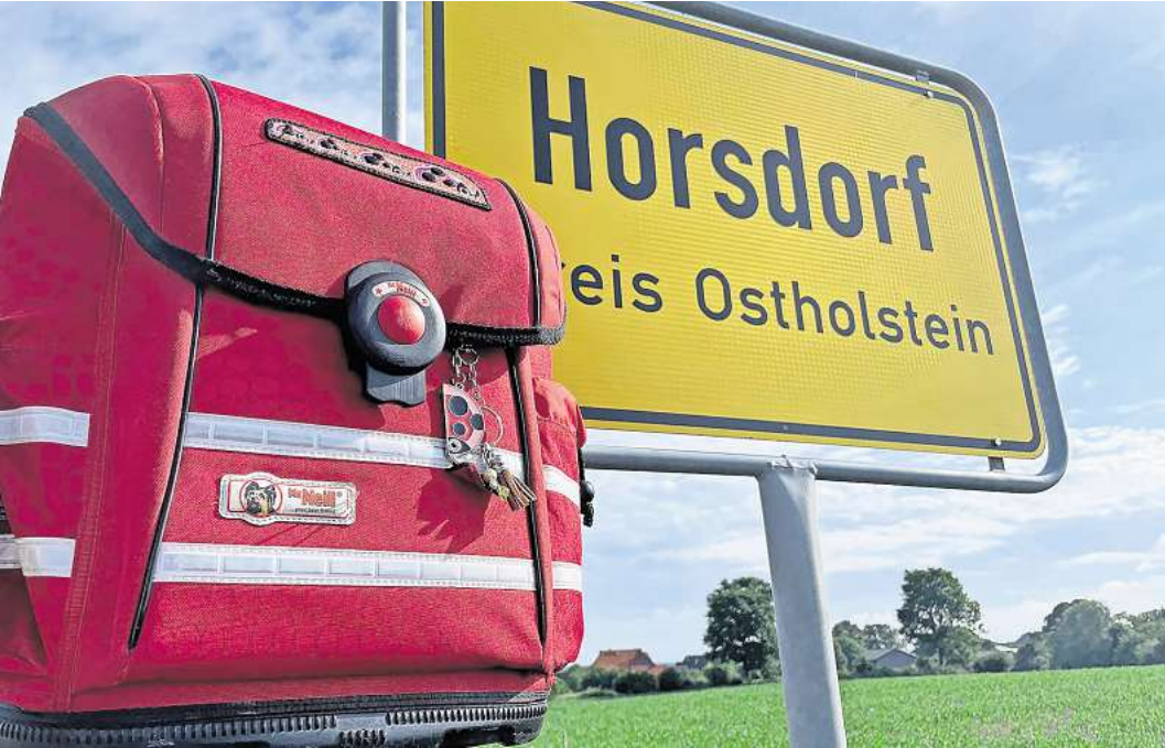
Kinder aus den Stockelsdorfer Dorfschaften Malkendorf und Horsdorf werden weiterhin in der Grundschule Bad Schwartau beschult. Eine entsprechende Vereinbarung soll nun geschlossen werden.