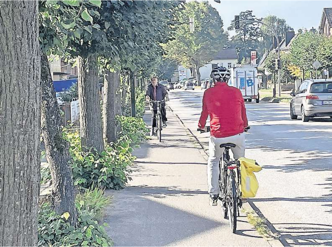
Viel zu schmal und in beide Richtungen befahrbar: Der Radweg entlang der Straße Tremskamp ist gefährlich.

Zudem empfahl der Experte, die Benutzungspflicht des Radwegs im Bereich Tremskamp in