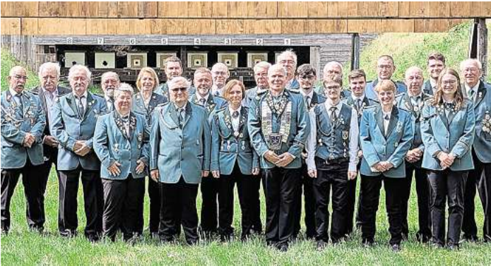
Große Resonanz: Zum Königsschuss Ende Mai sind 28 Frauen und Männer des Schützenvereins Stockelsdorf angetreten.