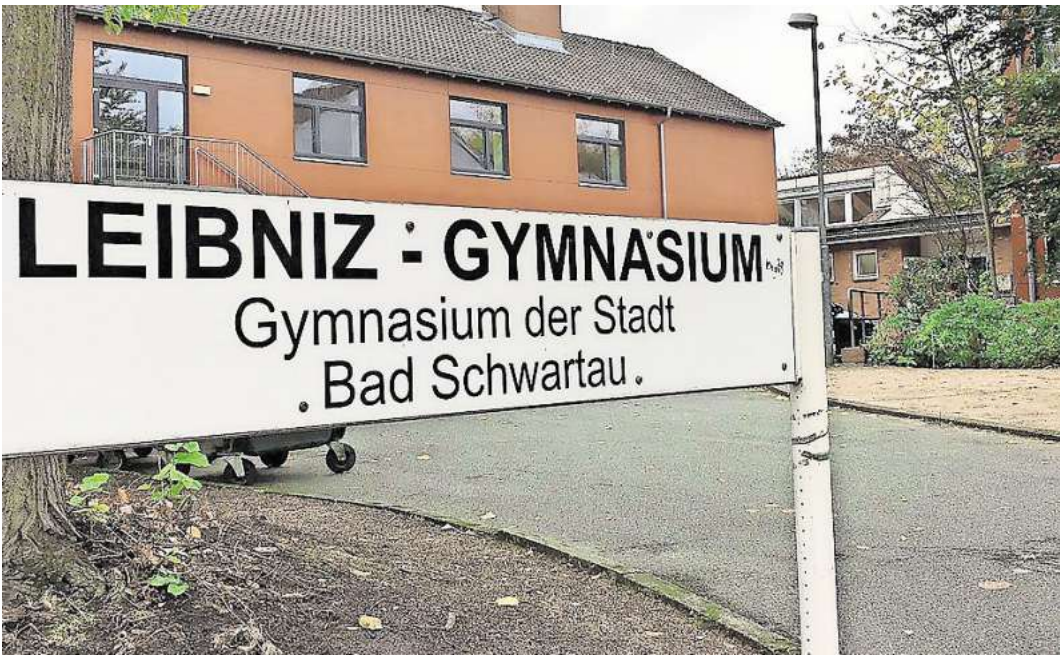
Das Leibniz-Gymnasium in Bad Schwartau nimmt im nächsten Schuljahr 116 Schülerinnen und Schüler auf.

Beate Hinse führt weiter aus, dass die Nachfrage nach Schulplätzen an Gemeinschaftsschulen mit Oberstufe erneut größer gewesen sei als das Angebot. An 25 der insgesamt 44 Gemein-