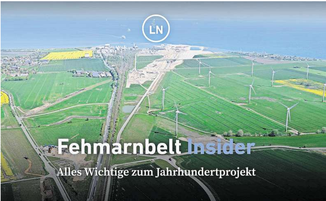
Den Newsletter Fehmarnbelt Insider gibt es immer am zweiten Donnerstag im Monat.

LÜBECK/ OSTHOLSTEIN. Der Bau der Fehmarnbeltquerung gehört zu den größten und wichtigsten Infrastrukturprojekten Europas. Dänemark baut zwischen Lolland und Fehmarn für Straße und Schiene den längsten Absenktunnel der Welt. Deutschland muss passend dazu zwischen Lübeck und Fehmarn eine leistungsfähige Schienenanbindung errichten. Die Lübecker Nachrichten begleiten beide Groß-Projekte seit Jahren intensiv. Das wird auch so bleiben. Zusätzlich gibt es unseren Newsletter Fehmarnbelt Insider. Die Fehmarnbeltquerung ist ein Projekt der Superlative. In rasantem Tempo arbeiten unsere dänischen Nachbarn seit 2021 am 7,5 Milliarden Euro teuren Absenktunnel. Noch in diesem Jahr wird das erste Tunnelstück in die Ostsee abgesenkt. Die Tunnelzufahrten in Puttgarden und Rødby werden immer sichtbar. Die Produktion der riesigen, 73.000 Tonnen schweren Tunnелеlemente läuft an der dänischen Küste in der größten Betonfabrik der Welt auf Hochtouren. Deutschlands Beitrag ist für über 3,9 Milliarden Euro eine 88 Kilometer lange Schienenstrecke samt Fehmarnsundtunnel. Auf