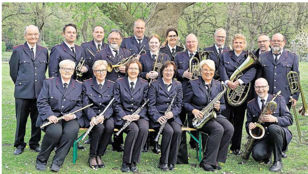
Die Brassband der Feuerwehren Bad Schwartau spielt am Sonntag ab 13 Uhr in der Bad Schwartauer Musikmuschel. Foto: Brassband der Feuerwehren Bad Schwartau.