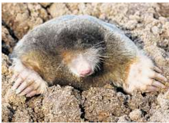
Sein Lebensraum geht zurück: Eine Mitmachaktion soll zeigen, wie groß der Bestand der Maulwürfe ist.

OSTHOLSTEIN. Er wiegt nicht viel mehr als eine Tafel Schokolade, ist aber bärenstark und lebt im Untergrund. Der Klimawandel mit zunehmender Trockenheit, aber auch Regenfluten, machen es dem kleinen Kerl schwer. Tier- und Naturschützer schauen deshalb besorgt auf einen immer ungünstigeren Lebensraum für den streng geschützten europäischen Maulwurf. Sein Bestand geht zurück. In welchem Maße, darüber soll auch eine bundesweite Mitmach-Aktion Aufschluss geben. Um einen besseren Überblick über zu gewinnen, haben Akteure wie Nabu, Deutsche Wildtier Stiftung sowie das Leibniz-Institut für Zoo- und Wildtierforschung 2023 ein Mitmachprojekt gestartet. Die Bevölkerung soll ab 16. Mai melden, wenn Igel, Maulwürfe oder deren Hügel gesichtet werden. Diesmal läuft die Aktion bis 26. Mai.