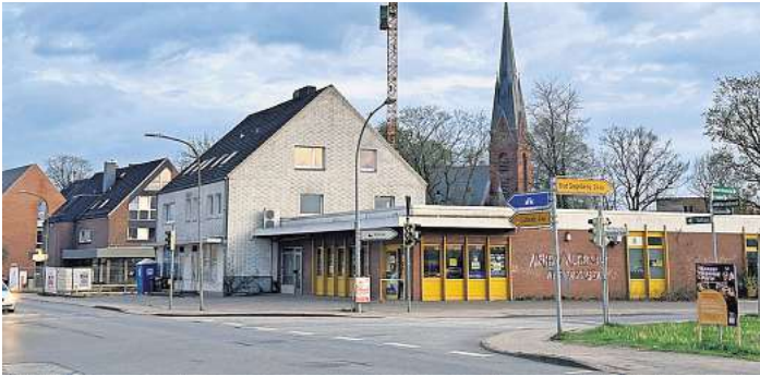
So sieht es aktuell an der Ecke Ahrensböcker Straße/Marienburgstraße aus.