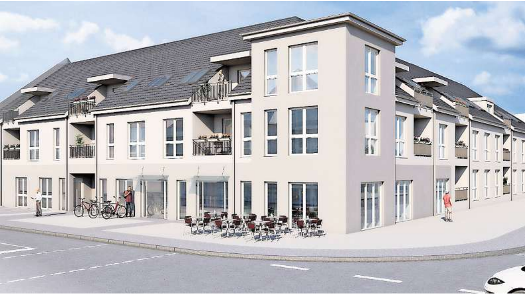
So soll der Neubau anstelle der alten Post aussehen. Was in die Gewerbeeinheiten kommt, ist derzeit noch unklar. Visualisierung: Nordiska

„Auf der Fläche der ehemaligen Post entstehen zwei bis drei Gewerbeflächen und 27 Wohnungen sowie eine Tiefgarage“, sagt Swars. Die Wohnungen werden auf dem freien Markt verkauft. Es sei aber denkbar, dass sie von Investoren gekauft würden, die den Wohnraum dann vermieten. Das würde in Stockelsdorf sicher viele freuen. Denn wie fast überall fehlt es auch in der Großgemeinde an