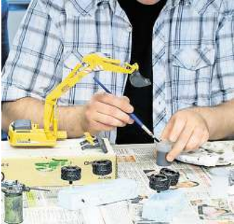
Die Besucher können den Modellbauern auch bei ihrem Hobby zuschauen.

PMCL feiert zugleich das 25-jährige Bestehen seiner Freundschaft mit den Modellbaufreunden aus Ried in Österreich – eine gelebte internationale Verbundenheit im Zeichen des gemeinsamen Hobbys.