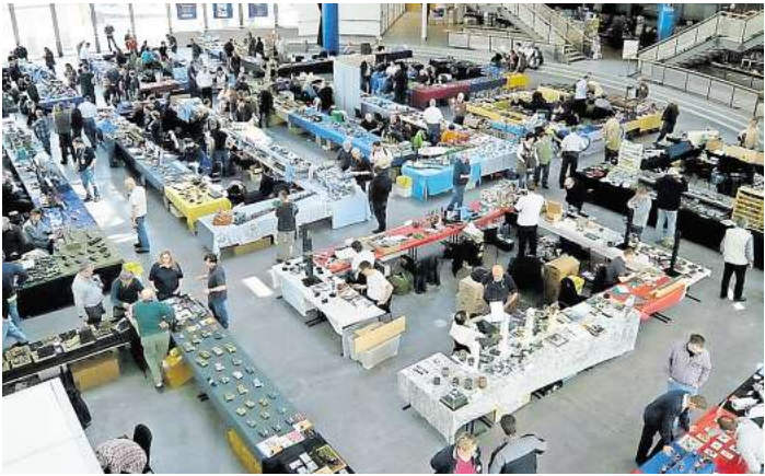
Die Ausstellung des PMCL findet in der MuK statt