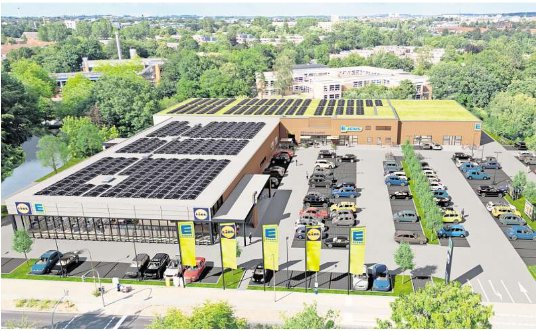
Zwei große Einkaufsmöglichkeiten an einem Platz: Neben dem Edeka-Markt soll in Buntekuh auch ein Lidl-Discountcenter eröffnen. Bei beiden Neubauten sind Photovoltaik-Anlagen auf dem Dach vorgesehen.

Neben den beiden großen Märkten sollen auf 800 Quadratmetern weitere kleinere Geschäfte einziehen können. Dafür