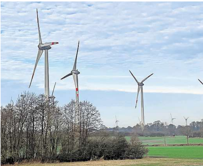
Zwischen Obernwohde, Arfrade und Krumbeck möchte die Gemeinde Stockelsdorf weitere Windkraftanlagen errichten.