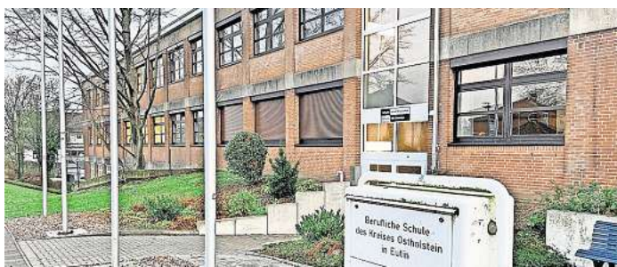
Der Infoabend findet am 30. Januar in der Beruflichen Schule in Eutin statt.

Neben den fachrichtungsbezogenen Fächern erhalten die Schüler Unterricht in den Fächern Deutsch, Englisch, Mathematik, Gemeinschaftskunde, Französisch oder Spanisch, berufliche Informa-