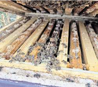
Der Blick ins Innere des Bienenstocks: Dort ist es rund 30 Grad warm.

An Licht mangelt es der Sonneninsel Fehmarn zwar nicht, doch auch