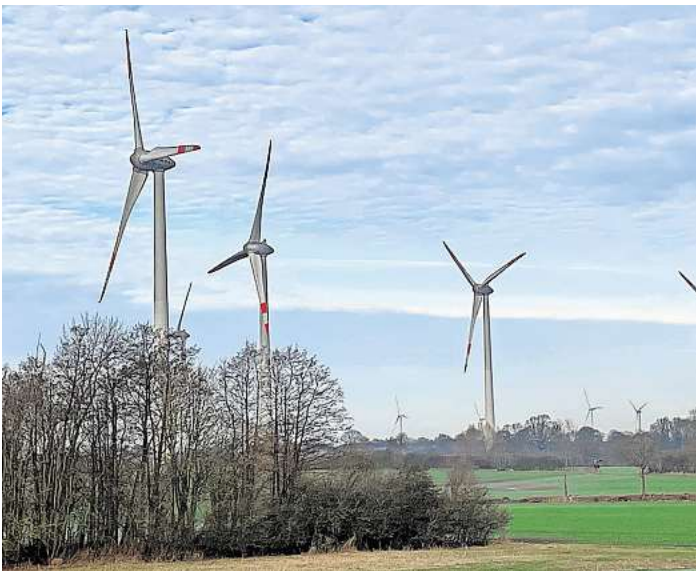
Zwischen Obernwohld, Arfrade und Krumbeck möchte die Gemeinde Stockelsdorf weitere Windkraftanlagen errichten.