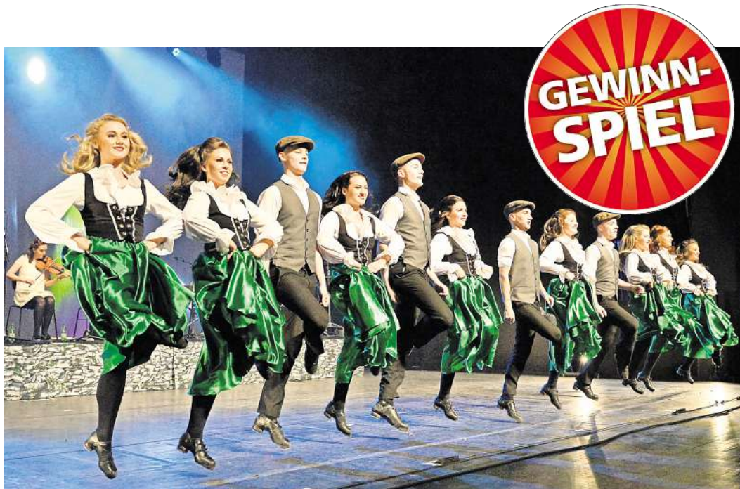
„Hooked“ heißt das neue Programm der „Danceperados of Ireland“.