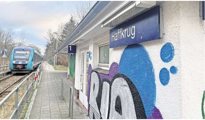
Der Haltepunkt in Haffkrug wird von Nah.SH mit der Note 4, also ausreichend, bewertet. Mit dieser Bewertung liegt die Station auf dem letzten Platz der 183 kontrollierten Bahnhöfe in Schleswig-Holstein.

Besonders viele Mängel hat dabei Haffkrug aufzuweisen. Unter ande-