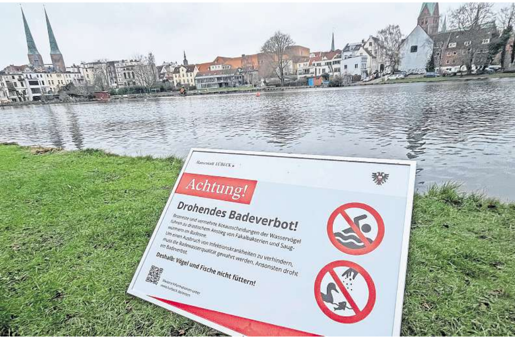
Füttern verboten: Die Stadt hat am Krähenteich neue Schilder aufgestellt.