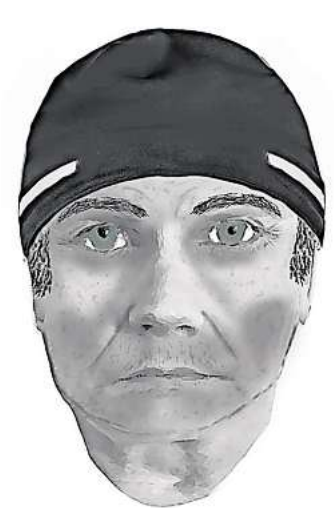
Mit diesem Phantombild fahndet die Polizei nach dem etwa 50-jährigen Tatverdächtigen.

Die Frau habe sich jedoch vehement mit Tritten gegen ihren Angreifer gewehrt. Dadurch habe