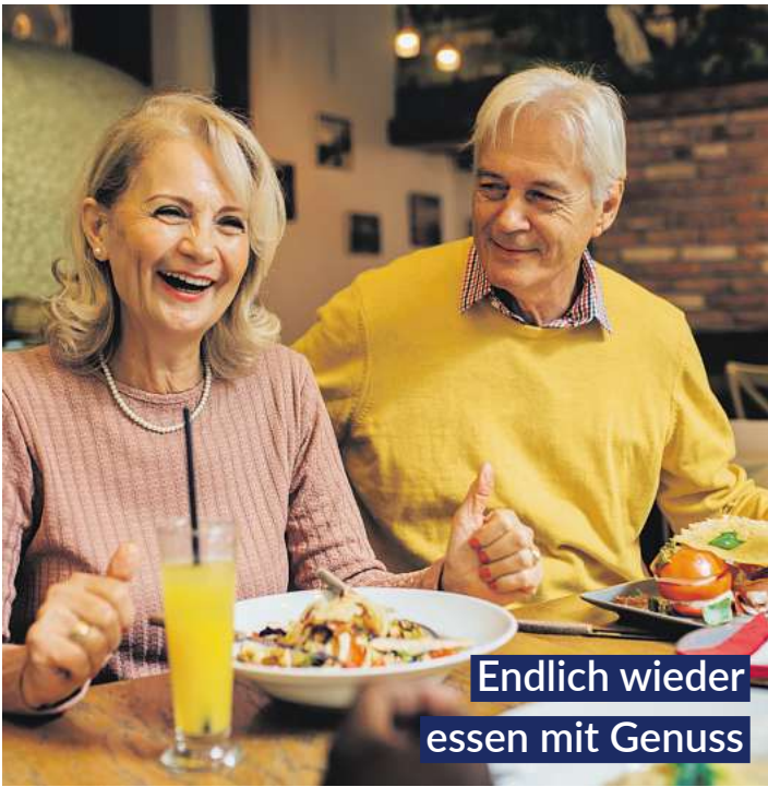
Endlich wieder essen mit Genuss

Bei Blähungen, Völlegefühl und Magenkrämpfen bringen GASTEO Magen-Tropfen mit sechs