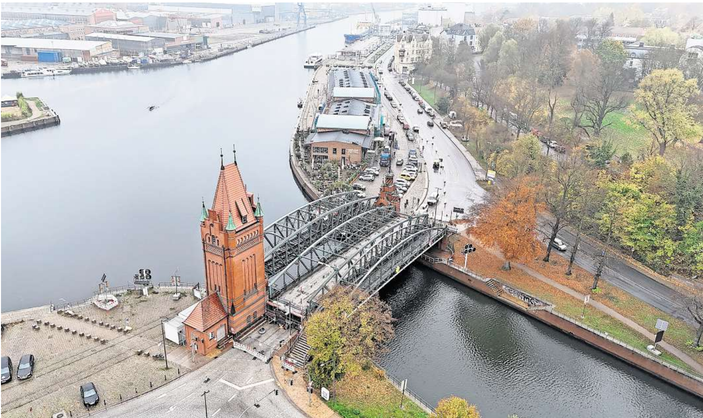
Die Hubbrücke von oben: Auf dieser Aufnahme ist die Fußgängerbrücke noch an Ort und Stelle.

Die Brücke wurde im Zuge des Baus des Elbe-Lübeck-Kanals errichtet und im Jahr 1900 von Kaiser Wilhelm II. eingeweiht. Das Bauwerk erregte wegen seiner herausragenden Technik international Aufmerksamkeit, berichtete Dirk Rieger, Chef des Bereichs Archäologie und Denkmalpflege bei der Stadt, jetzt im Kulturausschuss. Auf der Pariser Weltausstellung sei sie sogar als Vorbild für weitere Anlagen thematisiert worden. 1988 wurde die Brücke unter Denkmalschutz gestellt. Sie besteht aus drei Teilen – einem für Fußgänger, einem für Autos und einem für Züge.