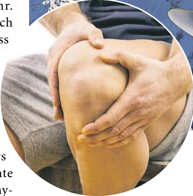
Müde und beanspruchte Muskeln? Viele vertrauen dabei auf Rubaxx Cannabis CBD Gel.

Substanz mit einem geringen Risiko ein. 1 Zahlreiche Studien deuten bereits darauf