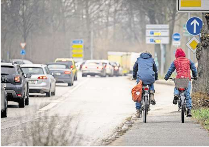
5000 Radfahrer sind pro Tag an der Ratzeburger Allee unterwegs. Laut einer Prognose sollen es 10.000 werden.

Etwa ein Jahr lang werden die Arbeiten auf dem ersten Abschnitt voraussichtlich dauern. „Wir sind