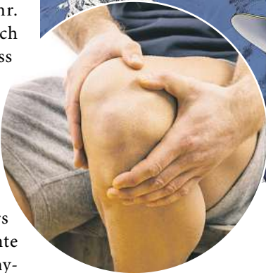
Müde und beanspruchte Muskeln? Viele vertrauen dabei auf Rubaxx Cannabis CBD Gel.

Substanz mit einem geringen Risiko ein. 1 Zahlreiche Studien deuten bereits darauf