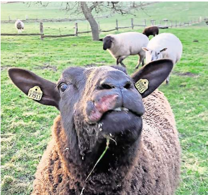
„Ruby“ ist eines der beiden attackierten Schafe. Die Verletzung an ihrer Lippe ist deutlich zu erkennen. Apfelschnitze schmecken ihr aber schon wieder.

Dem zweiten verstörten Schaf, „Ruby“, fehlt nach Bosslets An-gaben die halbe Lippe. „Sie war blutüberströmt im Gesicht. Im Unterkiefer ist ein Loch. Man sieht, wo der Reißzahn war“, sagt sie. Das Paar rief Jens Mat-zen, Schleswig-Holsteins Koordi-nator der Wolfsbetreuer und Rissgutachter an, der ihnen um-gehend einen Gutachter schick-te. „Er hat Proben an den Wun-den der Schafe genommen. Wenn ausreichend Speichel dran