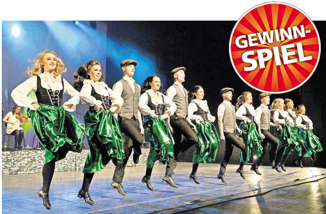
„Hooked“ heißt das neue Programm der „Danceperados of Ireland“.