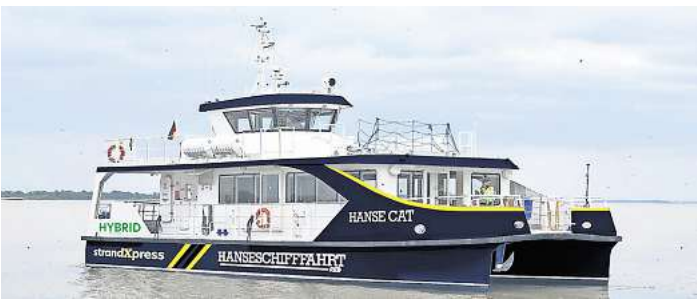
Der Hybrid-Katamaran „Hanse Cat“ ist auf der Ostsee mit bis zu 20 Knoten unterwegs.

SCHARBEUTZ. Die Bäderschiffahrt auf der Ostsee hat eine lange Tradition. Seit mehr als 100 Jahren bringen Schiffe die Ausflügler und Urlaubsgäste von Lübeck aus zu den Seebädern in der Lübecker Bucht oder verbinden die Bäderorte miteinander. Ausdruck dieser langen Tradition sind die Seebrücken, an denen die Bäderschiffe anlegen. Ab Ostern kommt zu den traditionsreichen Bäderschiffen ein neues hinzu: Die „Hanse Cat“, ein Hybrid-Katamaran der Reederei Hanseschiffahrt RB, verkehrt dann zwischen 10 und 18 Uhr im Zweistunden-Takt mehrmals täglich zwischen Lübeck-Travemünde und Scharbeutz. Die „Hanse Cat“ ist bis zu 20 Knoten (37 Kilometer pro Stunde) schnell. Damit schafft sie nach Angaben der Reederei die schnellste Verbin-