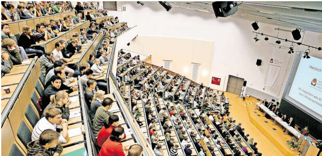
Ein Blick ins Audimax: Informatik- und Mathematik-Studierende sind mit der Situation an Uni und TH sehr zufrieden.

„Mathematik in Medizin und Lebenswissenschaften“ bewerten ihre Hochschule in sehr vielen Aspekten sehr gut. Hier liegen sogar fünf Indikatoren und 23 Detailbewertungen oberhalb des