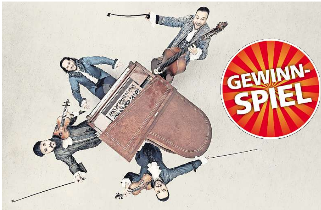
Das Janoska Ensemble improvisiert gern.

EUTIN. Der Kreis Ostholstein verleiht jedes Jahr die Ehrennadel an bis zu vier Bürger für ihr besonderes Engagement im ehrenamtlichen Bereich. Hierfür können bis zum 31. Januar von allen Privatpersonen, Vereine und Institutionen aus dem Kreis Ostholstein Vorschläge eingereicht werden. Die Vorschläge können schriftlich (Kreis Ostholstein, Büro des Landrats, Lübecker Straße 41, 23701 Eutin) oder per E-Mail (ehrennadel@kreis-oh.de) eingereicht werden. Weitere Auskünfte können telefonisch unter 04521/ 788-438 erteilt werden. Aus den Vorschlägen wählt der Ältestenrat des Kreises Ostholstein, in dem die Kreispräsidentin, ihre Stellvertreter und die Vorsitzenden der Kreistagsfraktionen vertreten sind, die zu ehrenden Personen aus. Die Auszeichnung findet im Juli 2025 mit Kreispräsidentin Petra Kirner und Landrat Timo Gaarz statt.