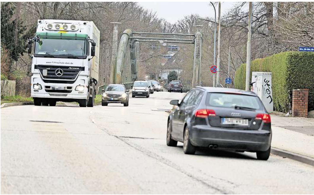
Im April dieses Jahres soll es losgehen: Die Geniner Dorfstraße wird auf einem 845 Meter langen Stück saniert.