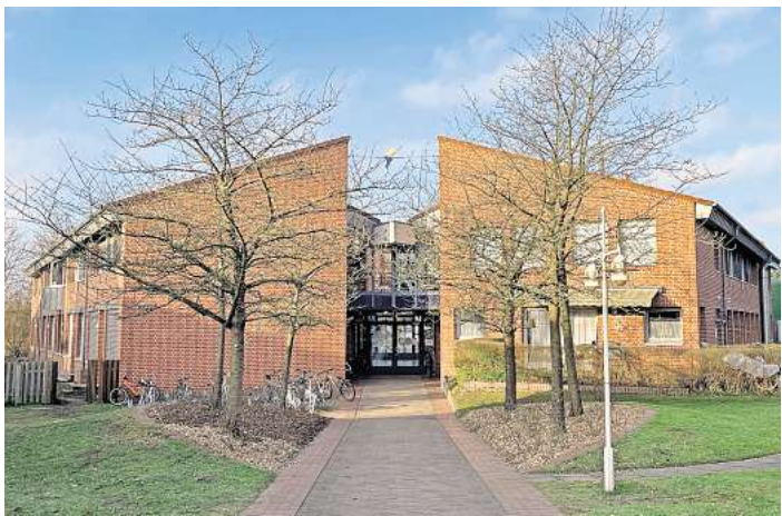
Der Ausbau der Erich-Kästner-Grundschule in Stockelsdorf soll 2025 starten.

In der Max-Hamerich-Straße sollen für rund 4,2 Millionen Euro elf Wohneinheiten entstehen. Am Mühlenberg plant die Ge-