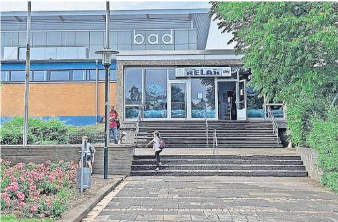
Die Schwimmhalle in Bad Schwartau wird hauptsächlich von Schulen und Vereinen genutzt.

Stabile Zahlen kann auch das nördlichste Schwimmbad, das