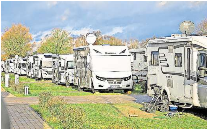
Wohnmobile auf einem Campingplatz in Ostholstein. Viele der Reisenden sind längst das ganze Jahr über unterwegs und sorgen so für Umsatz abseits der Hauptsaison.

Anfang August soll eine neue Anlage für 29 Wohnmobile in Lensterstrand (Gemeinde Grömitz) fertig sein. Die Lage ist besonders gut. Lediglich der Deich wird die Urlauber vom Strand trennen (die LN berichte-