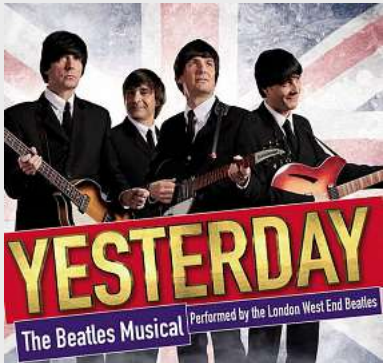
Tribute to the Beatles MuK, Lübeck