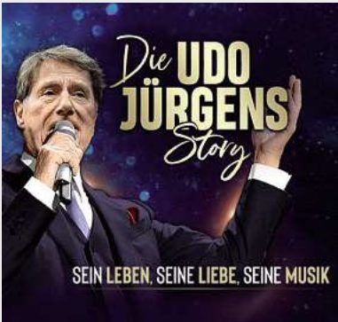
Die Udo Jürgens Story MuK, Lübeck