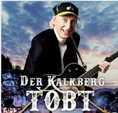
Otto – Der Kalkberg tobt Kalkberg, Segeberg