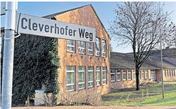
Der Mittelbau der Grundschule Cleverbrück soll laut dem Entwurf des Planungsbüros komplett abgerissen und erneuert werden. Vorgesehen ist ein Erdgeschoss sowie ein erstes Geschoss.

Die zuletzt angedachte Lösung mit einem Solitärbau wurde wieder eingekassiert und eine umsetzungsreife Planung vom Hamburger Büro PLP aus dem Jahr 2020 ohne Gegenstimme beschlossen. Die Kosten dafür werden auf rund 11,8 Millionen Euro geschätzt. Zu Beginn der Grundschuldiskussion 2017 war noch von rund 3,9 Millionen Euro die Rede. Doch diese üppige Steigerung