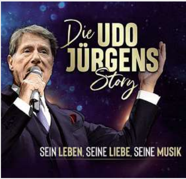
Die Udo Jürgens Story MuK, Lübeck