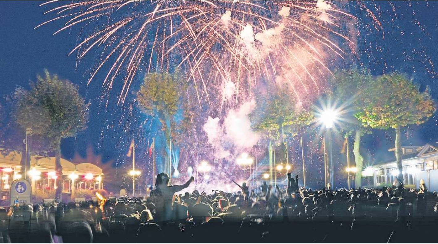
Das Silvester-Feuerwerk auf der Seebrücke in Grömitz sorgt jedes Jahr erneut für viele Ahs und Ohs der Besucher.

Kräftig gefeiert werden soll auch in Scharbeutz : Im Kurpark bietet die Eiswelt von 20 bis 2 Uhr eine Party im beheizten Zelt mit Songs vom DJ. Für Speisen und Getränke ist gesorgt. Das Schlittschuhlaufen ist auf den gesamten Eisflächen bis 23 Uhr möglich. Der Eintritt zur Silvesterparty ist frei.