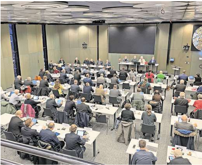
Letzte Sitzung des Jahres 2024: Im Kreishaushalt in Eutin ging es unter anderem um den Haushalt.

Gut 483 Millionen Euro will der Kreis kommendes Jahr in Projekte investieren. Unter anderem in den Ausbau eines Sirenen-Netztes. Einstimmig einigte man sich in der Sitzung darauf, in den kommenden sechs Jahren eine Infrastruktur zu schaffen, um künftig die Bevölkerung im Falle von Katastrophen zu warnen. Kostenfaktor: Zwölf Millionen Euro, die bis 2030 investiert werden sollen. 1,5 Mil-