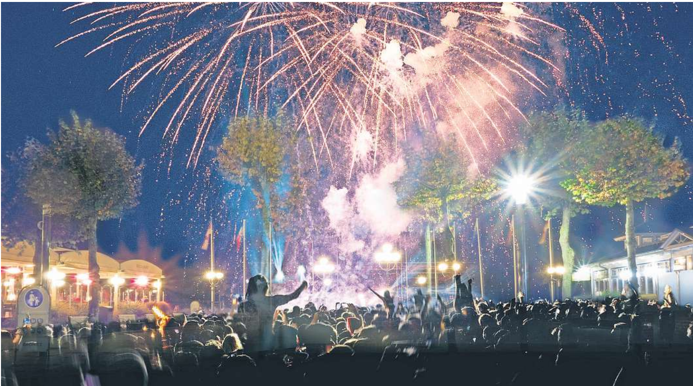
Das Silvester-Feuerwerk auf der Seebrücke in Grömitz sorgt jedes Jahr erneut für viele Ahs und Ohs der Besucher.

Kräftig gefeiert werden soll auch in Scharbeutz : Im Kurpark bietet die Eiswelt von 20 bis 2 Uhr eine Party im beheizten Zelt mit Songs vom DJ. Für Speisen und Getränke ist gesorgt. Das Schlittschuhlaufen ist auf den gesamten Eisflächen bis 23 Uhr möglich. Der Eintritt zur Silvesterparty ist frei.