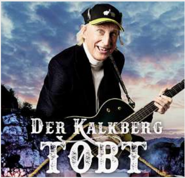
Otto – Der Kalkberg tobt Kalkberg, Segeberg