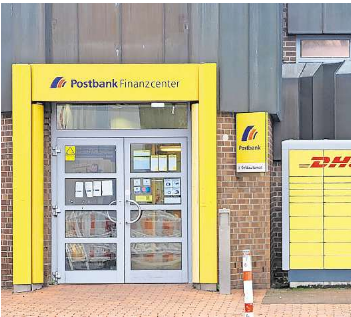
Schließt zum 15. Januar: Die Postbank-Filiale am Lübecker Meesenring.

Nun folge die Postbank: Im August hatte die Postbank noch in Aussicht gestellt, ihre Filiale erst im Laufe des kommenden Jahres zu schließen. „Mit Blick darauf