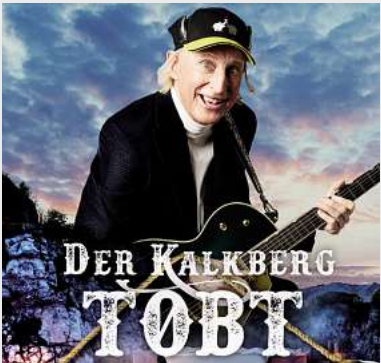
Otto – Der Kalkberg tobt Kalkberg, Segeberg