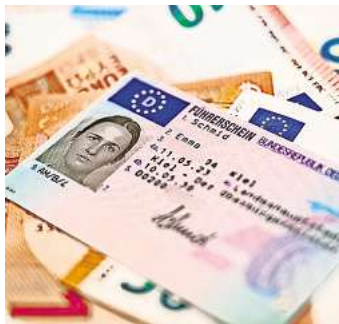
Der Umtausch des Führerscheins kostet nicht überall gleich viel.