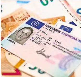
Der Umtausch des Führerscheins kostet nicht überall gleich viel.