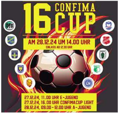
16. Confima Cup Hansehalle, Lübeck