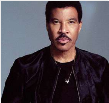
Lionel Richie Barclays Arena, Hamburg

16. Confima Cup Hansehalle, Lübeck 27.12. bis 28.12.2024 8,80 €