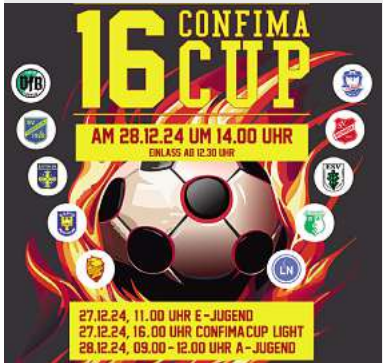
16. Confima Cup Hansehalle, Lübeck