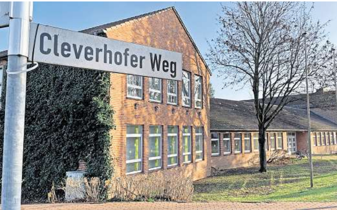
Der Mittelbau der Grundschule Cleverbrück soll laut dem Entwurf des Planungsbüros komplett abgerissen und erneuert werden. Vorgesehen ist ein Erdgeschoss sowie ein erstes Geschoss.

Die zuletzt angedachte Lösung mit einem Solitärbau wurde wieder eingekassiert und eine umsetzungsreife Planung vom Hamburger Büro PLP aus dem Jahr 2020 ohne Gegenstimme beschlossen. Die Kosten dafür werden auf rund 11,8 Millionen Euro geschätzt. Zu Beginn der Grundschuldiskussion 2017 war noch von rund 3,9 Millionen Euro die Rede. Doch diese üppige Steigerung