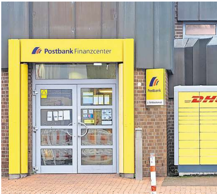
Schließt zum 15. Januar: Die Postbank-Filiale am Lübecker Meesenring.

Nun folge die Postbank: Im August hatte die Postbank noch in Aussicht gestellt, ihre Filiale erst im Laufe des kommenden Jahres zu schließen. „Mit Blick darauf