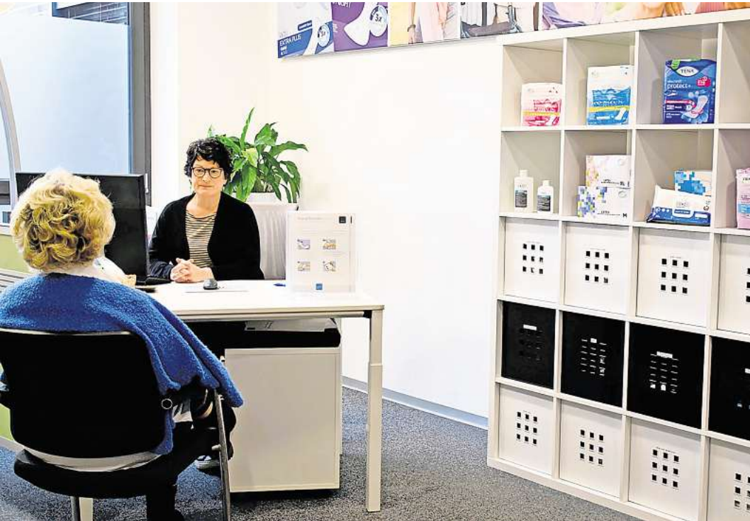
Bei der Beratung nehmen sich die unizell-Mitarbeiterinnen und -Mitarbeiter Zeit, um auf die individuellen Bedürfnisse der Kunden einzugehen.

Die Mitarbeiter nehmen sich Zeit, um in der Beratung auf die individuellen Bedürfnisse der Kunden einzugehen und maß-