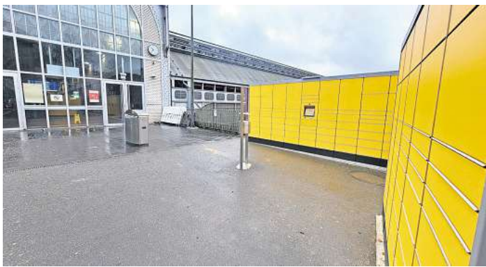
Am Ausgang zum Steinrader Weg des Bahnhofes gibt es nun eine DHL-Packstation.

LÜBECK. Neuer Service für Pendlerinnen und Pendler am Lübecker Hauptbahnhof: Bald können Bahnfahrende ihre Pakete und Päckchen direkt am Bahnhof empfangen oder versenden. Am Ausgang zum Steinrader Weg wurde gerade eine neue DHL-Packstation mit 120 Fächern aufgebaut. „Für die Deutsche Post DHL Group und die Deutsche Bahn sind Bahnhöfe als zentrale Drehscheiben mitten in der Stadt ideale Standorte für neue Packstationen“, sagt eine Sprecherin der Deutschen Bahn. Der Paket-service werde an Bahnhöfen besonders gut angenommen. Den Lübecker Hauptbahnhof nutzen