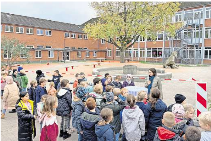
Erst kürzlich wurde die erste Hälfte des umgestalteten Schulhofes der Grundschule Bad Schwartau freigegeben. Für die Umgestaltung bekommt die Stadt einen Fördergeldzuschuss.

Für Stockelsdorf gibt es einen Förderzuschuss in Höhe von 575.000 Euro. Das Geld gibt es für die bereits 2023 angeschafften In-