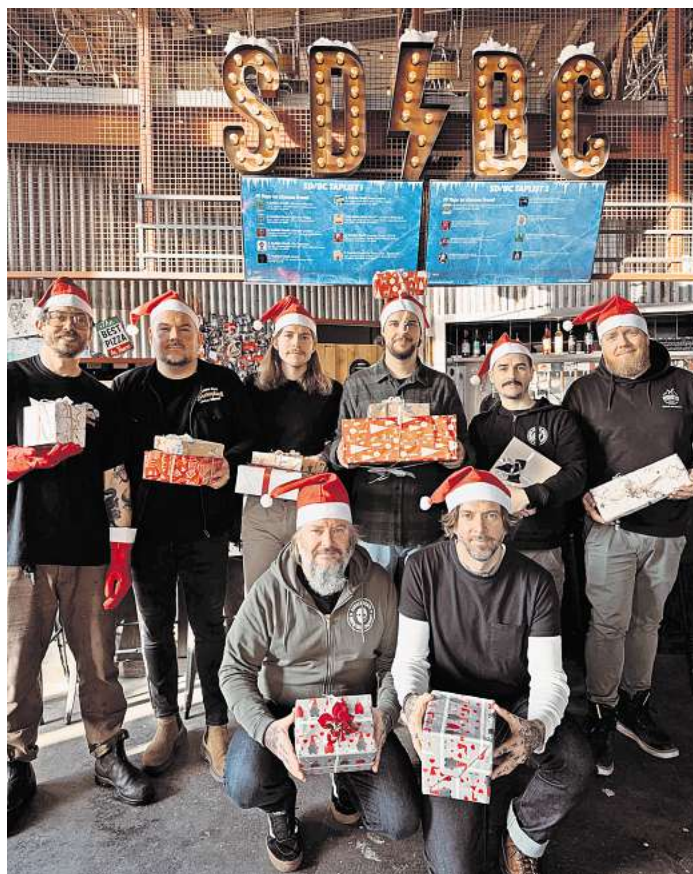
Die Crew der Sudden Death Brauerei initiiert wieder eine Aktion für die Obdachlosenhilfe Lübeck.

Sachspenden können bis spätestens Samstag, 14. Dezember, bei der Sudden Death Brauerei an der Einsiedelstraße 6 in Lübeck abgegeben werden. „Mit dieser Aktion möchten wir nicht nur helfen, sondern auch ein Zeichen setzen: Niemand sollte in unserer Gesellschaft übersehen werden.“