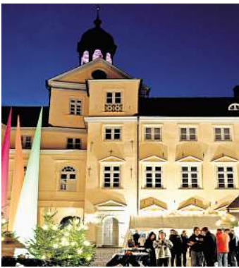
Bei der Kiwanis „Weihnacht im Schloss“ herrscht eine feierliche Stimmung.

OSTHOLSTEIN. Festlicher Lichterglanz, Weihnachtssterne und geschmückte Tannenbäume zaubern ein weihnachtliches Flair in den schönen Innenhof des Eutiner Schlosses. Der traditionelle Weihnachtsmarkt des Kiwanis-Clubs Ostholstein e. V. geht im Jahr 2024 in seine 25. Auflage und ist als einziger Weihnachtsmarkt im Schloss in Eutin fester Bestandteil in der Adventszeit für Besucher aus Eutin, Ostholstein und darüber hinaus. Der Innenhof und zwei Ebenen in den Schlossflügeln bieten viel Platz für die 38 Aussteller und laden zu einem gemütlichen Bummel ein. Für das leibliche Wohl ist gesorgt. Auch in diesem Jahr gibt es die schmackhafte Grillwurst aus der Land-schlachterei, dazu leckere Pommes, Schmalzbrote und Erbsensuppe – auch mit Wurst. Das Kuchenbuffet lädt ein zu Kaffee, Kuchen und selbst gemachten Waffeln.