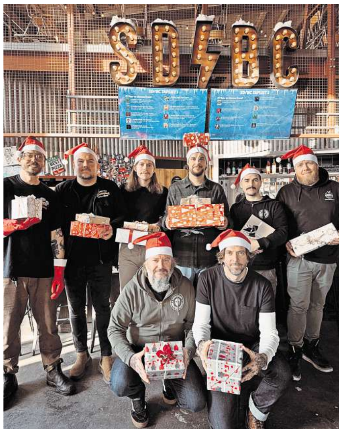
Die Crew der Sudden Death Brauerei initiiert wieder eine Aktion für die Obdachlosenhilfe Lübeck.

Sachspenden können bis spätestens Samstag, 14. Dezember, bei der Sudden Death Brauerei an der Einsiedelstraße 6 in Lübeck abgegeben werden. „Mit dieser Aktion möchten wir nicht nur helfen, sondern auch ein Zeichen setzen: Niemand sollte in unserer Gesellschaft übersehen werden.“