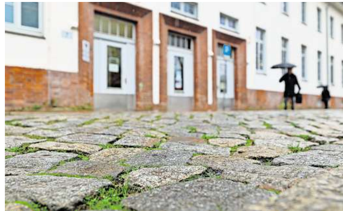
Am Meesenring soll der Übergang zum Bürgerservicebüro neu gepflastert werden.