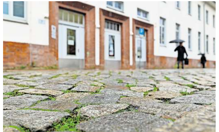
Am Meesenring soll der Übergang zum Bürgerservicebüro neu gepflastert werden.

Am Meesenring befinden sich nicht nur zahlreiche Einkaufsmöglichkeiten, sondern auch Einrichtungen der Hansestadt Lübeck wie das Bürgerservicebüro St. Gertrud. Die Verwaltung wollte die Umgestaltung 2026 angehen. Der Bürgerschaft war das zu spät. Sie beschloss, dass schon 2025, wenn möglich 2024 angefangen werden soll. Julian Lange (SPD) sagte im Ausschuss, dass es sich beim Meesenring um eines der am häufigsten angesprochenen Themen im Stadtteil handele. „Wir sind dabei“, sagte Straßenplaner Dirk Dreilich. Dabei gehe es aber nicht um eine Grundsanierung, sondern um eine neue Pflasterung von mehreren Straßenübergängen. An einigen Stellen soll geschnittenes Pflaster in die Fahrbahn eingebaut werden, sodass die Querung der Straße für beeinträchtigte Menschen leichter wird. Zu-