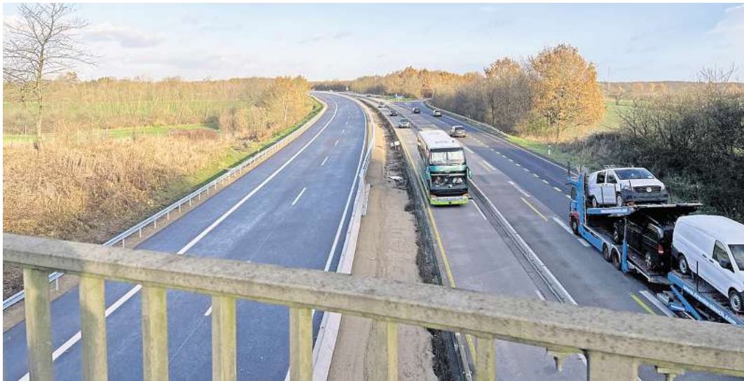
Links die neue Fahrbahn Richtung Süden im Bereich Ratekau: Auf 5,3 Kilometern wurde die Strecke erneuert.

DIESE ARBEITEN MÜSSEN NOCH ERLEDIGT WERDEN In den vergangenen Jahren hat die Autobahn GmbH nach und nach mehrere Abschnitte zwi-