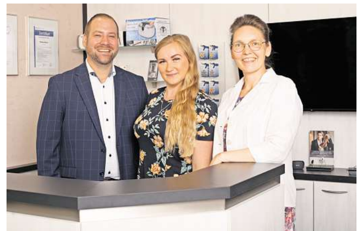
Erstklassigen Service und hohe Qualität bietet auch das Team von Hörgeräte Kersten in Stockelsdorf.

■ Hörgeräte Kersten Rathausmarkt 2b 23617 Stockelsdorf Telefon 0451 / 49 91 29 3 www.hoergeraete-kersten.de