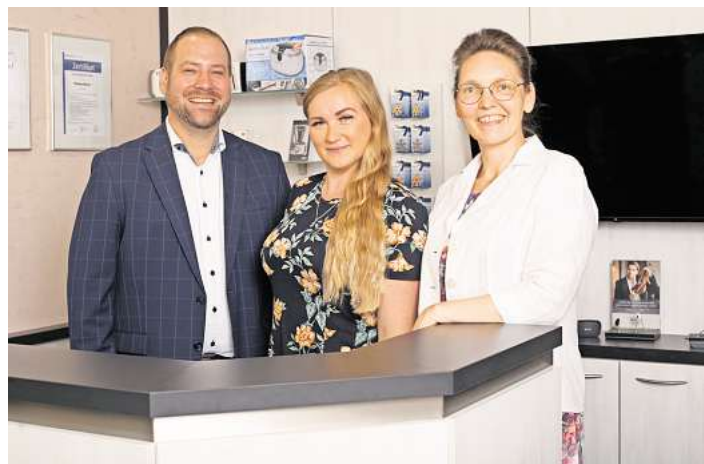
Erstklassigen Service und hohe Qualität bietet auch das Team von Hörgeräte Kersten in Stockelsdorf.

■ Hörgeräte Kersten Rathausmarkt 2b 23617 Stockelsdorf Telefon 0451 / 49 91 29 3 www.hoergeraete-kersten.de