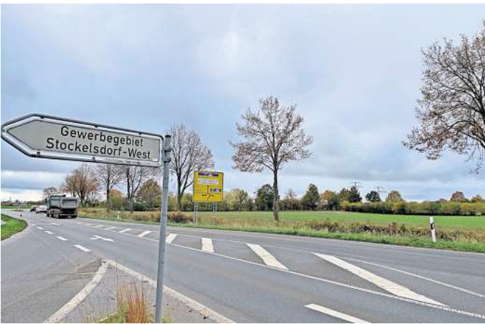
Das freie Feld gegenüber der Zufahrt zum Gewerbegebiet Stockelsdorf-West hat die Gemeinde Stockelsdorf eigentlich als Erweiterungsfläche für Gewerbe vorgesehen. Doch das Areal wird nun durch den Bau einer 380-kV-Leitung zerschnitten.

Insbesondere der geplante Abschnitt der Elbe-Lübeck-Leitung, die von dem neuen Umspannwerk in