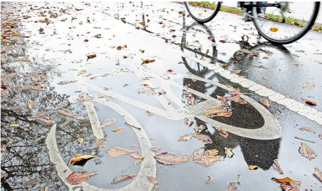
Achtung Rutschgefahr: Wer im Herbst und Winter auf zwei Rädern unterwegs ist, sollte auf nassem Herbstlaub besonders vorsichtig fahren.

Henri Heck empfiehlt Fahrradfahrern eine Warnweste. Diese seien nicht teuer, machten aber einen großen Unterschied. „Allein eine Warnweste erhöht die