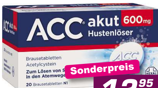
ACC akut 600mg 20 Br. Tabl. *