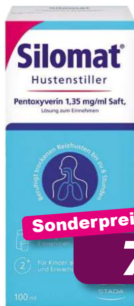
Silomat Hustensaft 100 ml *