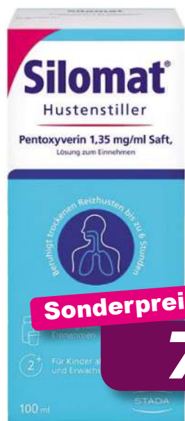
Silomat Hustensaft 100 ml *