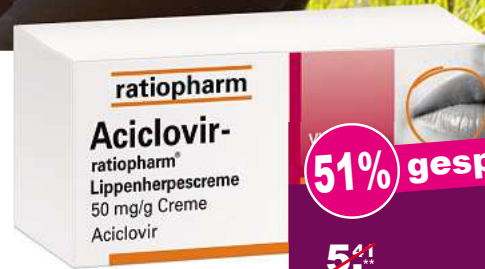
Aciclovir Ratiopharm gegen Lippenherpes 2 g *