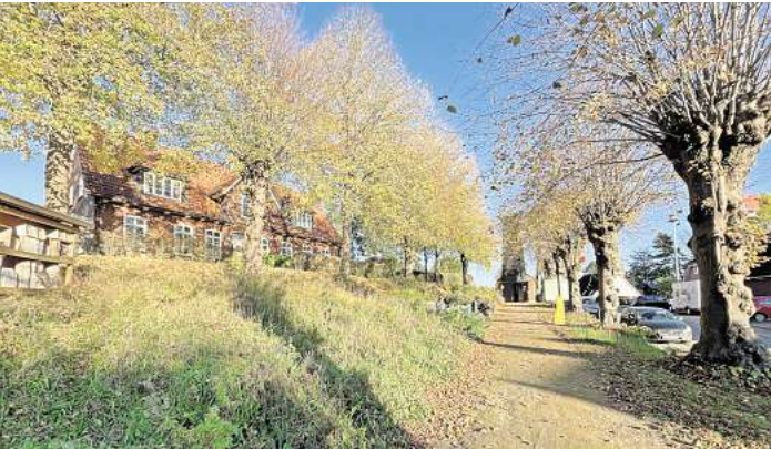
Der Dorfplatz in Dunkelsdorf hat beim landesweiten Wettbewerb des Schleswig-Holsteinischen Heimatbundes in der Kategorie neu angelegte Dorfplätze den 1. Platz belegt.

Der Dorfplatzwettbewerb steht unter dem Motto „Dorfplätze in Schleswig-Holstein – Lebendige Plätze für Mensch und Natur“. Das Ziel ist es, die Bedeutung lebendiger Ortskerne bekannter zu machen. Und lebendig geht es in Dunkelsdorf zu. Einst pflegten die Frauen des Dorfes den Anger, berichtet Dorfvorsteherin Claudia Hamann. „Dann verwilderte der Platz über viele Jahre.“ Bis engagierte Dunkelsdorfer, die Gemeinde und die Aktivregion Holsteinische Schweiz die Sache in die Hand nahmen.