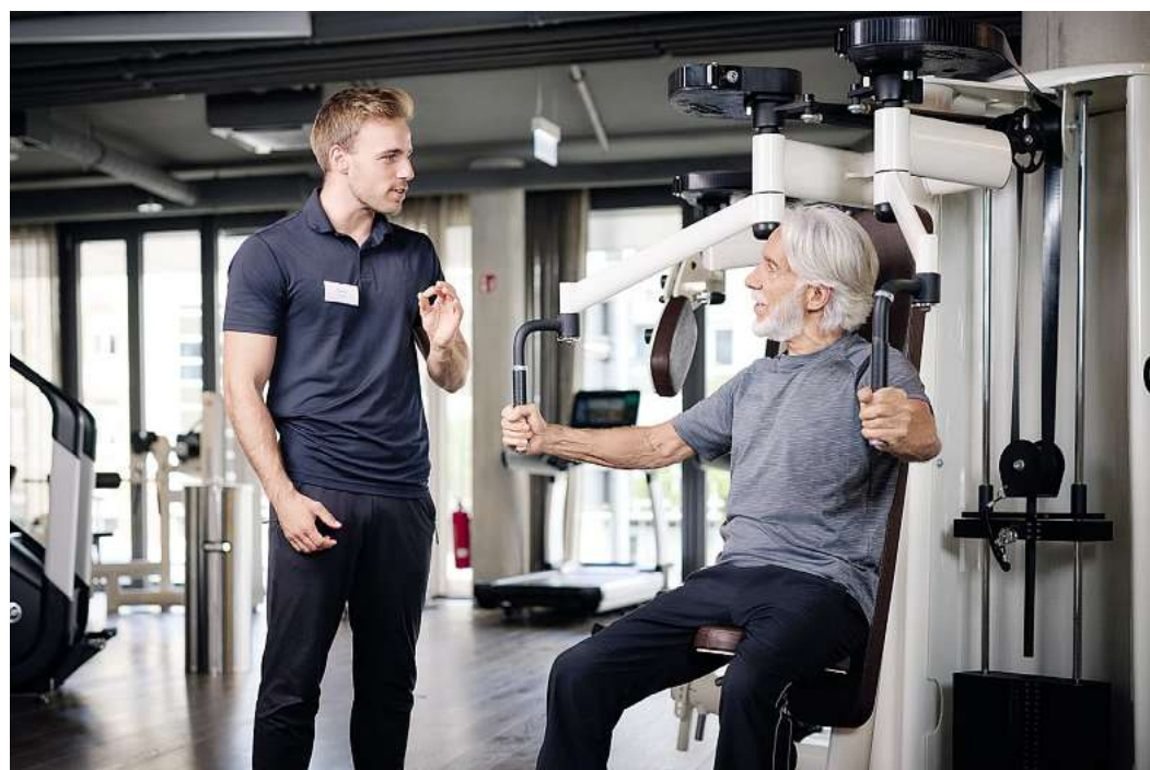
Gesetzliche Krankenkassen unterstützen das Programm

Carstens Gesundheitstraining bietet ein Programm speziell für die Zielgruppe 50+ an. Neben individuell zugeschnittenen Trainingsplänen und inten-