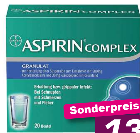
Aspirin Complex 20 Btl. */***