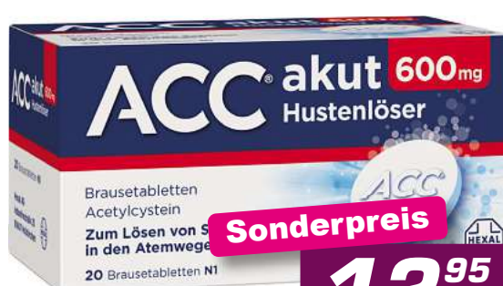
ACC akut 600mg 20 Br. Tabl. *