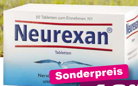
Neurexan 50 Tabl. *