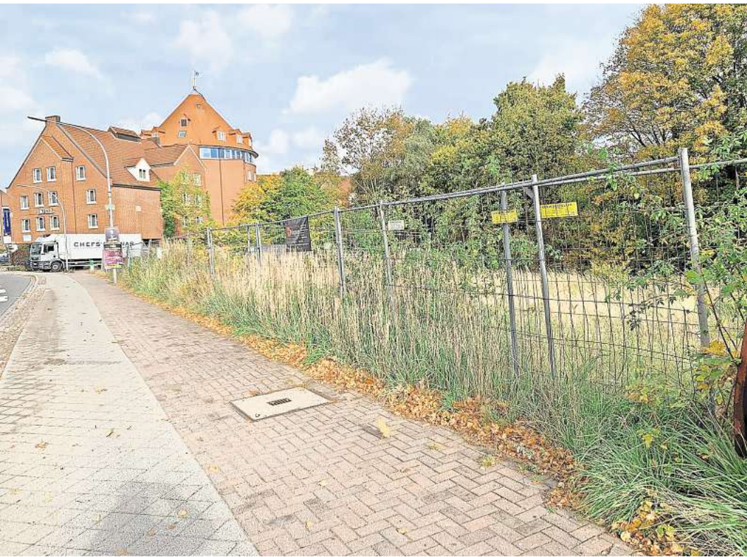
Auf dem Drei-Kronen-Grundstück in Stockelsdorf passiert endlich etwas. Der Baubeginn eines dreistöckigen Gebäudes steht kurz bevor.

Der Investor gab allerdings nicht auf: Sein überarbeiteter Entwurf sah vor, aus dem schon