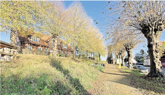
Der Dorfplatz in Dunkelsdorf hat beim landesweiten Wettbewerb des Schleswig-Holsteinischen Heimatbundes in der Kategorie neu angelegte Dorfplätze den 1. Platz belegt.