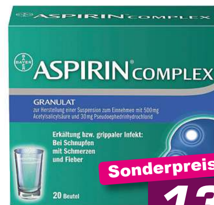
Aspirin Complex 20 Btl. */***