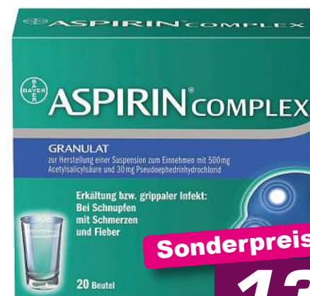
Aspirin Complex 20 Btl. */***