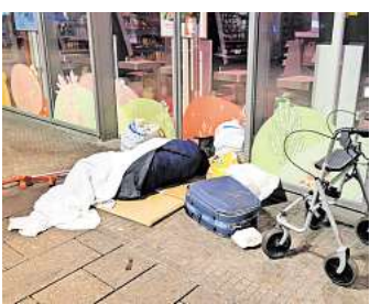
Sein Bett ist die Straße: Auf einer dünnen Unterlage, notdürftig zugedeckt, schläft dieser Obdachlose auf einem Gehweg in Lübeck.

unterkommen. Deshalb hat Rühmling sich etwas überlegt: Restaurantpatenschaften, über die Paten jeweils einen Monat lang das Essen aus einem Restaurant bezahlen, was 420 Euro entsprechen würde. Das sei bislang aber nur eine Idee. Noch etwas bereitet Rühmling Sorgen: In den sozialen Medien wird öffentlich darüber diskutiert, dass die Stadt, so schildert es Rühmling, keine Mietkosten für die Lagerhalle der Flüchtlingshilfe erhebe. Die Obdachlosenhilfe müsse dagegen, nachdem sie zur Gründung 10.000 Euro für den Herzenswärmebus von der Stadt bekommen hatte, monatlich 485 Euro Miete zahlen. Dem 51-Jährigen sei die Debatte mehr als unangenehm. Zwar könne er nicht nachvollziehen, warum die Vereine nicht gleich