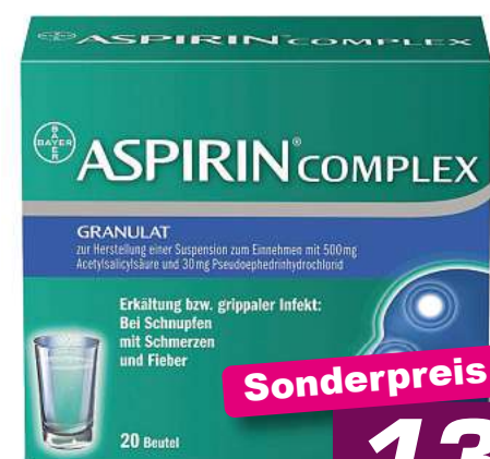
Aspirin Complex 20 Btl. */***