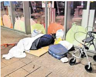
Sein Bett ist die Straße: Auf einer dünnen Unterlage, notdürftig zugedeckt, schläft dieser Obdachlose auf einem Gehweg in Lübeck.

behandelt werden. „Ich will aber absolut nicht, dass die Folge ist, dass die Flüchtlingshilfe künftig auch Miete zahlen muss.“ Was ihn bei all den Bedenken aufbaue: die Unterstützung von Lübeckerinnen und Lübeckern. Er sei sehr dankbar für die Spenden.