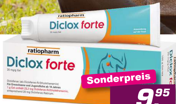
Diclox forte Ratiopharm 100 g *