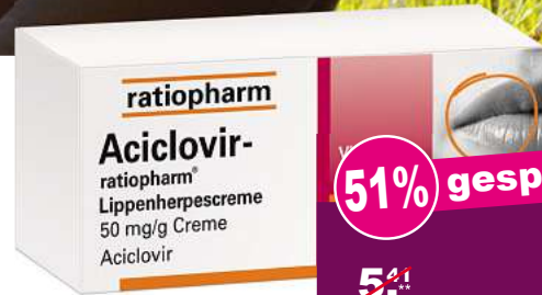
Aciclovir Ratiopharm gegen Lippenherpes 2 g *