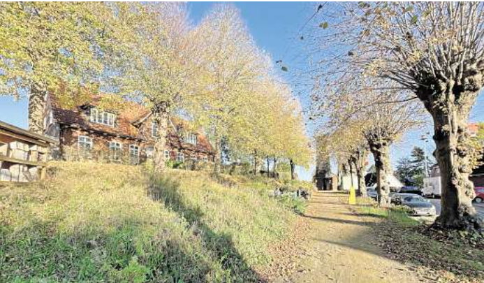
Der Dorfplatz in Dunkelsdorf hat beim landesweiten Wettbewerb des Schleswig-Holsteinischen Heimatbundes in der Kategorie neu angelegte Dorfplätze den 1. Platz belegt.