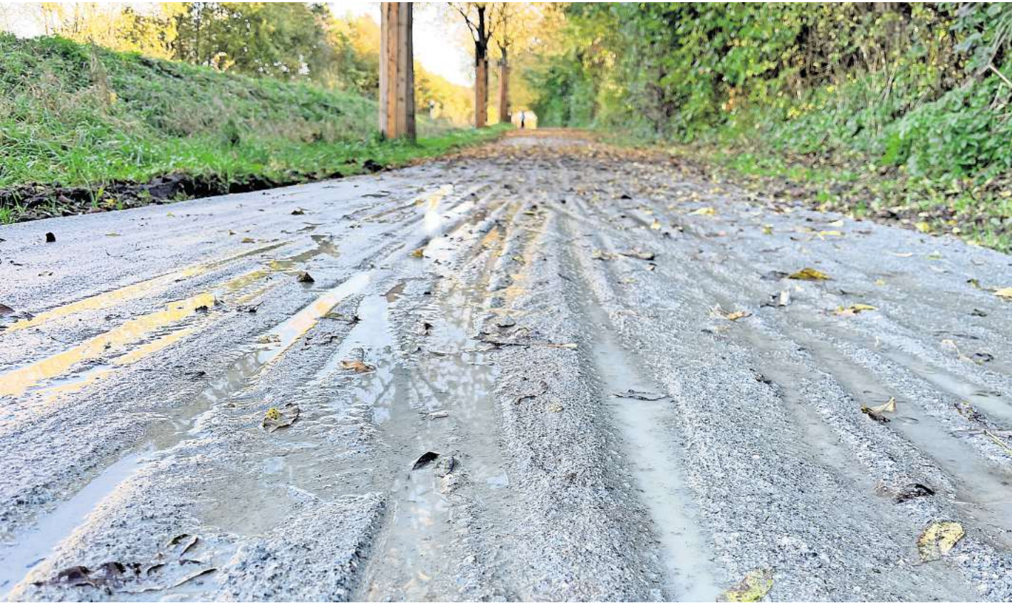
Überall Spurrillen: Der neue Radweg zwischen Bad Schwartau und Pohnsdorf sorgt bei Nutzern aktuell für Kopfschütteln.

Er ist nicht der einzige, den der Zustand des Radwegs ratlos zurückschlägt. Nachdem er seinen Unmut bei Facebook öffentlich gemacht hat, bekommt er viel Zustimmung. „Bin sprachlos! Das kann doch so niemand ernsthaft abnehmen“, schreibt ein Bad Schwartauer. Oder: „Das wirkt so als hätte ‚man was vergessen‘, und zwar das ganze Ding fertig zu