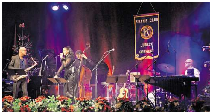
Das Kiwanis-Konzert bietet viel Jazz und Soul.

Das Kiwanis-Benefiz-Weihnachtskonzert 2024 findet wieder im Kolosseum statt.