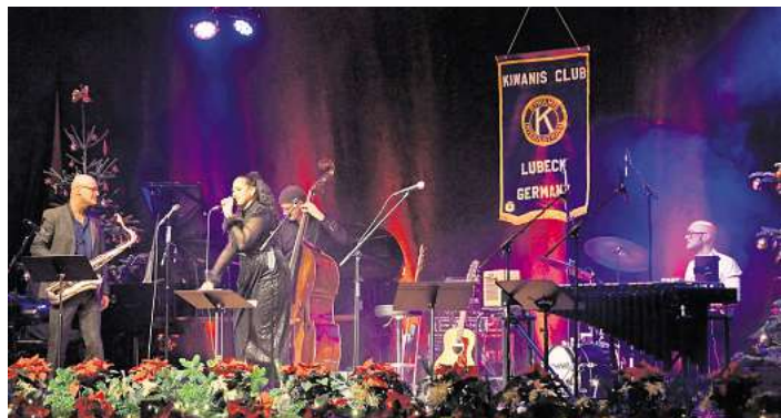
Das Kiwanis-Konzert bietet viel Jazz und Soul.

Das Kiwanis-Benefiz-Weihnachtskonzert 2024 findet wieder im Kolosseum statt.