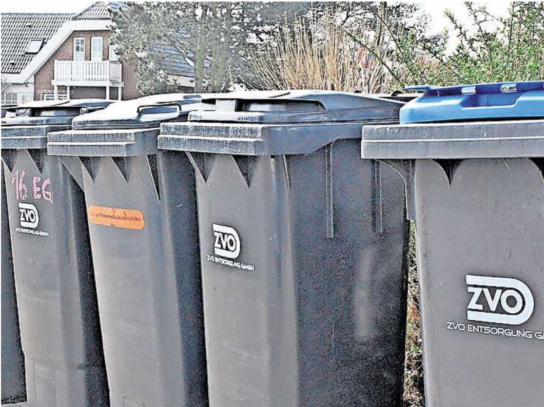
Bereit zur Abholung: Meistens klappt das auch, doch hin und wieder bleiben die Tonnen auch gefüllt stehen.

licht der Zweckverband in seiner Abfall-App sowie in den sozialen Medien und auf der Website. Zu-letzt ist das in Neustadt passiert. Die Papiertonnen mussten stehen gelassen werden, die Touren wurden nachgeholt. Die Kunden reagieren darauf mit Verständ-nis. „Sowas kann passieren“, schreibt eine Neustädterin unter die Information.