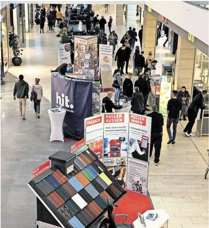
Am Mittwoch beginnen die Bau- und Energietage im Citti-Park Lübeck.

LÜBECK. Um „Bauen und Energie“ geht es in der Mall des Citti-Parks. Am Mittwoch, 30. Oktober, sowie am Freitag und Sonnabend, 1. und 2. November, können sich Bauinteressierte von Fachleuten umfassend zu Immobilien, Fertigbauten, Baumaterialien und Bauelementen beraten lassen sowie Informationen und Anregungen über Möglichkeiten einer eigenen Energiegewinnung und effektiven Verwendung erhalten. Die Aussteller sind täglich vor Ort und informieren über ihre aktuellen Angebote und neuesten Produkte. Den Traum vom eigenen Heim kann sich der Besucher bei „Nordiska Haus“ erfüllen. Die Berater gestalten für jeden Interessierten ein speziell zugeschnittenes Angebot. Vielfältige und modernen Bauteile wie Türen, Fenster und Terrassenelemente finden sich bei den Firmen „Heim & Haus“ und „Grosche Überdachungssysteme“. Die Mitarbeiter halten mit ihrer fachlichen Erfahrung Lösungen für jedes Problem bereit. Die auf der Präsentation von „Steintepich-Trend“ angebotenen optimalen Lösungen für schöne und zweckmäßige Bodenbeläge gehören ebenfalls dazu. Für jeden Haushalt bringen die steigenden Energiepreise neue zusätzliche Belastungen und ein zunehmendes Interesse an Lösungen für eine eigene Energiegewinnung. Daher steht die wirksame Nutzung der Sonnenenergie zur eigenen Energieerzeugung im Mittelpunkt bei weiteren Ausstellern. So kann der Besucher am Stand der Stadtwerke Lübeck die dafür notwendigen technischen