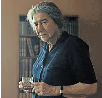
Helen Mirren spielt Israels Ministerpräsidentin Golda Meir.

im Kabinett und gegenüber ihren Generälen zeigt, die in fast hoffnungsloser Lage die Öffentlichkeit täuscht und im Hintergrund diplomatisch klug verhandelt. Berührend und spannend, obwohl der Ausgang bekannt ist. Der Film endet mit einem Lichtblick. Das Ticket kostet sieben Euro, für Koki-Mitglieder 4,50 Euro.