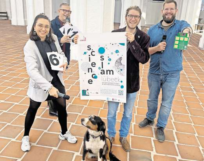
Das Team von St. Petri freut sich auf einen erkenntnisreichen Abend beim Science Slam.

Am Samstag findet auf der Festwiese am Gemeinschaftshaus das Lichterfest mit Laternenumzug statt. Die Festwiese ist für die Besucher ab 17.30 Uhr geöffnet. Um 18.30 Uhr startet der Laternenumzug, der von der Deutschen Jugend-Brassband Lübeck begleitet wird. Es wäre schön, wenn die Kinder eigene Laternen beim Umzug mitführen würden. Gegen 20 Uhr wird eine Feuershow mit dem Duo „Flammenspek“ präsentiert. Es gibt Stockbrot am Lagerfeuer, Mutzen sowie kalte und warme Getränke. Der Eintritt ist frei.