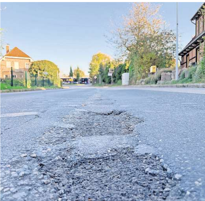
Die brüchige Fahrbahn der K18 in der Ortsdurchfahrt Groß Parin wird saniert. Für die Arbeiten wird die Straße abschnittsweise voll gesperrt.

Der erste Bauabschnitt ist der Bereich zwischen den Hausnum-mern Groß Parin 1a bis Groß Pa-rin 11. Dieser Abschnitt soll in der Zeit vom 21. bis 30. Oktober voll gesperrt werden. Vom 1. bis 8. November folgt dann der Bereich von der Hausnummer 11 bis zur 25. Die Bauarbeiten erstrecken sich also noch nicht einmal über eine Strecke von 500 Metern.