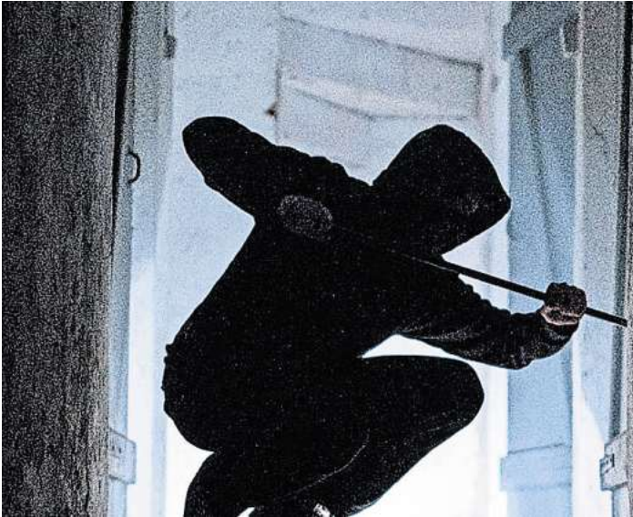
In Bad Schwartau mehrten sich zuletzt die Einbrüche und Einbruchversuche. symbolFoto: Silas Stein/dpa

Am 8. September stellte die Mitarbeiterin einer Bäckerei Hebelspuren an einer Filiale im Eutiner Ring fest. Auch hier war es nicht gelungen, in das Objekt zu gelangen. Ein paar Tage später, am 11. September, schlugen die Einbrecher erneut zu. Hier stellte ein Ostholsteiner den Aufbruch seines Kellerverschlags in der Bahnhofstraße fest. Zwischen dem 6. und 13. September muss sich außerdem ein weiterer versuchter Einbruch in der Jesse-Owens-Straße ereignet haben. An einer Wohnung im oberen Stockwerk eines Mehrfamilienhauses wur-