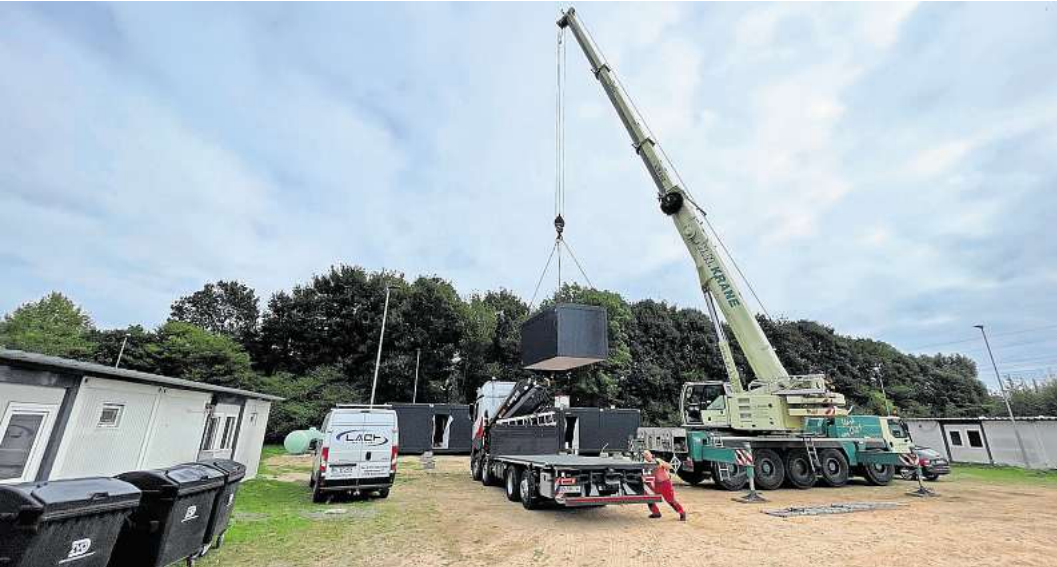
Vom Tieflader per Kran an den vorbereiteten Standort: In der Pohnsdorfer Straße werden weitere Wohncontainer für Flüchtlinge aufgestellt.