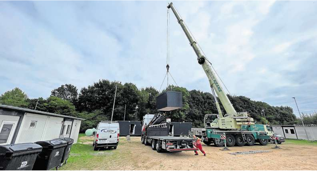
Vom Tieflader per Kran an den vorbereiteten Standort: In der Pohnsdorfer Straße werden weitere Wohncontainer für Flüchtlinge aufgestellt.