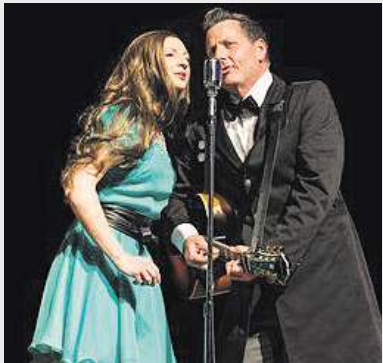
The Johnny Cash Show Kolosseum, Lübeck