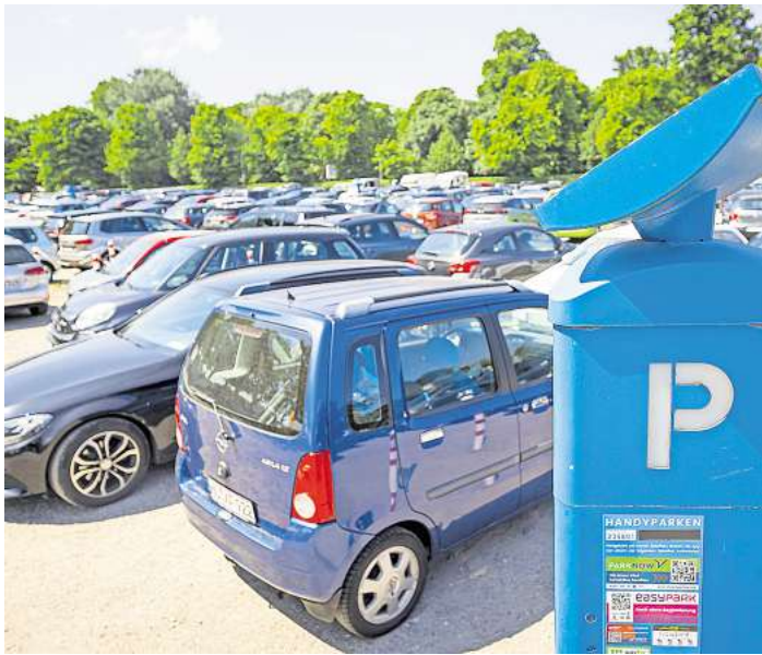
Die Parkplätze in Travemünde sind im Sommer und bei Großveranstaltungen schnell ausgebucht. Autofahrende versuchen ihr Glück in den kleinen Straßen, das sorgt für Chaos.

Die Fraktion der Unabhängigen Volt-Partei (Unvopa) schlägt nun einen temporären Pop-up-Parkplatz an der Straße Howingsbrook oder am Gneversdorfer Weg/Ecke Nordmeierstraße vor. Pop-up meint, dass der Stellplatz