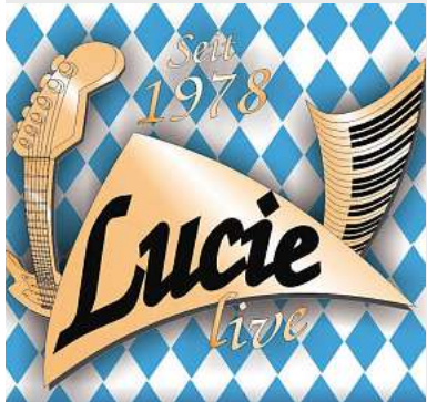
Lucie live Festzelt, Schlutup