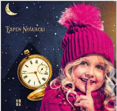
Die stille Nacht MuK, Lübeck