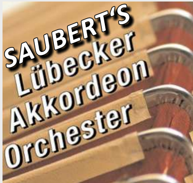
Lübecker Akkordeon Orchester Kolosseum, Lübeck