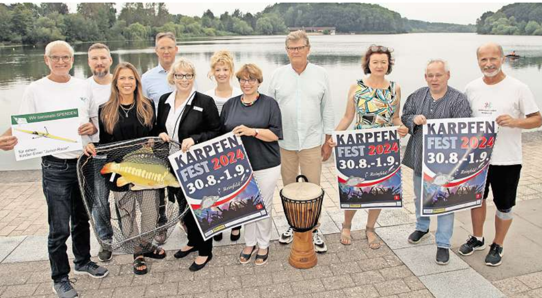
Veranstalter und Akteure freuen sich auf das Karpfenfest Reinfeld.