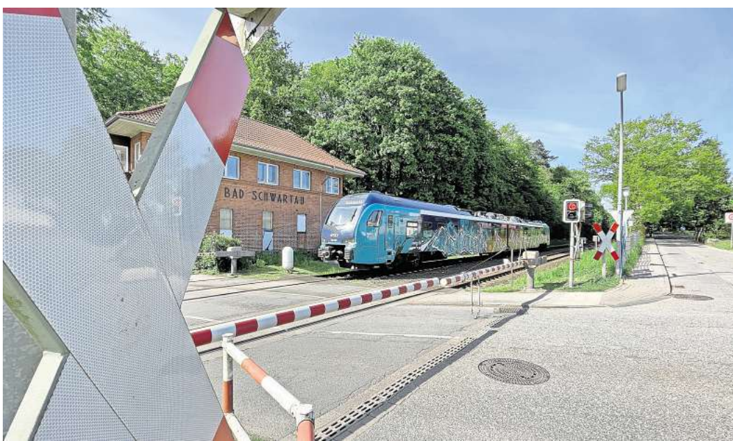
Über 300 Züge fahren voraussichtlich ab 2029 durch Bad Schwartau. Wie alle Bahnübergänge in Ostholstein entfällt auch dieser an der Kaltenhöfer Straße für die Belttunnel-Hinterlandanbindung. Er wird durch eine Brücke ersetzt.

Nach Angaben des Verkehrsunternehmens muss Bad Schwartau pro Tag mit diesen Zugzahlen rechnen: 70 Güterzüge mit einer Länge von bis zu 835 Metern, 220 Fahrten im Personennahverkehr und 24 im Fernverkehr. In Summe sind das 314 Zugfahrten. Gleichmäßig verteilt auf den gesamten Tag würde also alle viereinhalb Minuten ein Zug durch Ostholsteins größte Stadt fahren.