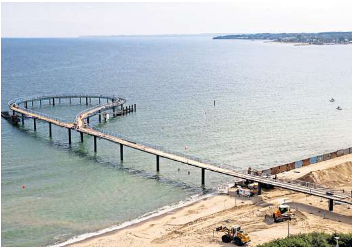
Ein 420-Meter-Rundgang über dem Meer: Die neue Maritim-Seebrücke steht kurz vor der Vollendung.

430 Meter lang, als Rundweg angelegt, mit bis zu 20 Metern Spannweite zwischen den einzelnen Brückenpfeilern, die bis zu 22 Meter tief in den Meeresboden gerammt wurden. Das alles laut Gemeinde fugen- und lagerlos konstruiert. So sei eine wartungsarme und robuste Konstrukt