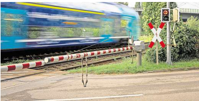
Der Bahnübergang auf die Teerhofinsel an der Grenze zwischen Lübeck und Bad Schwartau soll wegfallen.

gen hat die Bahn jetzt für den Bereich Lübeck veröffentlicht. Bis zum 19. September können Betroffene Einwendungen abgeben. „Wenn diese Pläne verwirklicht werden, müssen meine Kunden einen drei Kilometer langen Umweg fahren, mit zwei Abbiegungen und drohenden Rückstaus“, befürchtet Törper. Unterstützung bekommt er unter anderem von Katrin Marwitz. Sie wohnt seit 24 Jahren auf der Teerhofinsel und betreibt den Princess-Yachthafen. „Es hieß bis vor einem Dreivierteljahr immer, dass eine Brücke zur Insel gebaut wird, wenn der Bahnübergang geschlossen wird. Jetzt hieß es bei einer Versammlung der Bahn plötzlich, dass die Zuwegung über die Warthestraße kommt. Das ist keine gute Lösung“, sagt sie. „DIREKTER ZUGANG VON DER AUTOBAHN SEHR WICHTIG“ Investor Martin Rafalczyk hat gerade erst die neue Marina am Schilf gegründet. „Im März haben wir die Hansawerft ersteigert. Wir wünschen uns für Anwohner und Gewerbetreibende einen schnellen Zugang auf die Insel. Da kommen ja auch große Lkw, und die geplante Umleitung wäre ein sehr langer Weg, auf dem jetzt an normalen Tagen schon Stau ist. Ich befürchte, dass ich dadurch Kun-