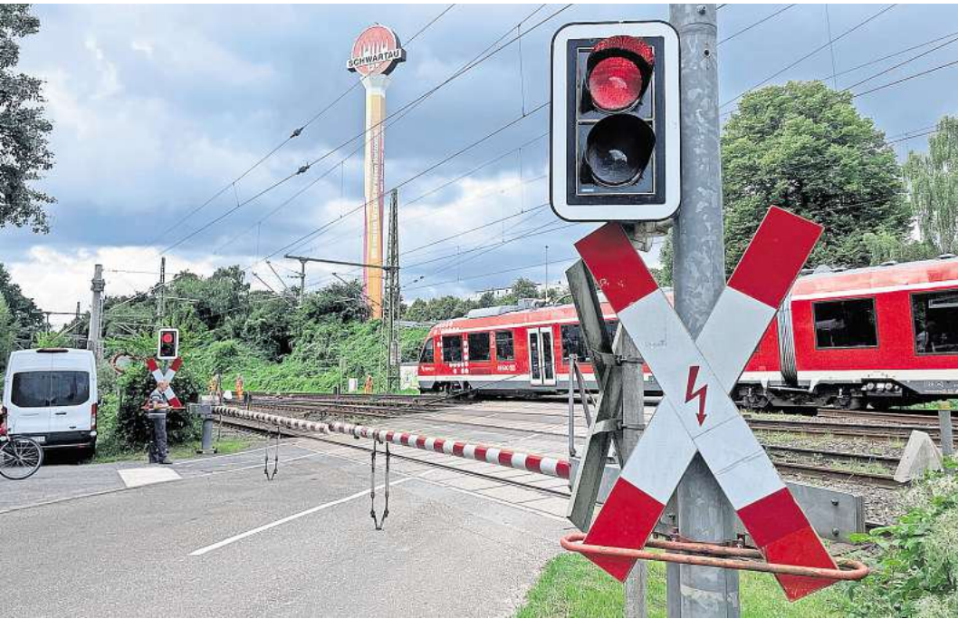
Der Bahnübergang an der Teerhofinsel soll im Zuge der Schienenhinterlandanbindung zur Festen Fehmarnbeltquerung (FFBQ) geschlossen werden. Der Verkehr soll künftig über eine neue Straße von der Warthestraße zur Teerhofinsel geleitet werden.

„Wir bereiten eine entsprechende Stellungnahme vor“,