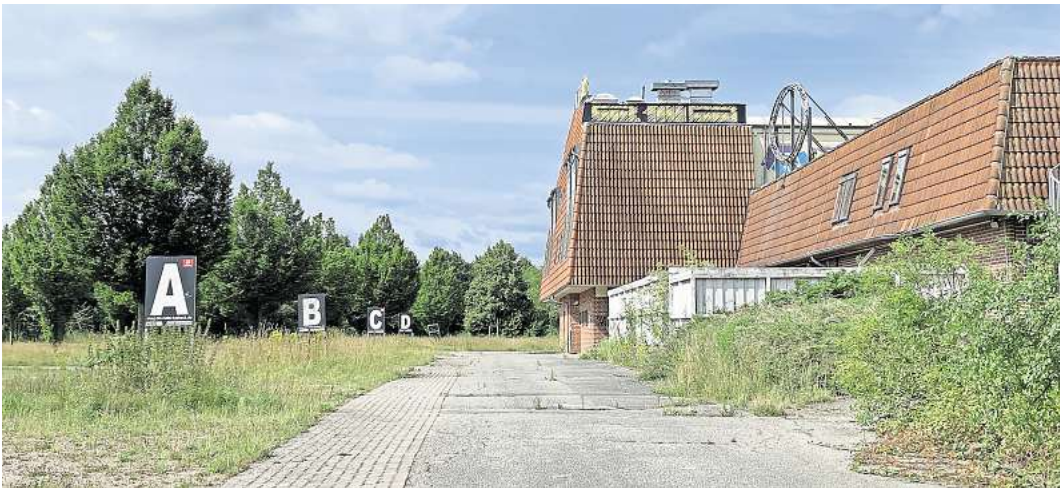
An der Daimlerstraße wird das ehemalige Abaco immer mehr zum Lost Place.