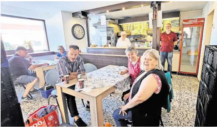
Treffpunkt und günstiges Essen für rund 70 Menschen täglich: Das Café Salut der Lübecker Heilsarmee muss an der Untertrave vielleicht bald schließen.