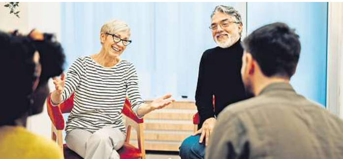
Angehörige kommen bei dem Angebot des Projekts „bewegt und belebt“ miteinander ins Gespräch, während die Senioren etwas für ihr Wohlbefinden tun.

Forschungsgruppe Geriatrie Lübeck Krankenhaus Rotes Kreuz Lübeck -Geriatriezentrum- Projekt „bewegt und belebt“ Telefon: 0451-98902-205 oder 98902-201 E-Mail: buchtal@geriatrie-luebeck.de