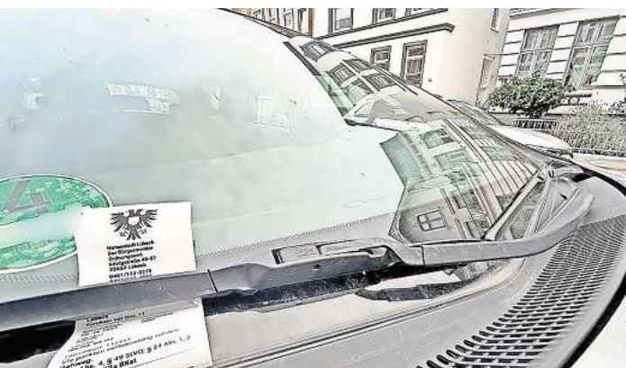
An vielen Stellen in Lübeck ist der Parkraum knapp – wie hier in der Yorkstraße. Immer häufiger beklagen sich Lübecker über falsch geparkte Autos. Das hat zum Teil Folgen wie Halteverbote.

LÜBECK. Gibt es in Lübeck nicht mehr genügend Platz für alle Verkehrsteilnehmer? Immer mehr Autos stehen immer weniger Parkraum gegenüber. Autofahrer spüren Parkdruck – besonders in den dicht besiedelten Wohnquartieren der Hansestadt. Außerdem fordern andere Verkehrsteilnehmer immer häufiger ihre Rechte gegenüber den Autofahrern ein. Die Stadt bestätigt: In Lübeck gibt es immer mehr Beschwerden über Autofahrer. Die Gründe liegen oftmals auf der Hand: Fußgänger beklagen sich über zugeparkte Gehwege, Radfahrer können Radwege wegen der Autos nicht richtig nutzen, die Feuerwehr- und Rettungswagen passen in engen Straßen, in denen viele Autos parken, kaum noch durch. Dann kommen Ordnungskräfte und die Straßenverkehrsbehörde ins Spiel. Sie gehen Bürgerbeschwerden nach, checken Sicherheitsbedenken, prüfen, ob neue Halteverbote ausgesprochen und umgesetzt werden. ORDNUNGSDIENST LÜBECK HAT MEHR MITARBEITER Wird in Lübeck verstärkt Parkraum gestrichen? Wie viele Halteverbote sind in den vergangenen Jahren in der Hansestadt tatsächlich zu den bestehenden hinzugekommen? „Wir können