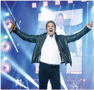
Dieter Bohlen Kulturwerft Gollan, Lübeck