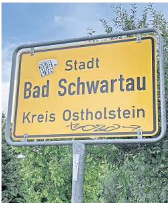
Beschmiert und beklebt: Das Ortsschild von Bad Schwartau am Rensefelder Weg ist stetig vom Vandalismus betroffen.

„Ich halte es aber bei jedem Aufkleber – auch außerhalb unserer Fußballblase – für selbstverständlich, dass der Verwender differenziert, ob er eine Sachbeschädigung begeht oder nicht“,