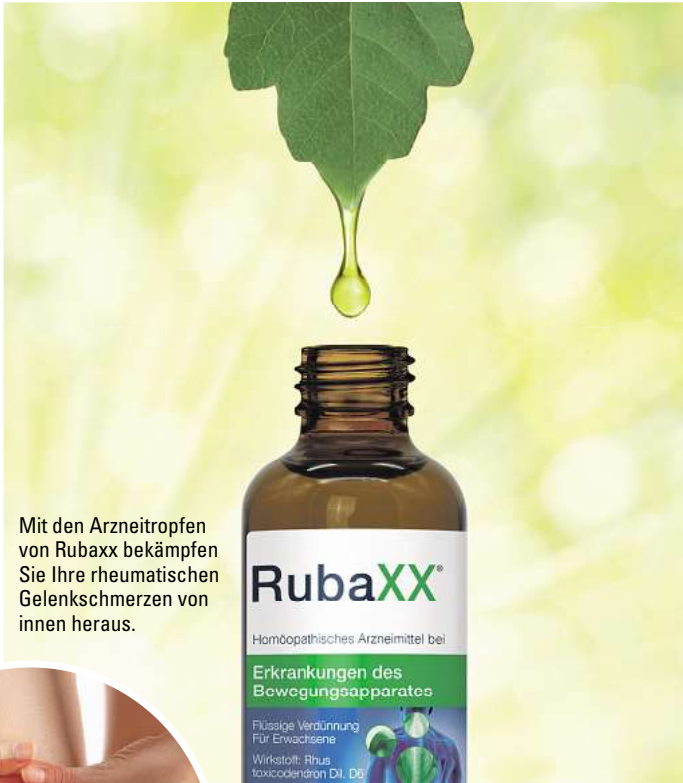
Mit den Arzneitropfen von Rubaxx bekämpfen Sie Ihre rheumatischen Gelenkschmerzen von innen heraus.

Magen zersetzt werden und finden erst nach einem langen Weg über den Verdauungstrakt ins Blut. Ein weiterer Vorteil: Dank der Tropfenform lässt sich Rubaxx je nach Stärke der Schmerzen individuell dosieren.