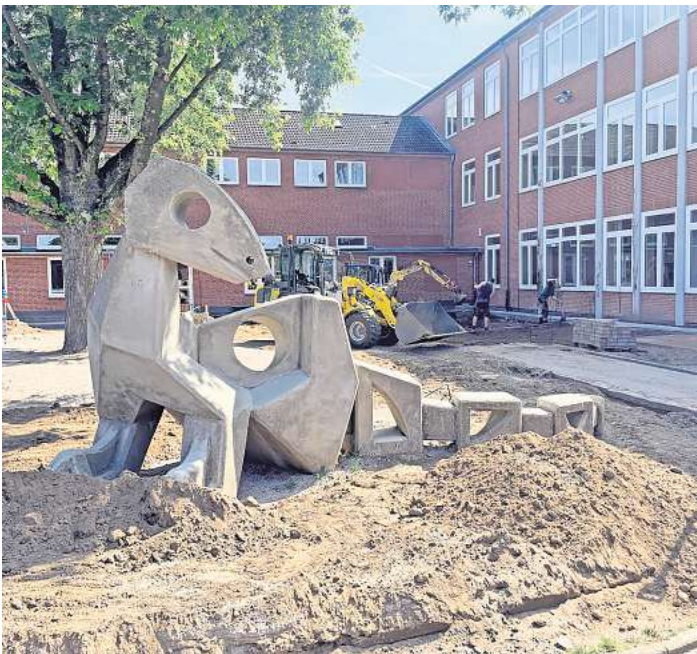
Der Schulhof der Grundschule Bad Schwartau wird umgestaltet. Der Dino bleibt aber an Ort und Stelle.