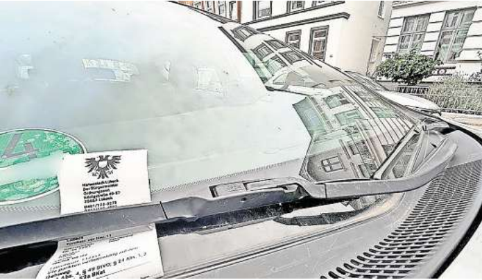
An vielen Stellen in Lübeck ist der Parkraum knapp – wie hier in der Yorkstraße. Immer häufiger beklagen sich Lübecker über falsch geparkte Autos. Das hat zum Teil Folgen wie Halteverbote.

LÜBECK. Gibt es in Lübeck nicht mehr genügend Platz für alle Verkehrsteilnehmer? Immer mehr Autos stehen immer weniger Parkraum gegenüber. Autofahrer spüren Parkdruck – besonders in den dicht besiedelten Wohnquartieren der Hansestadt. Außerdem fordern andere Verkehrsteilnehmer immer häufiger ihre Rechte gegenüber den Autofahrern ein. Die Stadt bestätigt: In Lübeck gibt es immer mehr Beschwerden über Autofahrer. Die Gründe liegen oftmals auf der Hand: Fußgänger beklagen sich über zugeparkte Gehwege, Radfahrer können Radwege wegen der Autos nicht richtig nutzen, die Feuerwehr- und Rettungswagen passen in engen Straßen, in denen viele Autos parken, kaum noch durch. Dann kommen Ordnungskräfte und die Straßenverkehrsbehörde ins Spiel. Sie gehen Bürgerbeschwerden nach, checken Sicherheitsbedenken, prüfen, ob neue Halteverbote ausgesprochen und umgesetzt werden. ORDNUNGSDIENST LÜBECK HAT MEHR MITARBEITER Wird in Lübeck verstärkt Parkraum gestrichen? Wie viele Halteverbote sind in den vergangenen Jahren in der Hansestadt tatsächlich zu den bestehenden hinzugekommen? „Wir können