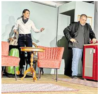
Das Kurtheater Bad Schwartau zeigt „Das Geheimnis von Cheatham Hall“.

EUTIN. Nichts für Zartbesaitete: Im August können sich Gäste jeden Dienstag, 15 Uhr, entlang der Säle und Porträts „Mörderische Geschichten“ aus dem Hause Schleswig-Holstein-Gottorf erzählen lassen, darunter Fälle wie aus einem Kriminalroman, kuriose Todesumstände und düstere Magie. Der Tod Gustav III. – erschossen während eines Maskenballs in Stockholm im März 1792 – fand sogar den Weg in die Literatur – als Opernlibretto für Verdis „Un ballo in maschera“. Info: www.schloss-eutin.de