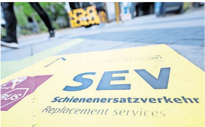
Noch bis Montag fahren zwischen Ahrensburg und Hamburg Hauptbahnhof Busse statt Züge.

Betroffen ist der Zeitraum von Freitag, 9. August, um 17 Uhr bis Montag, 12. August, um 5 Uhr. Die Bahn führt Arbeiten an Oberleitungen sowie im Kabeltiefbau aus. „Beide Maßnahmen sollen den Betrieb stabilisieren und damit für eine bessere Pünktlichkeit der Züge sorgen“, teilte die Bahn mit. Im Zuge der Sperrung werden weitere Arbeiten gebündelt erledigt, damit ursprünglich ge-