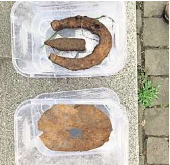
Ausgrabungen am Riesebusch in Bad Schwartau. Ein Hufeisen und ein Hammerkopf wurden entdeckt. hfr

Dass im 12. und 13. Jahrhundert eine Burg im heute dicht bewaldeten Riesebusch stand, dafür gibt es wissenschaftliche Belege. Entsprechen-