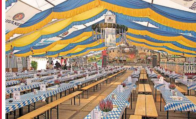
Bis 1000 Feierlustige finden Platz im bajuwarisch geschmückten Festzelt.

tober, wird er von Kay Christiansen, Norddeutschlands bekanntestem DJ Ötzi-Double, unterstützt. Am Sonnabend, 5. Oktober, treten ihm die Gebrüder Doof zur Seite. Das Bier kommt – wie immer – direkt aus München, die Preise für ein Maß sind jedoch deutlich moderater als auf den Wiesn. Bajuwarisch ist auch die Speisekarte. Ob Weißwurst, Speißbraten, Nackensteak, Krakauer oder Curry-