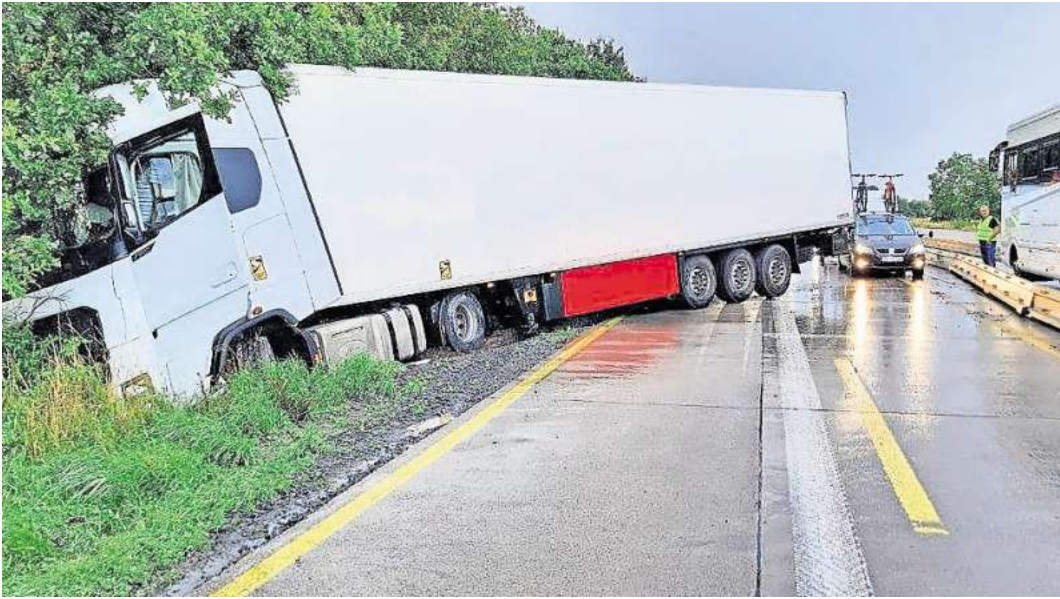
Sonntagmorgen um 7 Uhr hat sich auf der A1 zwischen Ratekau und Pansdorf ein Unfall ereignet. Ein mit Rinderhälften beladener Lastwagen ist von der verengten Fahrbahn abgekommen.

Kurz nach der Anschlussstelle Ratekau kam der 34-jährige Lastwagenfahrer aus noch nicht geklärter Ursache mit seinem Trailer nach rechts von der Fahrbahn ab und geriet auf die Bankette. Der Mann lenkte nach links. Dabei prallte das Gespann gegen die zwischen den Fahrspuren verlaufende Betonleitwand. Von dort aus schleuderte der Sattelzug wieder nach rechts und kam mit dem Auflieger und dem Fahrerhaus quer zur Fahrbahn zum Stillstand. An dem Lastwagen und an der Betonleitwand entstand erheblicher Sachschaden. Der Lastzug hatte mindestens zwölf Elemente der Betonleitwand auf die einspurige Gegenfahrbahn gedrückt. Die Unfallursache ist noch unklar, die Polizei prüft, ob plötzlicher Starkregen eine Rolle gespielt hat.