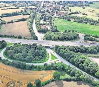
Die Baustelle der A 1 geht bei Ratekau ihrer Vollendung entgegen. Ende des Jahres soll die Erneuerung der Autobahn an dieser Stelle abgeschlossen sein.

Mit modernen Fernreisebussen ab Lübeck, Bad Schwartau und Eutin