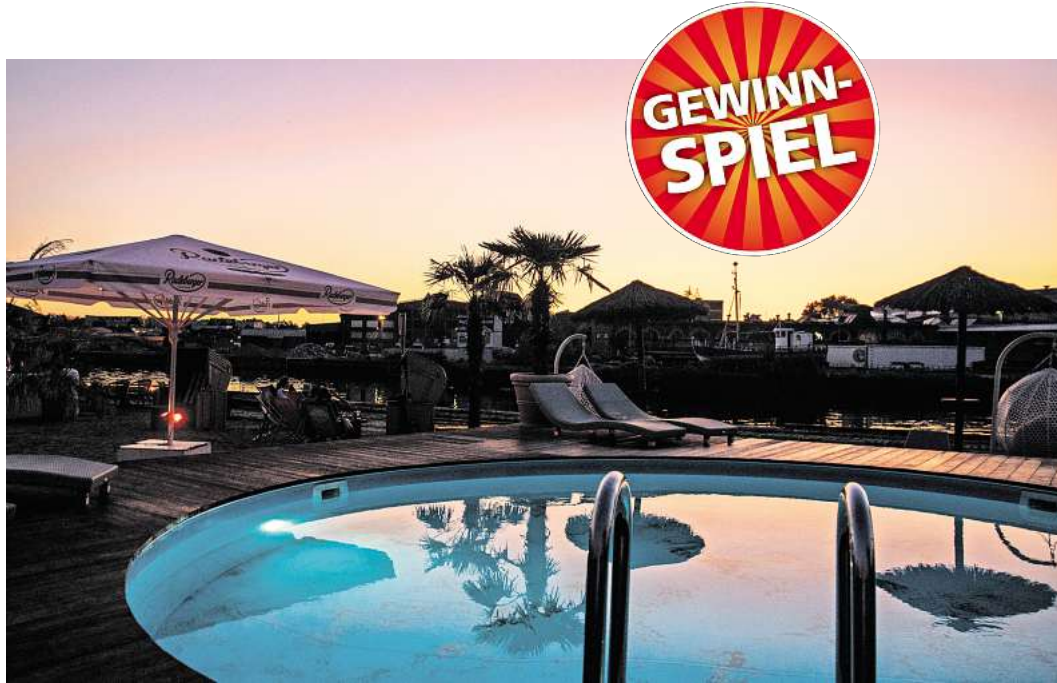
Perfekte Kulisse für die Original Ü30-Summer Closing Party: der Strandsalon.