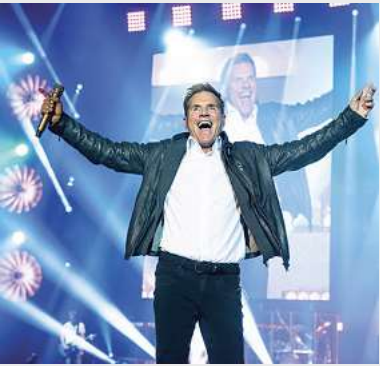
Dieter Bohlen Kulturwerft Gollan, Lübeck