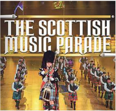
The Scottish Music Parade MuK, Lübeck