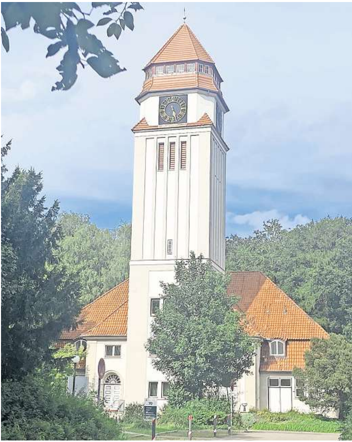
Im Hörsaal des Uni-Turm-Gebäudes auf dem Campus wird traditionell eine neue Hochschulschule gewählt.

LÜBECK. Es war die letzte Sitzung des Uni-Senats im Sommersemester, und zugleich die erste des neu formierten Gremiums. Schließlich muss die akademische Vertreterversammlung der verschiedenen Hochschulgruppen alle zwei Jahre neu gewählt werden. Ein ganz besonderes Thema – mit einer Strahlkraft weit über den Campus hinaus – wurde dabei am Mittwochnachmittag wie eine Art Staffeltab an die „frischen“ Mitglieder übergeben: Die Suche nach einer neuen Führungsfigur, also nach einer neuen Uni-Präsidentin oder einem neuen Präsidenten. Schließlich hatten Anfang des Jahres nach heftigen Turbulenzen zwei nacheinander gewählte Persönlichkeiten der Uni abgesagt. Die erste wegen unterschiedlicher Gehaltsvorstellungen, der zweite aus privaten Gründen. Doch nun scheint für den nächsten Anlauf alles gut vorbereitet zu sein. „Ich muss gestehen, dass ich mich nun um so mehr freue, dass jetzt offensichtlich im zweiten Anlauf, wie ich hörte, ein gutes Bewerberfeld gesichtet werden konnte und die Findungskommission jetzt das Wahlverfahren weiter vorbereiten kann“, sagte Prof.