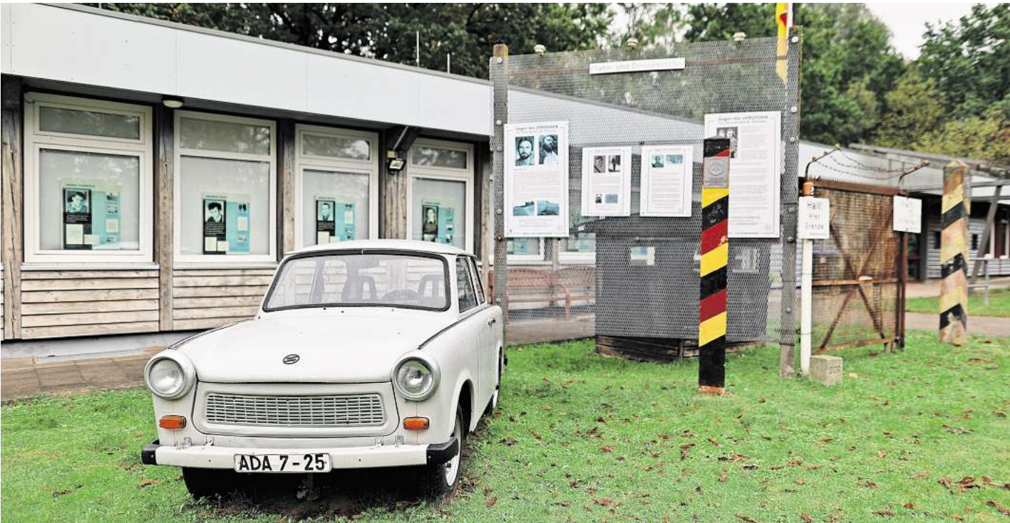
Seit 2004 gibt es die Grenzdokumentationsstätte in Schlutup.

Stadt und Land wollen das Museum weiterentwickeln, die Ausstellung klarer strukturieren, die Zahl der Exponate reduzieren, Ausstellungsstücke inventarisieren und digitalisieren. Außerdem sollen Zeitzeugen interviewt und deren Schilderungen dokumentiert werden. Diesen Weg der Pro-