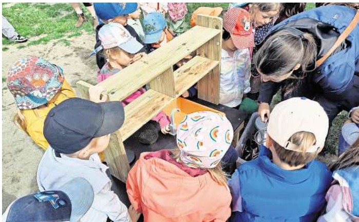
Die Kinder der Kita Langenfelde freuen sich über die neue Matschküche.