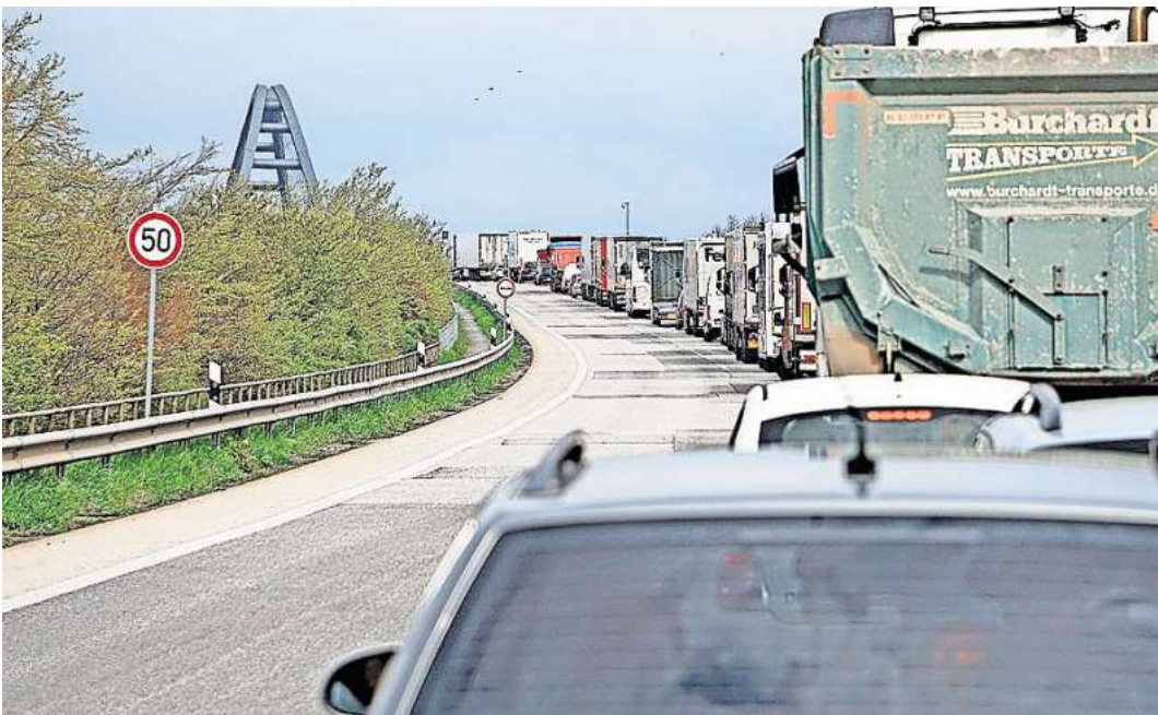
Vor der Fehmarnsundbrücke sind die Autofahrer an Staus wegen der Brückensanierung schon gewöhnt. Doch in den kommenden Jahren könnte es in Ostholstein ein einziges Stop-and-go geben. Denn die Baustellen werden sich auf den ganzen Kreis ausweiten.

Das alles klingt nicht nur viel, es ist auch viel. Die Autos stehen im Baustellen-Stau, und ein Ausweichen auf die Bahn wird kaum möglich sein. Die neue Hinterlandanbindung soll erst Ende 2029 fertig sein, wenn das denn überhaupt zu schaffen ist. Und durch den Bau werden die Regionalbahn nach Kiel und die Bäderbahn bis zu 18 Monate lang nicht fahren können.