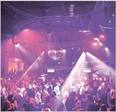
Strandsalon Ü30 Party, Lübeck