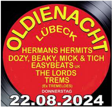
Oldienacht Freilichtbühne, Lübeck