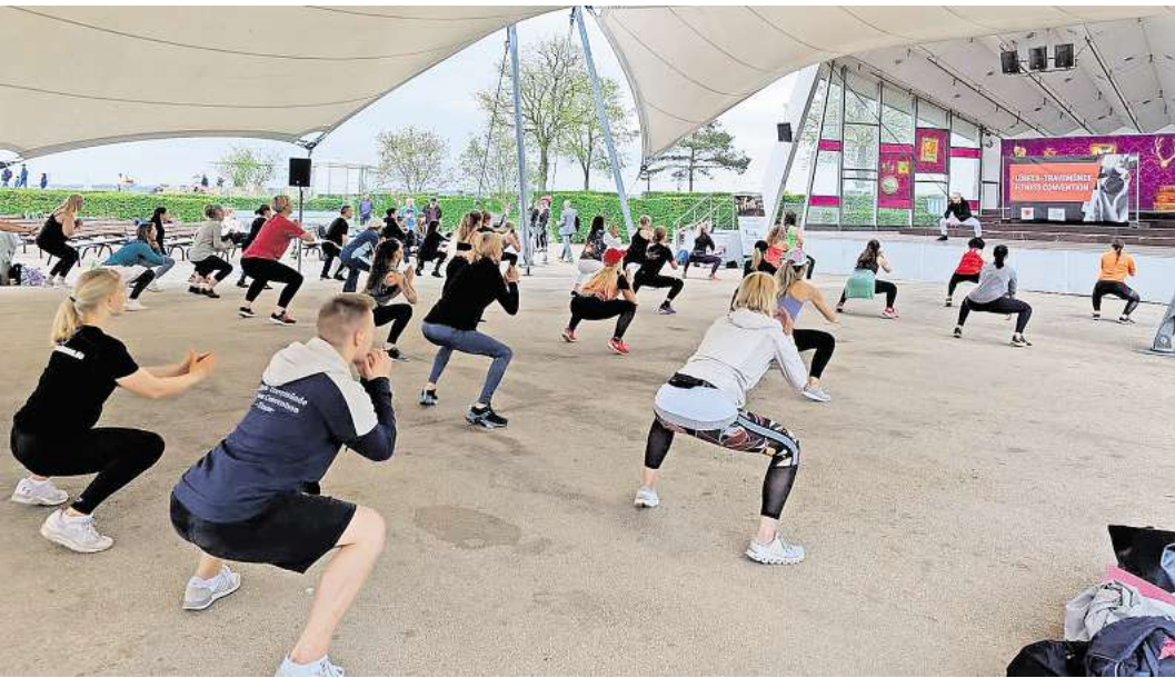
Während der Fitness Convention können verschiedene Formate ausprobiert werden.