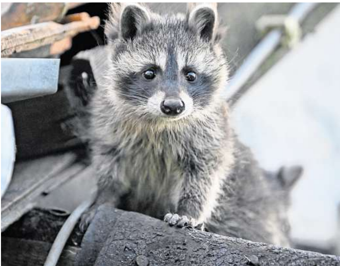
Sie werden immer dreister und immer mehr. Um die Waschbren-Population in den Griff zu bekommen, gibt es in Krze ein Jagdfallen-seminar.

Zur Bejagung von Waschbren nutzen Scharf und seine Kollegen