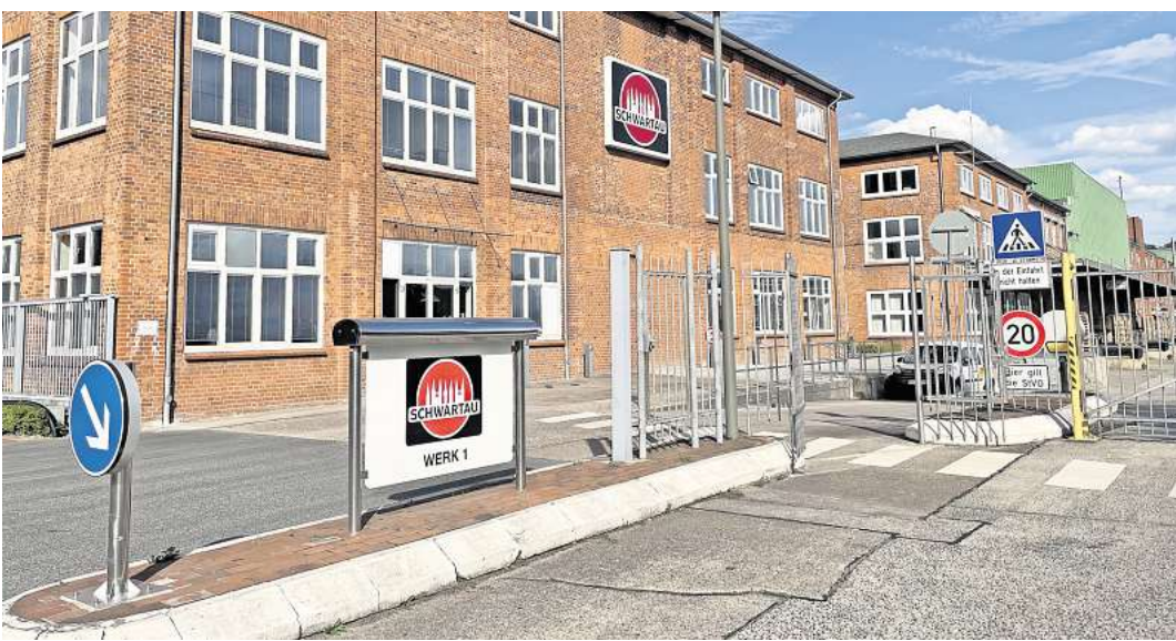
Die Schwartauer Werke in der Lübecker Straße gibt es bereits seit 125 Jahren. Vor genau 100 Jahren entwarf der Künstler Alfred Mahlau das Logo mit den sieben Türmen.

als 6500 Betriebe. Von den knapp über 200.000 Einwohnern gelten rund 77.000 als sozialversicherungspflichtig beschäftigt. Die Arbeitslosenquote lag im April bei 4,7 Prozent und somit deutlich unter dem Bundesschnitt von 6,0 Prozent. Hinzu kommt, dass sich immer mehr Menschen selbstständig machen. Die Entwicklungsgesellschaft Ostholstein (Egoh) begleitet Gründer. In den ersten beiden Monaten