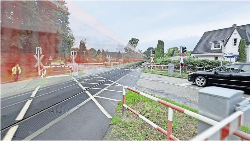
Wenn die alte Trasse nicht mehr genutzt wird: Der Bahnübergang Sereetzer Weg in Ratekau wird zurückgebaut. Die Strecke verläuft mit dem Bau der neuen Beltunnel-Schienenanbindung weiter östlich, entlang der A 1.

Apropos Immissionen: Ratekaus Bürgermeister sieht durch das Ansinnen der Schwartauer den Bundestagsbeschluss von 2020 in Gefahr. 232 Millionen Euro wurden Ostholstein zugesagt, um Lärmschutz oberhalb der gesetzlichen Mindestanforderungen vorzuhalten. „Dafür haben wir jahrelang gemeinsam gekämpft. Mit einer Abkehr vom vorgesehenen