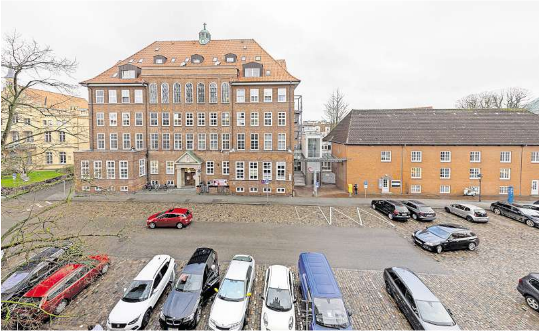
Eine über 135-jährige Geschichte ist im vergangenen Jahr beendet worden: Das Marien-Krankenhaus in Lübeck war bei Einwohnern der Hansestadt sehr beliebt.

Das katholische Erzbistum hat dann Anfang März 2024 Insolvenz für das Lübecker Marien-Krankenhaus angemeldet. Die meisten der rund 140 Mitarbeiter hatten zu diesem Zeitpunkt bereits ihren Arbeitgeber gewechselt. Der Großteil ist seither für das UKSH tätig und arbeitet dort auf dem Campus – zum Teil ge-