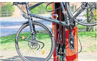
Diebstahlgesichert: Die Werkzeuge sind mit Drahtseilen an den Stationen befestigt.