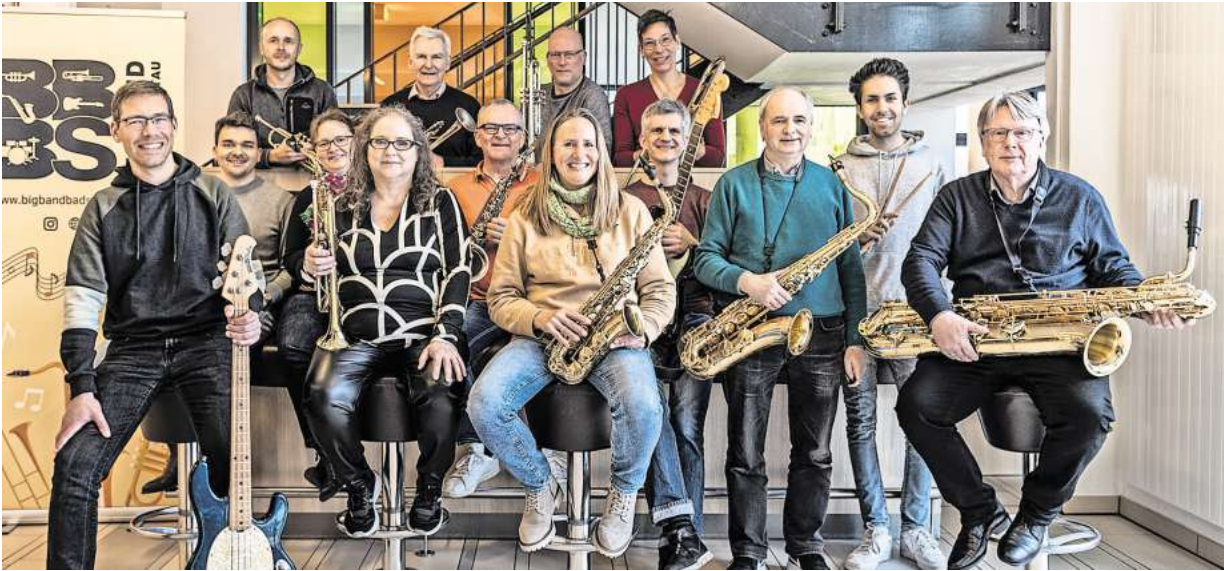
Die Big Band Bad Schwartau spielt ab 15 Uhr in der Bad Schwartauer Konzertmuschel. Davor musizieren das VfL-Orchester Fortissimo und die Brassband der Feuerwehren Bad Schwartau.

BAD SCHWARTAU. Die Stadt Bad Schwartau lädt am Sonntag, 5. Mai, zum Bad Schwartauer Kultursonntag in den Kurpark ein. Unter dem Motto „Schwartau schunkelt“ präsentieren drei Bad Schwartauer Orchester ihr Können in der Konzertmuschel: Von 10 bis 11.30 Uhr spielt das Orchester fortissimo des VfL Bad Schwartau, von 12.30 bis 14. Uhr die Brassband der Feuerwehren Bad Schwartau und von 15 bis 16.30 Uhr die Big Band Bad Schwartau. Mit Bratwurst und Kuchen sorgen Mitglieder der Feuerwehren Bad Schwartau für das leibliche Wohl der Besucher. Zudem bietet ein Coffee-Bike im Retrolook raffinierte Kaffeespezialitäten an.