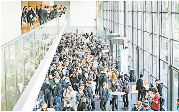
Uni und TH Lübeck laden am 24. Mai ein.

Am Vormittag des COAL haben Studieninteressierte die Möglichkeit, Einblicke in die Technische Hochschule Lübeck und die Universität zu Lübeck zu bekommen. Sie können in die Studiengänge reinschnuppern, Labore besichtigen, mit Lehrenden sprechen und sich informieren, welche zukünftigen Berufsfelder sie erwarten. An der Universität zu Lübeck stehen ProfessorInnen, Studiengangsleitungen sowie Studierende für Fragen zur Verfügung und es wird Campusführungen geben. Damit auch diejenigen nichts verpassen, die vor Ort nicht dabei sein können, wird es Livestreams zu den großen Veranstaltungen der Universität zu Lübeck geben. „Es ist toll, dass die Universität und die TH Lübeck in diesem Jahr