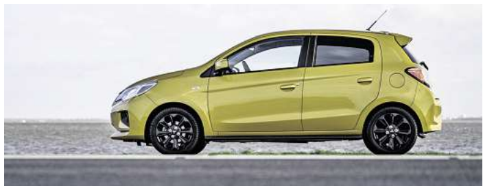
Der Mitsubishi City-Flitzer „Space Start“ bietet Sicherheit und Komfort

Autohaus am Bungsberg in Lübeck, Bei der Lohmühle 3, 23554 Lübeck, Tel 0451/2905 79-0, www.mitsubishi-ambungsberg-luebeck.de