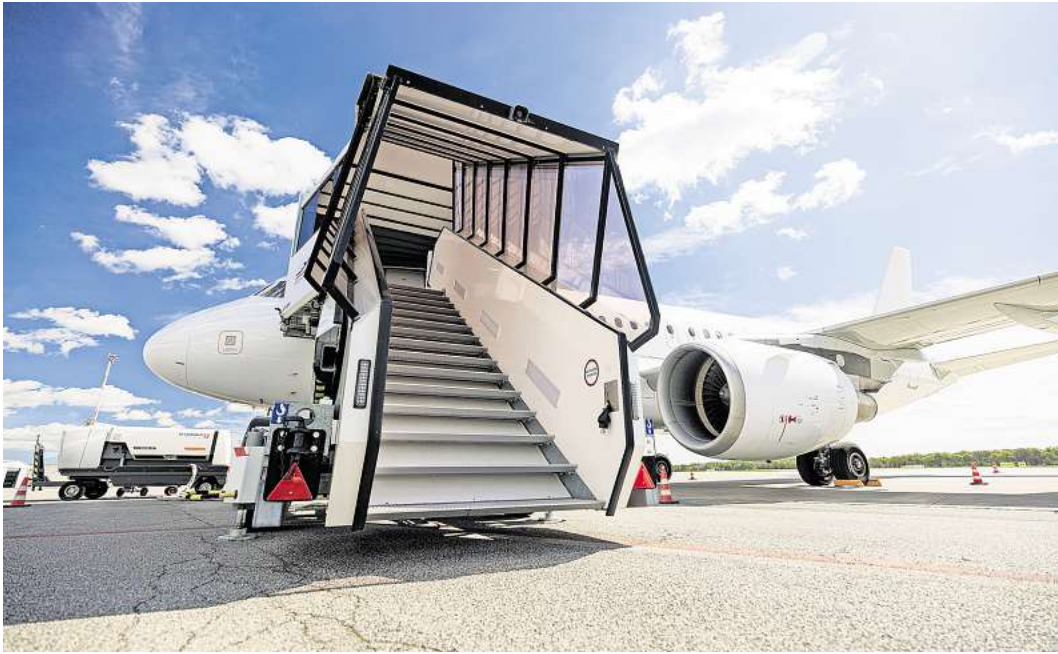
Gerade erst in Blankensee gelandet und schon zum Einsteigen bereit: der in Lübeck stationierte A 319 der Sundair.

„Die Fluggesellschaft hat sich als ein besonders zuverlässiger Partner erwiesen“, sagt Lübecks Airport-Geschäftsführer Prof. Jür-