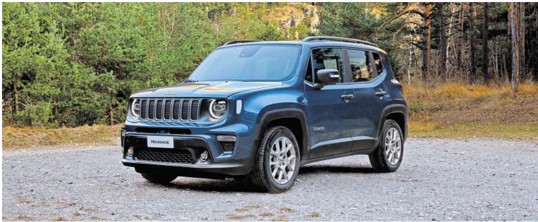
Der Jeep Renegade ist für anspruchsvoll Offroad-Touren bestens geeignet.

Dank des neuen Infotainment-Systems wird die Nutzung vernetzter Dienste einfach und flüssig. Sobald die Jeep App mit dem Fahrzeug verbunden ist, erfolgt