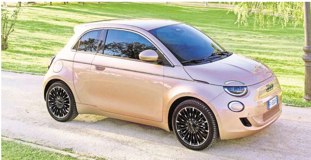
Die kleinen Fiat-Modelle sind weltweit sehr beliebt und im Autohaus am Bungsberg erhältlich.

Seit der Präsentation des Fiat 500 Elektro* ist die BEV-Familie innerhalb der Marke Fiat ge-