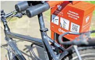
Das Rad kann an den Griff gehängt werden und für Reparaturanleitungen gibt es einen QR-Code.

erfolgreicher Ausschreibung hat die BQL Berufsausbildungs- und Qualifizierungsagentur Lübeck GmbH den Zuschlag erhalten. Alle Stationen werden regelmäßig kontrolliert, ob alle Werkzeuge vollständig vorhanden sind“, teilt die Stadt mit. Sollte bei der Nutzung einer Station Mängel auffallen, können diese per Online-Formular unter https://bql.gmbh/fahrrad-servicestationengemel-