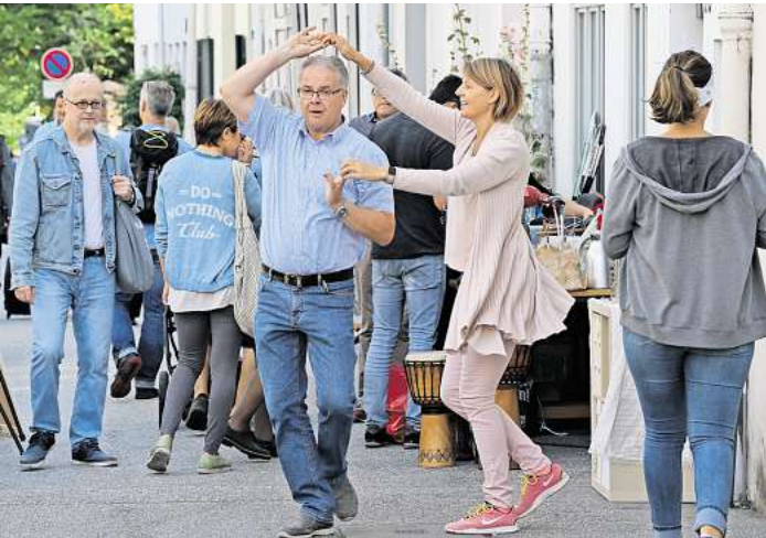
Ein kleines Tänzchen beim Straßenfest: Veranstaltungen wie diese sind bei Kommunen anzumelden.

OSTHOLSTEIN. Der Keller ist voll, der Boden auch. Den Nachbarn geht es genauso. Aber das ganze Gedöns im Auto verstauen und irgendwohin zum Flohmarkt fahren? Für viele zu aufwendig. Ein Straßenverkauf vor der Haustür wäre eine Alternative. Aber muss man ihn anmelden? Und wo? Welche Vorschriften gelten für ein Nachbarschaftsfest, ein privates Feuerwerk oder die Gartenparty? Nahezu alle Veranstaltungen und Aktivitäten müssen bei der Stadt oder der Gemeinde angemeldet werden. Einige Kommunen bieten auf ihren Webseiten entsprechende Formulare zum Herunterladen an. Praktisch: So weiß gleich jeder, welche Angaben er