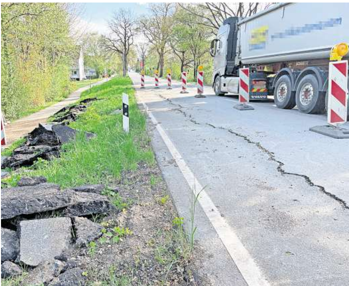
Seit mittlerweile vier Jahren ist die B 432 in Ahrensbök am Ortsausgang Richtung Bad Segeberg abgesackt. Die nur etwa 50 Meter lange Schadstelle wird voraussichtlich auch 2024 nicht repariert.