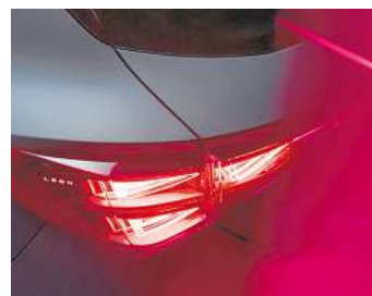
Enigmatisch: der neue Cupra Leon.

Die Weltpremiere des neuen Formentor und des neuen Leon unter dem Motto „Design Obsession“ wird ein emotionales Event, das den Cupra Tribe zusammenbringt und die Ambitionen der Marke untermauert.