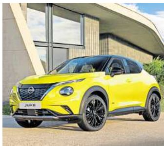
Der Nissan Juke ist ab Mai erhältlich

Der elektrifizierte Nissan Juke Hybrid kombiniert einen speziell für den Hybridantrieb konzipierten Verbrennungsmotor, der 69 kW/94 PS und 148 Nm Drehmoment entwickelt, mit einem kleinen Elektromotor mit 36 kW/49 PS und einem Drehmoment von 205 Nm. Unterstützt wird das Aggregat von einem 15-kW-Hochspannungs-Startergenerator, einem Wechselrichter und einer wassergekühlten 1,2-kWh-