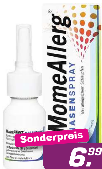
MomeAllerg Nasenspray 140 Hub *