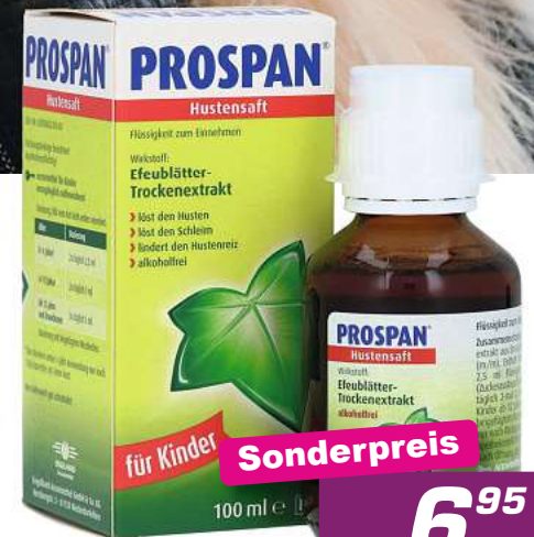
Prospan Hustensaft 100 ml *