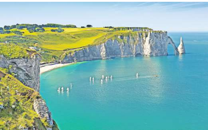
Sehnsuchtsort: Die Klippen von Étretat.

LÜBECK/ HAMBURG. Die schönste Reisezeit kommt jetzt: Nicht nur die Natur erwacht...die Tage werden länger, sattes Grün steht auf Wiesen und Feldern und die buntesten Frühlingsblumen im Garten erfreuen das Auge...Aufbruchsstimmung liegt in der Luft! Warum also nicht gleich den Koffer packen und gemeinsam mit maximal 30 netten Mitreisenden auf große Entdeckungstour nach Südengland & Nordfrankreich gehen (7. - 16.6. / € 2199,- p. P. im DZ/HP)? Und im knallroten 5*-Reisebus mit Panoramaglasdach reist es sich gleich noch mal so gut. Außerdem ist der bequeme Haus-zu-Haus Taxiservice auch ab Lübeck und Umgebung, die kostenlose Einzelplatzgarantie für Alleinreisende und ein abwechslungsreiches Besichtigungsprogramm ebenso im Preis enthalten wie die Übernachtung