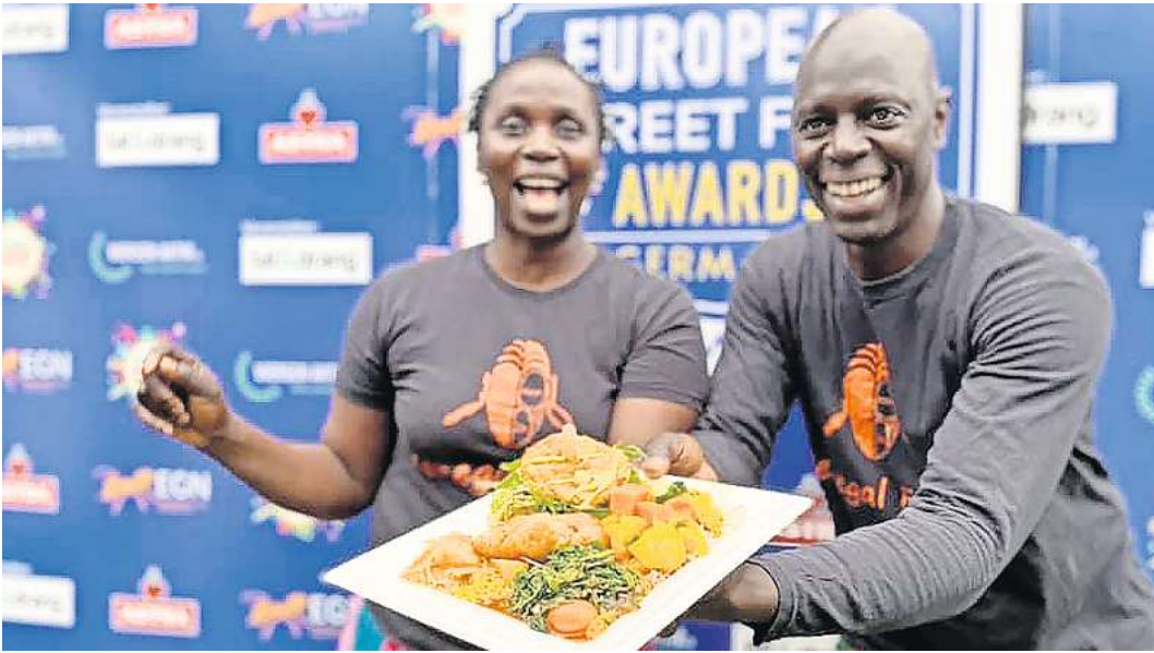
Speisen aus aller Welt werden beim Streetfood-Festival im Kurpark von Bad Schwartau vom 23. bis 25. August angeboten.