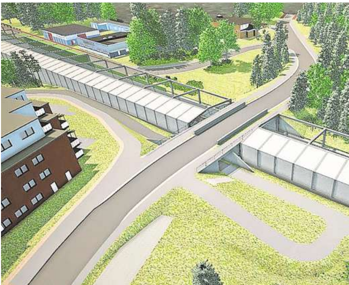
So könnte die Querung für Autofahrer über den Trog am derzeitigen Bahnübergang Kaltenhöfer Straße aussehen. Visualisierung: DB

Bei der anschließenden Präsentation der Pläne, die einen Lärmschutz von rund 100 Millionen Euro beinhaltet – ging es allerdings deutlich ruhiger zu. Auf der Leinwand wurden Visualisierungen von der ge-