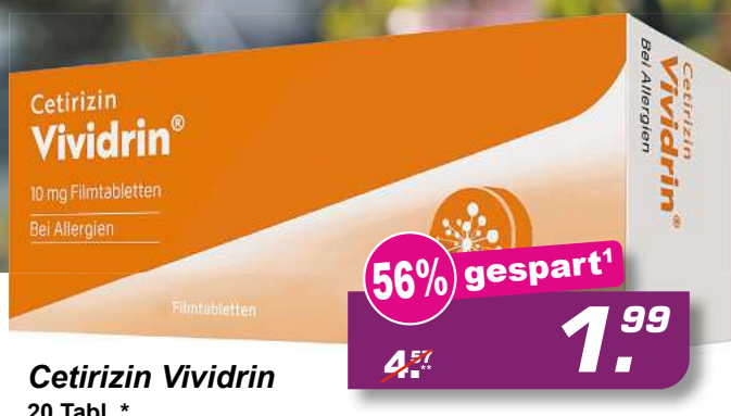
Cetirizin Vividrin 20 Tabl. *