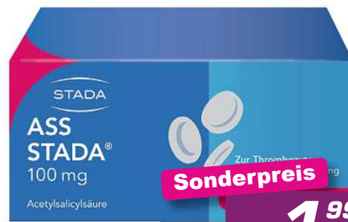
ASS Stada 100 mg 100 Tabl. *