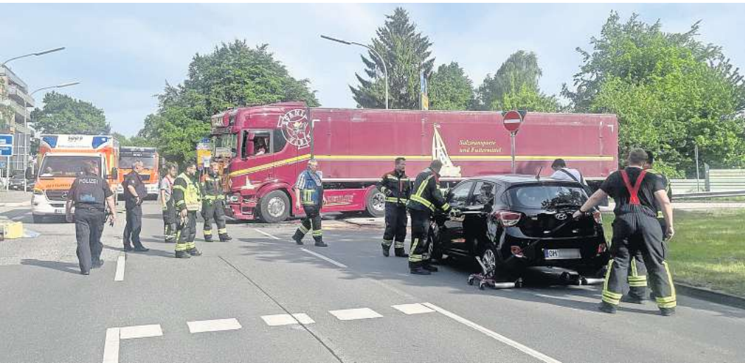
Im Mai 2023 sind an der Auffahrt zur A 1 in Bad Schwartau ein Kleinwagen und ein Lastwagen zusammengestoßen. Die Kreuzung A 1/Cleverbrücker Straße ist mit acht Unfällen einer der zwei größten Unfallschwerpunkte in Ostholstein.

Insgesamt meldet die Polizei für das vergangene Jahr 6238 Verkehrsunfälle mit 155 Schwerverletzten und 1056 Leichtverletzten. Die Gesamtzahl der Unfälle ist der höchste Wert