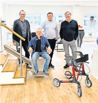
Die mobile Treppenlift-Vorführanlage in der neuen Zentrale von Ostsee-Medizintechnik.

„Unser Ziel ist es, unseren Kunden nicht nur Produkte anzubieten, sondern ihnen auch die Möglichkeit zu geben, ihr Leben in vollen Zügen zu genießen“, sagt Geschäftsführer Marco Wilms. „Durch eine kostenlose und unverbindliche Beratung im eigenen Zuhause sowie eine umfassende Auswahl an Produkten und Modellen streben wir da-