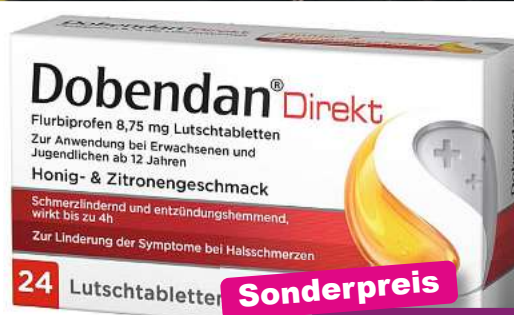
Dobendan Direkt Honig- & Zitronengesch. 24 Lutschtabl. *