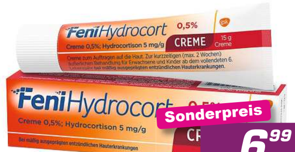
FeniHydrocort 0,5% Creme 15 g *