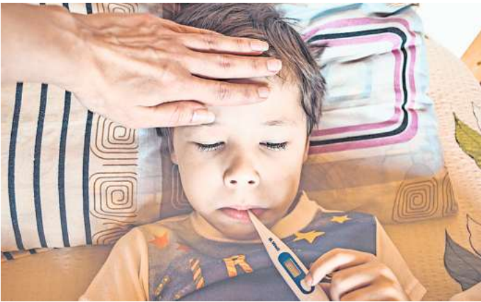
Was tun wenn der Nachwuchs Fieber hat?

Auch regelmäßige Bewegung an der frischen Luft trainiert das Herz-Kreislauf-System und die Abwehrkräfte. Zudem ist es gut, den Stresspegel im Rahmen zu halten, denn viel Stress macht anfälliger für Infektionen.