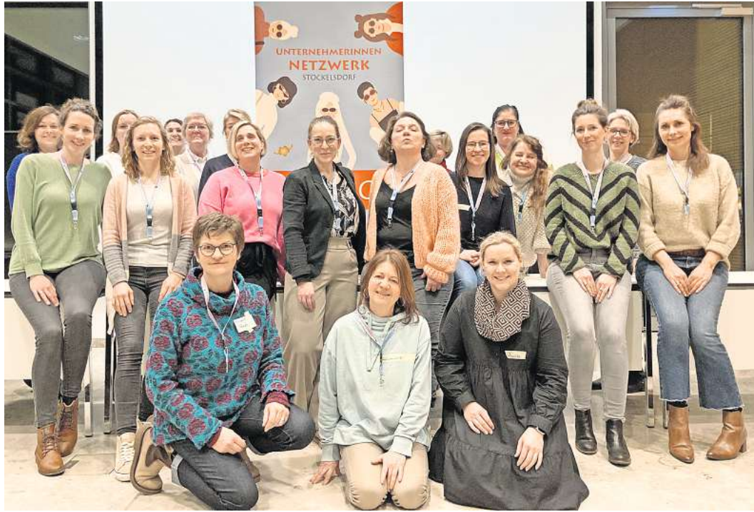
Einige der Ausstellerinnen, die bei der Messe dabei sind.