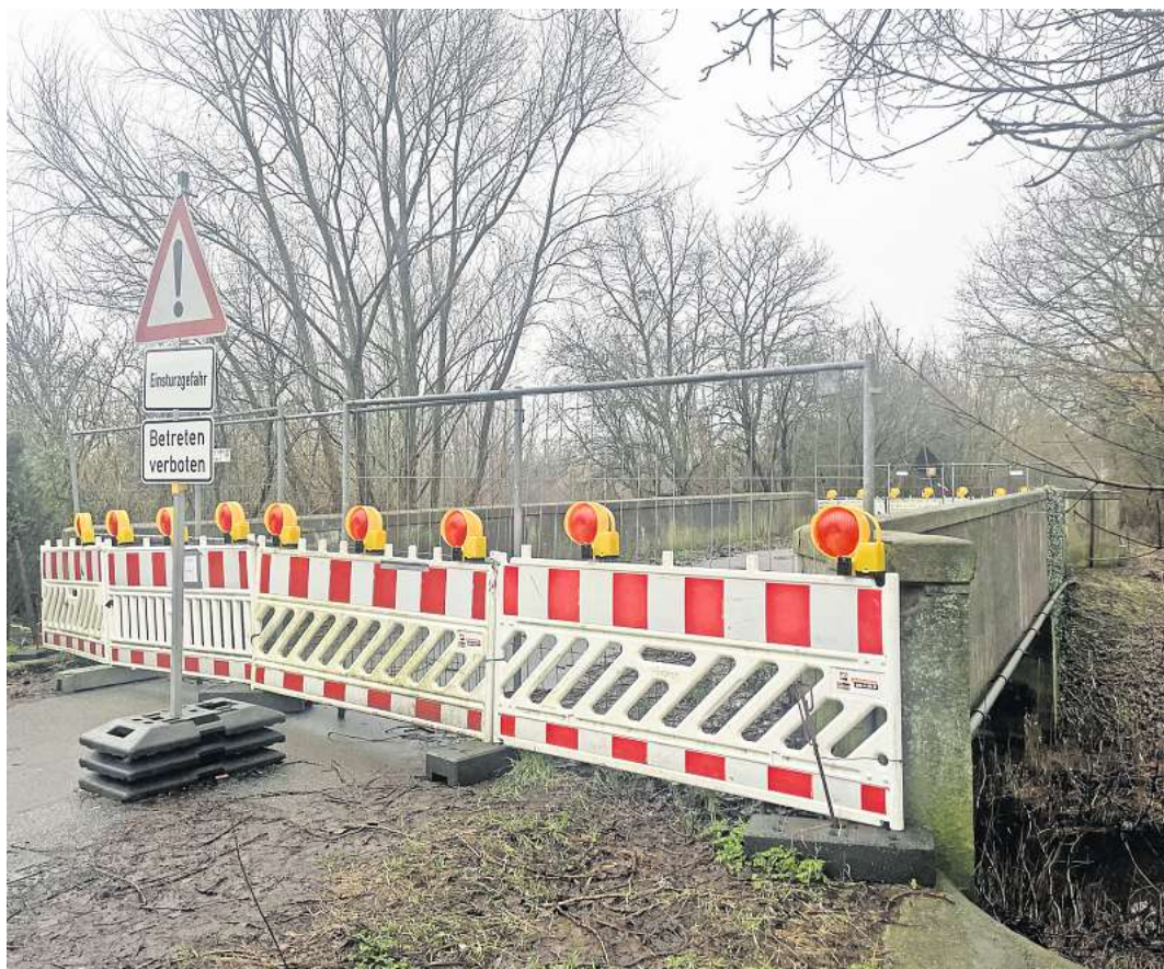
Einsturzgefahr: Die Brücke über die Alte Schwartau zwischen Sereetz und Bad Schwartau in der Kaltenhöfer Straße bleibt gesperrt. Eine Behelfsbrücke oder ein Ersatzbau sind nicht in Sicht.

BAD SCHWARTAU. Schnell und kostengünstig – auf diese Lösung haben Bad Schwartaus Politiker bei der kleinen Brücke zwischen Sereetz und Bad Schwartau am Ende der Kaltenhöfer Straße gesetzt. Doch nun geht es weder schnell noch kostengünstig. Nicht nur der Plan, das Technische Hilfswerk (THW) um Unterstützung bei der Errichtung einer Behelfsbrücke zu bitten, hat seine Tücken.