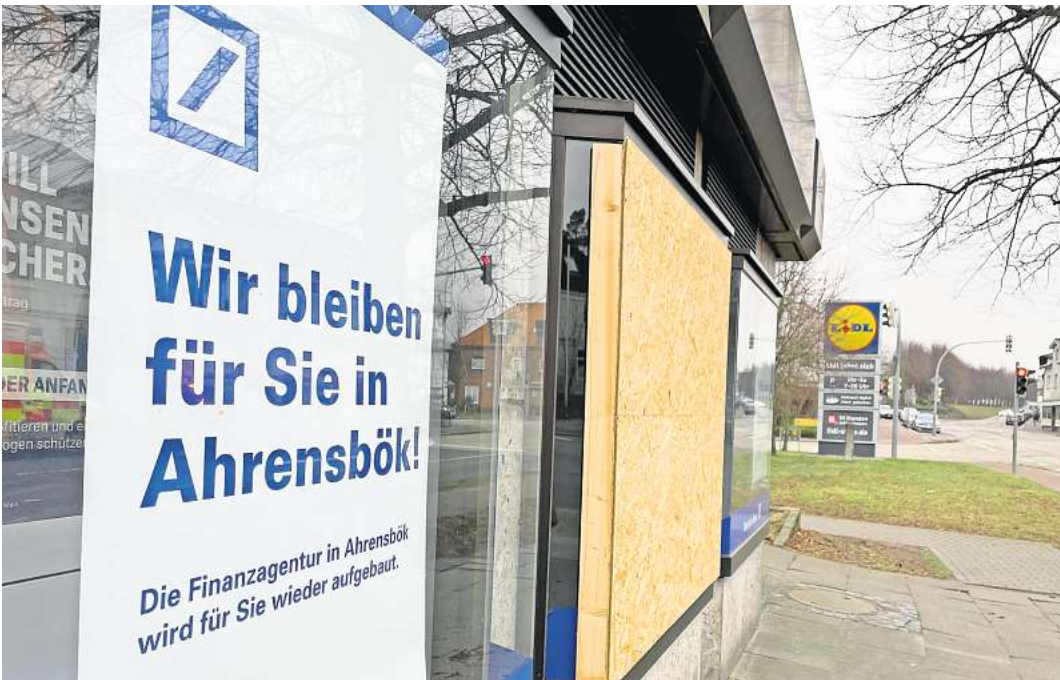
Nach der Sprengung des Geldautomaten und der Beschädigung der Filiale verspricht die Deutsche Bank, dass sie in Ahrensbök bleibt.