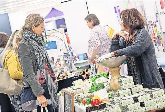
Die Lebensfreude Messe lädt zwei Tage lang in die Media Docks ein.